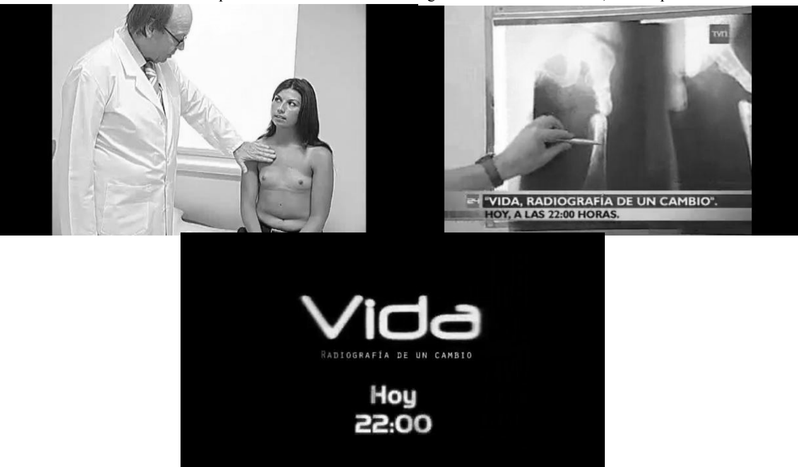
Imagen 27: Escenas de la temporada 2007 del programa Vida: Radiografía de un cambio

Debemos entonces dudar de cómo se construye lo real y verdadero de la televisión porque esta consideración de lo serio articula significados consensuados “para todos los gustos (...) que no deben escandalizar a nadie, en los que no se ventila nada, que no dividen” (Bourdieu, 1997:22). Esto no significa que la televisión literalmente crea realidad , porque los televidentes no aceptan ni reconocen esta realidad como propia, sino más bien la excluye como defectuosa, contaminada, porque se sabe “que todo está pauteado, que todo tiene que seguir una línea. Nada es tan real en la tele” (FG 6, mujeres). Los espectadores desconfían y no se hacen parte de esta propuesta televisiva que genera un miedo social. Pero esto no impide la estructuración de otra legitimación de una realidad, es la esperanza