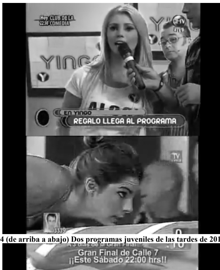
Imagen 4 (de arriba a abajo) Dos programas juveniles de las tardes de 2010: Yingo y Calle 7

¿Sin embargo, qué ocurre con representaciones que escapan de la norma del género? Aquellas representaciones irregulares que tensionan las identidades sexuales, que se ubican en un entre los géneros o que se convierten en problemáticas representaciones del género porque no son suficientemente normales, que proponen una mirada en tensión de las sexualidades que emergen y desaparecen de la televisión. Por lo mismo es necesario mantener la pregunta como tal “¿tiene sexo la comunicación?” y describir el proceso de articulación. Estos “restos” del desborde de la representación, estos “significados inútiles” o deslegitimados son para la presente investigación parte de su observación y análisis,