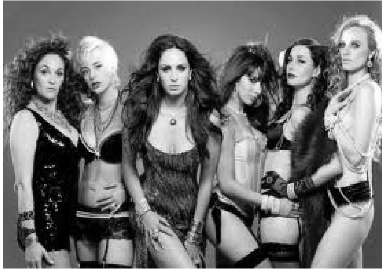
Imagen 19: Teleserie nocturna Mujeres de Lujo del verano de 2010 donde sus protagonistas son mujeres dedicadas a las prostitución de alto nivel

Por otra parte debemos señalar que la investigación permite reconocer distintos tratamientos de parte de los y las entrevistadas en los grupos de discusión respecto al tratamiento de la homosexualidad en la televisión. Si como se señaló la homosexualidad en hombres es una categoría que complica, incomoda y necesita de reestructuraciones normativas, para las mujeres entrevistadas en cambio la homosexualidad es aprehendida con mayor naturalidad y también es una excusa para criticar el uso de la sexualidad no-heterosexual en la televisión: