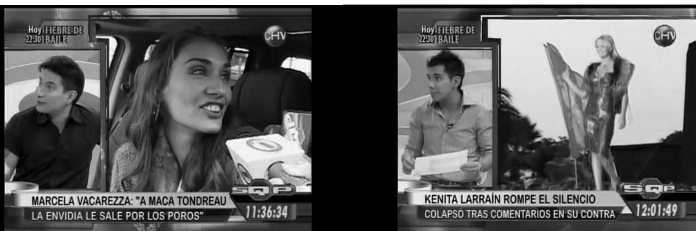
Imagen 25: Dos escenas del programa de farándula SQP comentando casos de la vida privada de otros personajes de la televisión chilena (2010)

Para los espectadores la dimensión de lo privado –lo cotidiano del cuerpo, la intimidad banal– constituye casi una infección para los contenidos de la televisión, un mal que corroe los valores culturales de este dispositivo. Lo privado se articula taxativamente como lo opuesto a lo público , porque los cuerpos desnudos, el paroxismo de la confesión y los deseos (in)ciertos mediatizados son unas plataformas que no lograrían proyectarse como acciones que impacten lo social , son aún una dimensión minoritaria simbólicamente, a pesar de que sus contenidos paradójicamente son “mayoritarios”, pues exceden y sobreabundan la televisión, y porque hablan el lenguaje de lo común y lo establecido. Acá