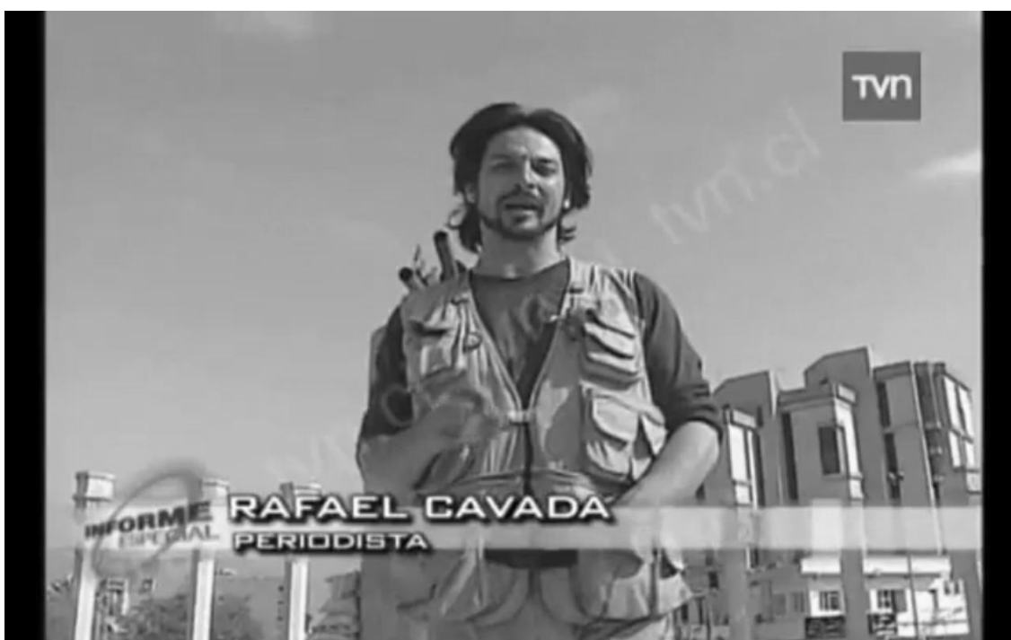
Imagen 10: Periodista Rafael Cavada cubriendo la guerra de Irak en programa Informe Especial

Lo “cultural” mediatizado deviene en un espacio narrativo sin pliegues y principalmente dueño de un lenguaje objetivo. Es así como la masculinidad genera un proceso de identificación con actores y objetos posicionados en el formato audiovisual de lo serio , legitimado en una discursividad periodística-documental, donde una subjetividad dominante destaca el rol de una experiencia real infranqueable en la expedición de otros territorios naturales. La subjetividad televisiva está obsesionada con un deseo de heroísmo construido al descubrir otras tierras, otros cuerpos, una otredad controlada a través de la mediatización objetiva de un viaje que aparece como extático a la televisión. Los fragmentos de un heroísmo televisivo realista son realzados por la subjetividad masculina,