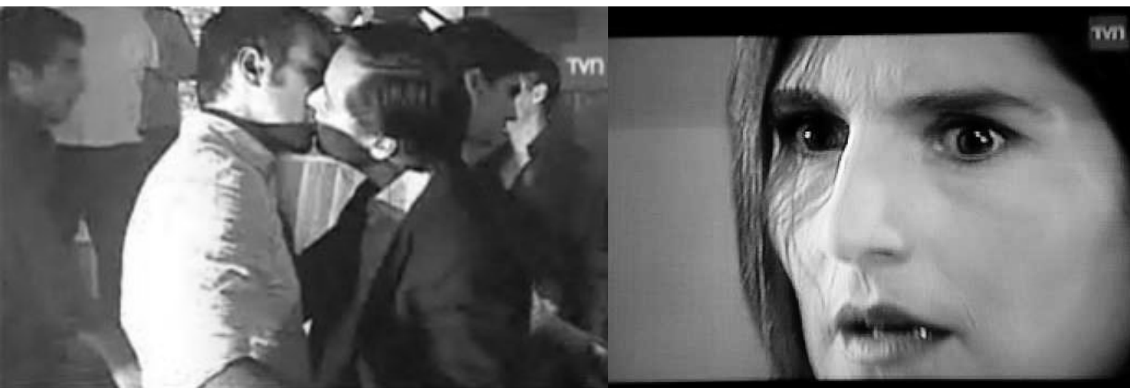
Imagen 18: Secuencia en torno a un beso homosexual en la teleserie nocturna ¿Dónde está Elisa? anormales a partir de sus leyes. Es así como la homosexualidad pudo (y en algunos casos sigue siendo) considerarse una patología. Pero también el psicoanálisis tuvo impresionantes episodios, ahora ya paródicos, para comprender la homosexualidad como una perversión frente a las normas establecidas donde por ejemplo “la heterosexualidad es “plena” frente a una homosexualidad [a la] que le falta el objeto esencial del deseo [la mujer]” (Hocquenhem, 2009:53).

La ciencia moderna es un ejemplo notorio de una tecnología de poder que produce sujetos