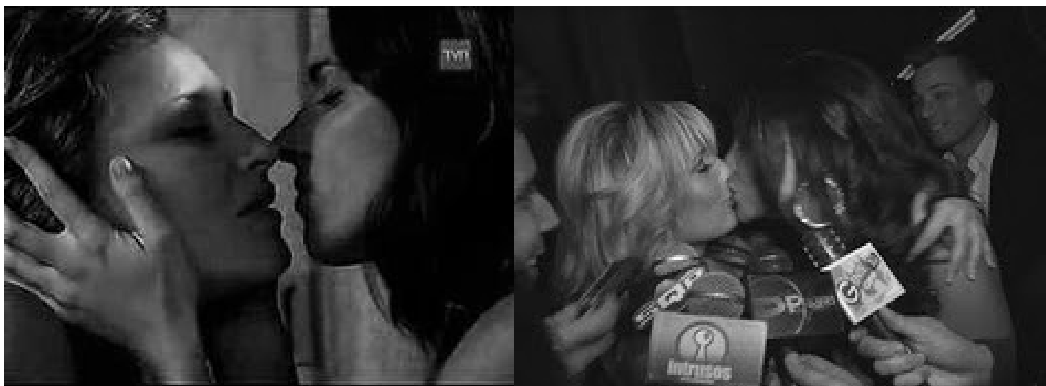
Imagen 20: Dos besos lésbicos en la pantalla

igual encuentro que es algo interesante, porque si es algo tan masivo, que llega a todo el público chileno, encuentro que es super interesante mostrar los tabú, las cosas que no se hablan en una mesa cachai, de familia conservadora” (FG 6, mujeres)