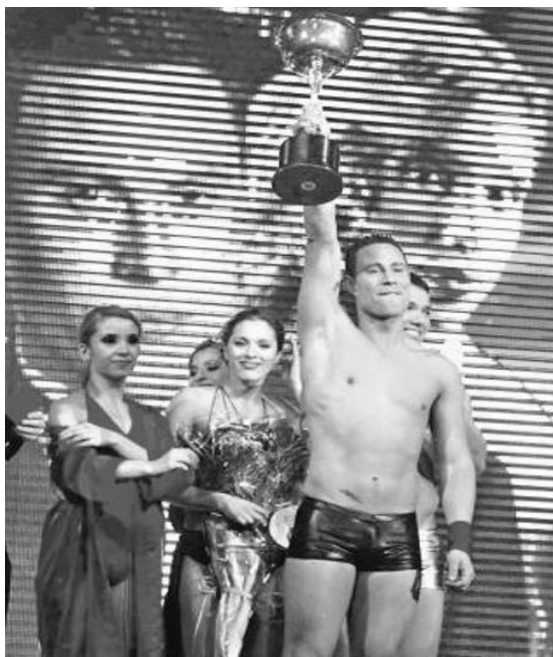
Imagen 16: Premiación final del programa Fiebre de Baile temporada 2010

Si las mujeres aparecen como posibles víctimas y sujetos imperfectos en la representación de la televisión, esto conlleva una construcción de una esperanza de modificación y arreglos de las distorsiones estructurales de las cuales son víctimas las “mujeres” mediatizadas, es decir, la subjetividad mediatizada de los espectadores asume que es posible re-establecer el género , mejorar las representaciones de la sexualidad a un orden original y pensado como ideal. La tecnología ha sido utilizada para readecuar las sexualidades polimorfos o intersexuales, adecuar los cuerpos de mujeres y hombres a ciertos patrones culturales neoliberales y también para regular la fertilidad de la sexualidad femenina. Es así como tecnología y sexualidad conviven, pero en el caso de la asumida misógina televisiva los televidentes proponen ajustar el sexo de la televisión restando su machismo y neutralizando la eroticidad de las representaciones femeninas. Ajustar es un verbo que llama a neutralizar y reordenar un algo descalibrado, en este caso la sexualidad femenina es la inestable. Cabe preguntarse ¿cuál es la normal y equilibrada representación mediática de la sexualidad femenina en la televisión? ¿qué tanto es una defensa a los “derechos mediáticos de las mujeres” proponer ajustar el sexo femenino de la pantalla y no corresponde a una rearticulación de un orden moral de lo femenino?