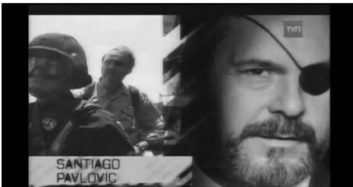
Imagen 29: Presentación del programa de investigación periodística Informe Especial , temporada 2009.

El género femenino se enumera como una serie de actos o donde se hace explícita la performatividad del género (figurar en la pantalla, implantarse silicona, hacer peligrar la vida), características que develan la condición reiterativa y citacional del género establecida por Judith Butler (Butler, 1999). O también en palabras de Rancière se devela la ficción del género “el lugar donde la convención se expone abiertamente, donde el texto desaparece como tal (...) se vuelve análogo a una “receta” que sirve para montar la pieza, para hacer la representación” (Rancière, 1998:44). O en términos de lo doméstico-privado que se confunde y es parte del discurso no-serio que al develar la ficción del género no hace sino producir una “nueva ficción de domesticidad a través del proceso mismo de su representación mediática (...) es la producción de una domesticidad orquestada y coreografiada con dispositivos técnicos de vigilancia y de reproducción audiovisual” (Preciado, 2010:84).