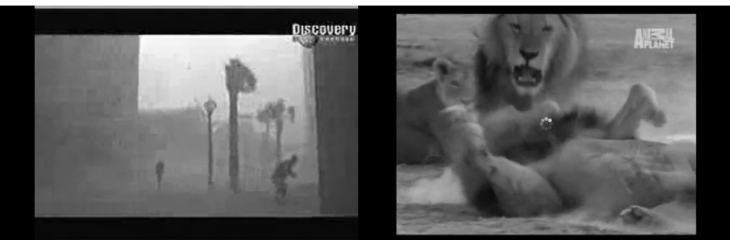
Imagen 9: Imagen de programa sobre catástrofes naturales en Discovery Channel . Animales feroces en Animal Planet .

“yo a los tipos de farándula [los] encuentro muy estúpido, muy wueón, es el Schilling, ese wueón lo único que piensa es en las pesas. Es un cabeza de músculos. Es puro cuerpo y de repente llega a ser tan asqueroso tanto músculo que tiene, si porque por ejemplo en Fiebre de Baile no podía bailar bien por los músculos” (FG 4, hombres, la cursiva es mía).