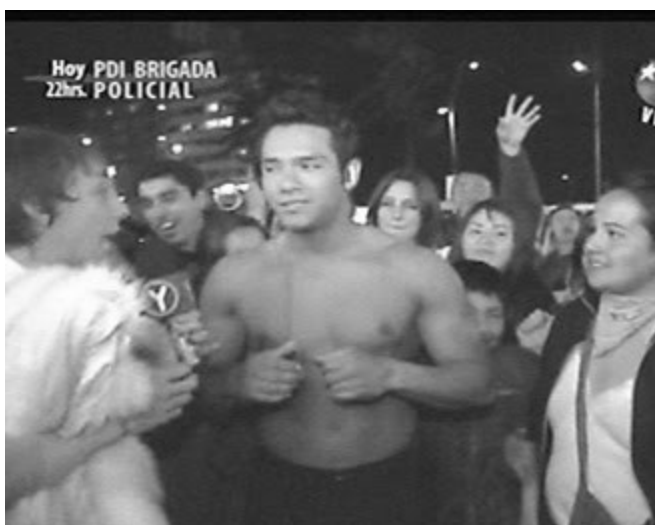
Imagen 15: Concurso en programa juvenil Yingo

mujeres son explotadas en el mercado de la televisión al reducir su cuerpo a una mera superficie sexual, vaciada de subjetividad e independencia, un objeto sin conciencia. El espectador empatiza con el signo distorsionado de la mujer y, más que ponerse en su lugar (cuestión que significaría la humillación pública), remarca las diferencias de la representación con los hombres: “A los hombres nunca se les muestran los genitales, pero a la mujer la muestran sin ningún problema, sin ningún tapujo, y a los hombres siempre los tapan, o les muestran acá, el puro poto” (FG 6, mujeres).