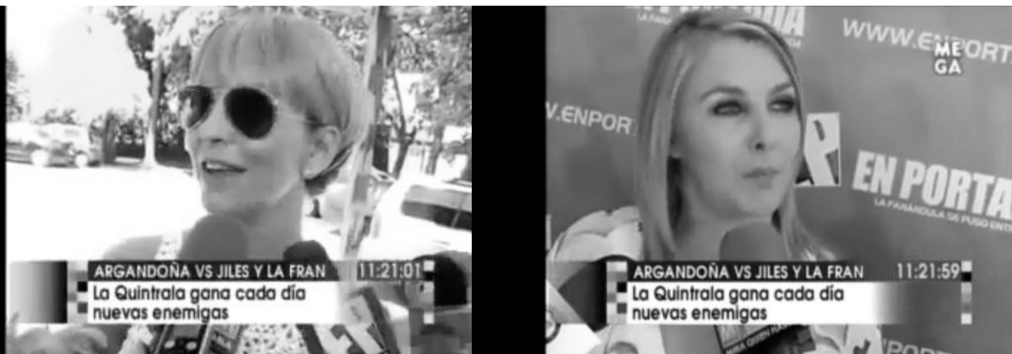
Imagen 21: Programa de farándula Mira quien habla entrevistando a dos animadoras de la televisión chilena (2010)

Más que recalcar y asumir una “identidad” o caracterización del público, es relevante reconocer las estrategias de enunciación del público, porque esta investigación no mide la calidad de la televisión, sino las cualidades de la subjetividad que habla de la televisión. Y es así como resalta en el público un deseo por diferenciarse que no es lo mismo que reconocerse como diferencia, ya que construyen un público que no buscaría convivir con otras diferencia(s), sino que busca eliminar una existencia mediática “otra”.