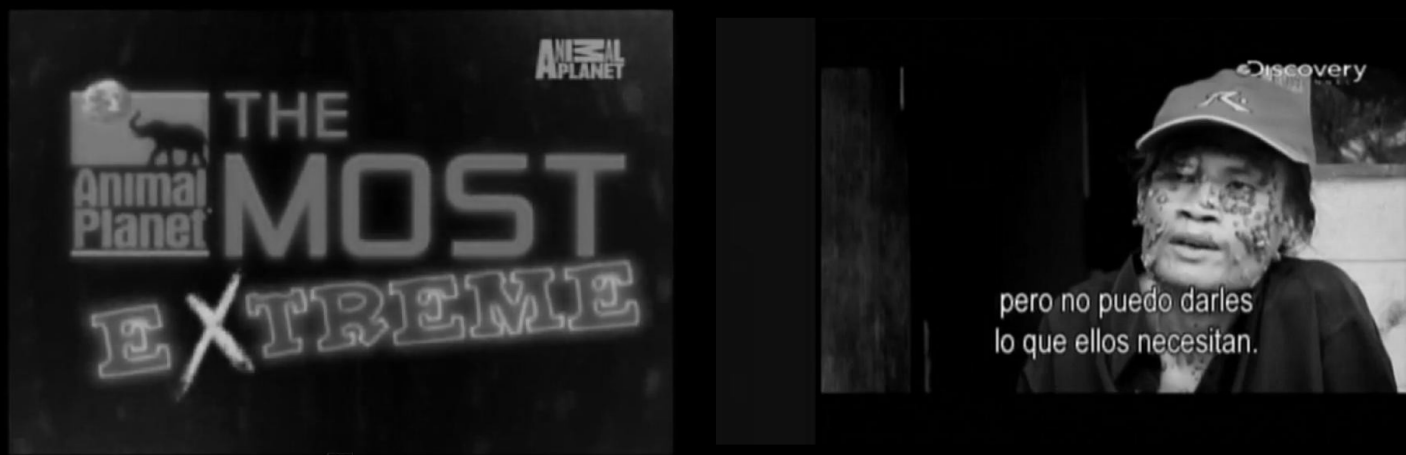
Imagen 8: Imagen de programa de canal Animal Planet y el “hombre árbol” en reportaje de Discovery Channel . lo salvaje y lo bárbaro” (Nouzeilles, 2002:19). Más allá de la creación una otredad exótica en la representación de la pantalla, es relevante destacar la jerarquización subjetiva de la masculinidad mediatizada, su fuerza para generar separaciones sistemáticas entre rasgos

superficiales de territorios geográficos y/o corporales.