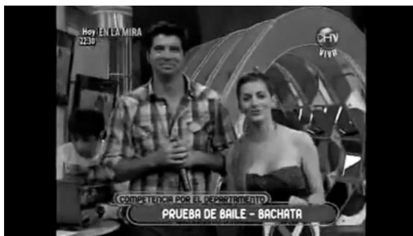
Imagen 30: Animadores del programa juvenil Yingo (2010)

La sobre-exposición de lo privado, que es lo no-serio para el razonamiento mediatizado de los espectadores, la no restricción de la mirada ante los cuerpos desnudos es una lectura que sexualiza los dispositivos narrativos de la televisión ante significados demasiado abiertos.