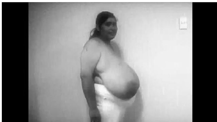
Imagen 26: Escena de la temporada 2007 del programa Vida: Radiografía de un cambio

Sin embargo, lo privado se entiende no como una comprensión social caracterizada por lo cotidiano o lo doméstico, sino como un significante general que reconocemos como lo-no-serio , una proyección incierta de la intimidad para el público, no es tan sólo lo cotidiano o doméstico simplemente, sino que es la espectacularización de aquello que no debería hacerse