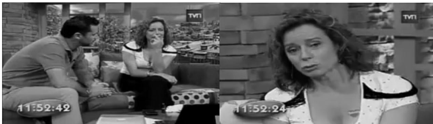
Imagen 28: Animadores del programa matinal Buenos Días a Todos (2010)

Por otra parte la descripción de algunos animadores de televisión masculinos también refleja como el lenguaje de lo serio se articula con este sexo y es ahí donde se destacan rasgos de una ética-política que funda la representación del género masculino uniformado en una estética de moral correcta bajo el discurso de lo serio . A propósito del animador Mario Kreutzberger o Don Francisco un entrevistado señala: