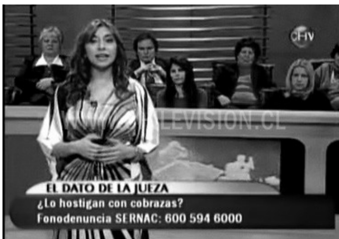
Imagen 17: (de izquierda a derecha) Abogada-conductora del programa de la tarde Veredicto y conductora de programa La Jueza de Chilevisión.

El silenciamiento de una sexualidad obscena (fuera del marco televisivo) es la estrategia de reproducción de una norma heterosexual en el público que aspira a restringir sexualidades inciertas , porque no existiría un suceso más denostado en la televisión como es la aparición de cuerpos (deseos) inciertos, es decir que no posean un futuro o trayectoria definida en la narrativa televisiva, que no se sabe cómo sobrevivirán esos cuerpos en la pantalla porque justamente no poseen la administración de una norma heterosexual que convierta los cuerpos mediatizados en representaciones de mujeres recatadas y dedicadas a la maternidad 16 .