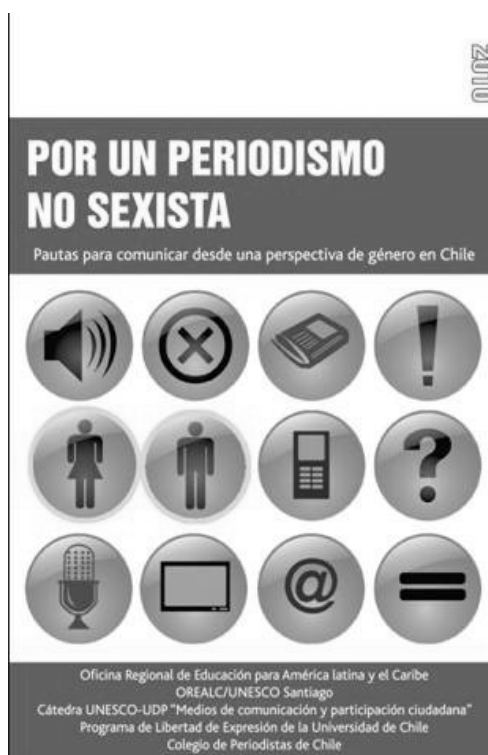
Imagen 2 Portada del libro "Por un periodismo sin sexismo"

Expresión de la Universidad de Chile, el Colegio de Periodistas y la Cátedra UNESCO de la Universidad Diego Portales es un ejemplar sintomático del “feminismo restrictivo” relacionado con la comunicación. En sus páginas se asume cuantitativamente que sólo el “24% de las personas que aparecen en las noticias, dan su opinión o sobre las cuales se lee en las noticias son mujeres ”, que “en el uso de las fuentes, las mujeres siguen siendo consultadas en las categorías de personas “ordinarias”; por el contrario “los hombres predominan como expertos” y se afirma que “el sexismo está presente en los medios de comunicación tal como lo está en las sociedades en que se desarrollan dichos medios” (OREALC/UNESCO, 2010:8-9), asumiéndose así, rápidamente, que existe una república masculina dominante en lo social que se permea unidireccionalmente y sin fisuras en la pantalla mediática.