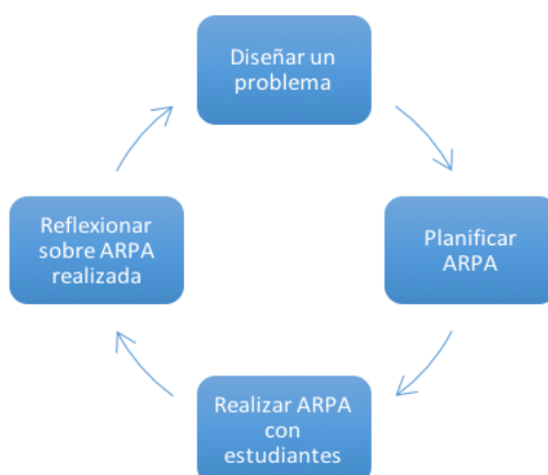
Figura 3. Esquema de las sesiones 5, 6 y 7 del Taller RPAula

Los videos obtenidos en las tres ARPAs filmadas se editan, seleccionando para cada uno de los docentes participantes, un episodio de uno a tres minutos, donde se pueda observar buenas prácticas como por ejemplo, estudiantes trabajando y discutiendo, el docente realizando una buena pregunta, etc. Estos episodios son presentados en las sesiones posteriores para la observación colectiva y para la discusión entre pares sobre buenas prácticas. En oportunidades se centra la observación en el docente y en otras en los estudiantes.