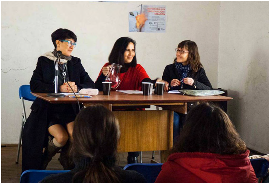
Parte del equipo de Vidas cotidianas en emergencia: territorio, habitantes y prácticas.

De esta manera, la investigación y la creación desde la interdisciplinaridad ha propiciado a la construcción de una comunidad, en donde las experiencias intelectuales y laborales se amplían y duplican con el avance de los proyectos.