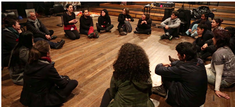
Equipo del proyecto Comisión Ortúzar en sesión de trabajo, julio 2016.

De esta forma, cada equipo de los diversos proyectos que se constituyeron bajo el alero de la Iniciativa Bicentenario, tuvo que enfrentarse entre sí, salir del espacio dentro del cual acostumbran trabajar, mirar al otro y entender el problema que tuvieron que afrontar entre todos. No es un trabajo fácil, pero arroja enormes beneficios que revisaremos a continuación, expuestos por los mismos equipos de investigación y creación.