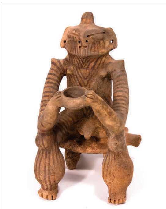
Figura 3. Estatuilla chamánica u "oferente". Arcilla, 40 cm de altura, Estado Trujillo. Tradición ¿Mirinday? Colección Kistermann, Aquisgrán. Figure 3. Shamanic statuette or "offering". Clay, 40 cm high, State of Trujillo. Mirinday tradition? Kistermann Collection, Aachen.