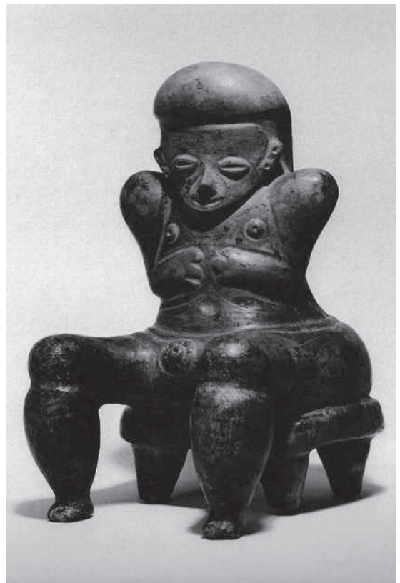
Figura 7. Hombre sobre dúho. Arcilla marrón, engobe blanco, pintura marrón oscuro. Carache, cueva de Santo Domingo, Estado Trujillo. Estilo Santa Ana (Período II, 1000 AC-300 DC). Fundación Museo de Ciencias, Caracas. Figure 7. Man sitting on a dúho. Brown clay, white slipware, dark brown paint. Carache, Santo Domingo cave, State of Trujillo. Santa Ana style (Period II, 1000 DC-300 AD). Fundación Museo de Ciencias, Caracas.

iconografía, curiosamente no fue tan popular allí, donde predominó un tipo de culto que utilizaba las estatuillas femeninas. Tampoco la observamos en la Guayana o en el Amazonas, lugares que por lo general carecieron de una imaginaria de estatuillas de cerámica como la observable en el norte.