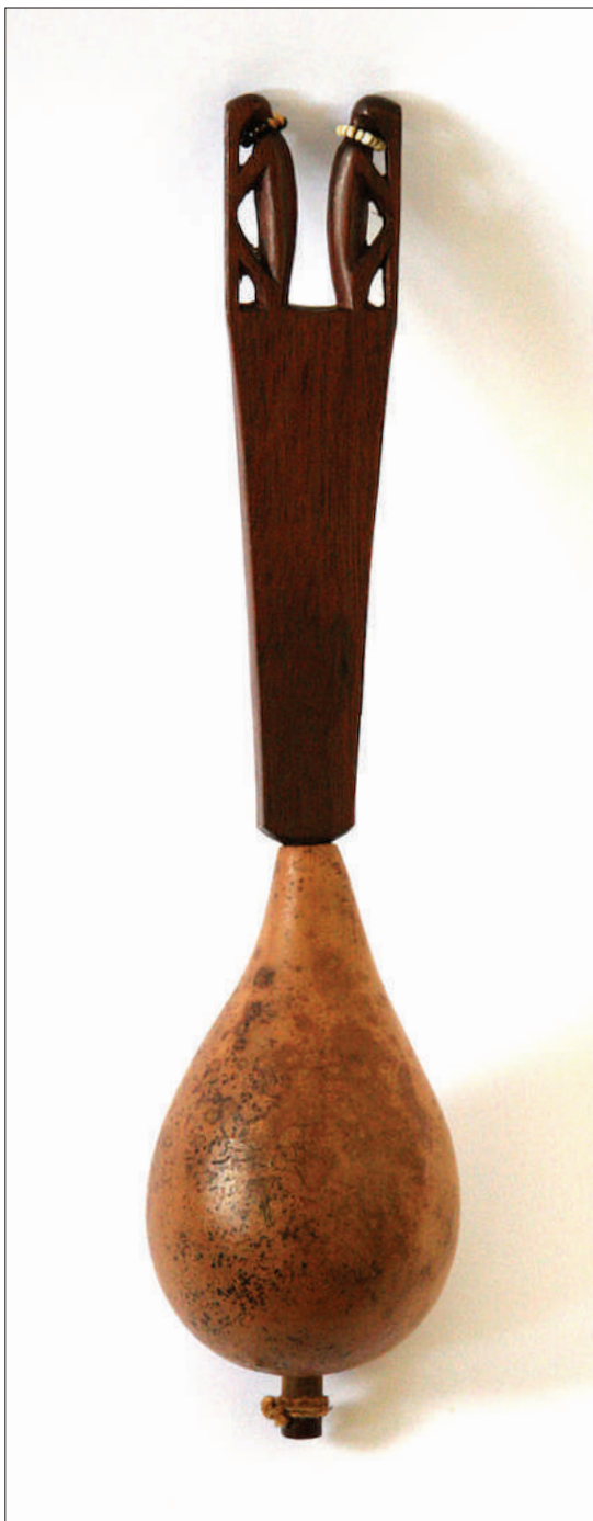
Figura 9. Maraca Ye’kuana con imagen del damodede o Pensador en el mango. Tapara, madera, piedras 30 cm de largo, Estado Amazonas. Colección Etnográfica ICAS, Fundación La Salle, Caracas. Figure 9. Ye’kuana maraca with the image of the “ damodede ” or “ thinker ” in the handle. Gourd, wood, stones 30 cm length, state of Amazonas. ICAS Ethnographic Collection, Fundación La Salle, Caracas.

La escasa información sobre el origen de aquella figura se debe a que la mención más antigua sobre estas imágenes en regiones venezolanas se halla en los escritos y diseños de Theodor Koch-Grünberg, de inicios del siglo XX. En estos identificamos una descripción de la figura doble imbricada en el mango de una maraca mágica que el explorador encontró entre los “Irahana” –“Las dos figuritas representan ‘hombres que viven por encima de nuestro cielo’” (Koch-Grünberg 1979: 292)–. 12 El Pensador es una figura crucial en los mitos ye’kuana actuales. Sin embargo, aún no ha sido posible dilucidar con exactitud por qué no comenzamos a ver este ícono antes del siglo XX entre las culturas Caribe de la Guayana venezolana: ¿fue una adquisición reciente de estos pueblos del norte o bien se trata de una práctica ancestral guayanesa o amazónica cuyos vestigios arqueológicos no lograron sobrevivir hasta el presente?