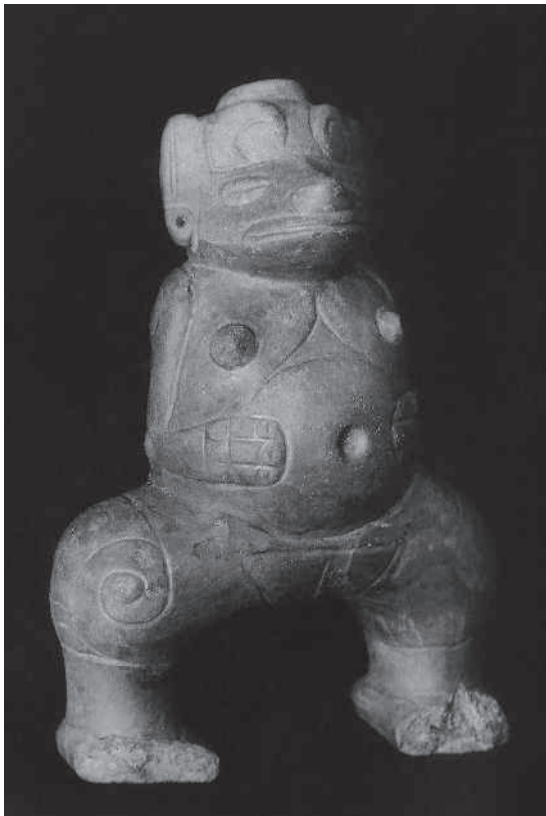
Figura 6. Estatuilla femenina con piernas en forma de arco. Arcilla marrón, engobe rojo; 25,5 x 18,3 x 11,3 cm. Barrancas (cercañas), Estado Monagas. Serie Barrancoide, Los Barrancos, 1000 AC-600 DC. Fundación Museo de Ciencias, Caracas. Figure 6. Female statuette with arch-shaped legs. Siena clay, possibly with dark brown slipware. Brown clay, red slipware; 25.5 x 18.3 x 11.3 cm. Barrancas (proximities), State of Monagas. Barrancoid series, Los Barrancos, 1000 BC-600 AD. Fundación Museo de Ciencias, Caracas.