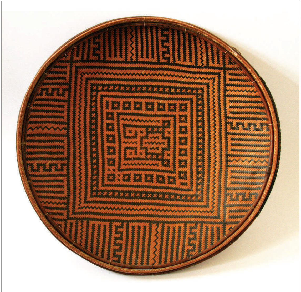
Figura 8. Cesta Ye'kuana con imagen doble del mono mítico Idaakadu, Estado Amazonas. Colección Etnográfica ICAS, Fundación La Salle, Caracas. Figure 8. Ye'kuana basket with the double image of the mythical monkey Idaakadu, State of Amazonas. ICAS Ethnographic Collection, Fundación La Salle, Caracas.

y geométricas de símbolos y entidades míticas, como es el caso de la cestería Ye'kuana, de la rama lingüística Caribe (fig. 8).