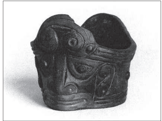
Figura 5. Vasija-efigie con tocado círculos concéntricos. Arcilla siena, posible engobe marrón oscuro. Serie Barrancoide, 1000 AC-600 DC, Barrancas (cercanías), Estado Monagas. Fundación Museo de Ciencias de Caracas. Figure 5. Effigy-vessel wearing a headdress with concentric circles. Siena clay, possibly with dark brown slipware. Barrancoide series, 1000 BC-600 AD, Barrancas (proximities), State of Monagas. Fundación Museo de Ciencias de Caracas.

El principal motivo que nos llevó a estudiar estos horizontes iconográficos es que ellos, así como las prácticas ceremoniales asociadas, parecen existir de forma independiente a los estilos de alfarería, así como a una cultura o grupo lingüístico específico. De la misma manera, no solo evidenciamos concomitancias entre las prácticas de culto de sociedades que en apariencia no tienen relación alguna, sino que encontramos estilos y prácticas culturales muy distintas en sociedades que, por lo contrario, sí parecen tener orígenes étnicos comunes. En consecuencia, los estilos y las formas de culto pertenecientes a culturas de una misma familia lingüística pueden variar considerablemente. Por ejemplo, los Wayúu que hoy habitan en la península de la Guajira (de afiliación lingüística Arawak) casi no comparten rasgos estilísticos con los Wakúenai (también Arawak) del Amazonas. En este sentido, aquellos pueblos prehistóricos asociados a ramificaciones Arawak o Caribe en el septentrión venezolano llegaron a producir de manera prolífica estatuillas de cerámica, pero los miembros de los mismos grupos lingüísticos del Amazonas (del Alto Orinoco) y la Guayana no habría desarrollado este tipo de costumbres.