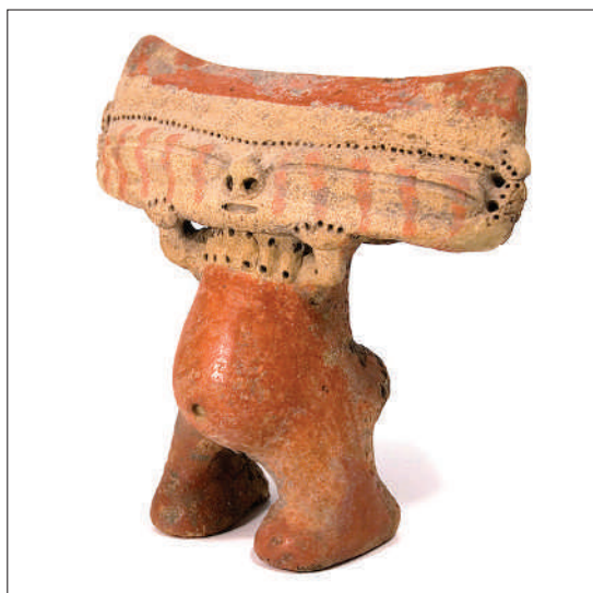
Figura 2. Estatuilla femenina. Arcilla, 17 cm de altura. ¿Estado Aragua o Carabobo? Estilo Valencioide, aprox. 1200 DC. Colección Kistermann, Aquisgrán. Figure 2. Female statuette. Clay, 17 cm high. State of Aragua or State of Carabobo? Valencioide style, approx. 1200 DC. Kistermann Collection, Aachen.

La segunda –perteneciente a las formas del sur– destaca por poseer menos representaciones figurativas en su cultura material. Asimismo, las figuraciones zoo y antropomorfas que pudiéramos hallar en estas regiones forman siempre parte del diseño; se encuentran imbricadas en un objeto que cumple alguna función, como una vasija o una flauta (figs. 4 y 5). Por tanto, en las sociedades al sur del Orinoco se optaría por una manifestación visual más abstracta y carente de objetos aislados de culto como estatuillas o efigies.