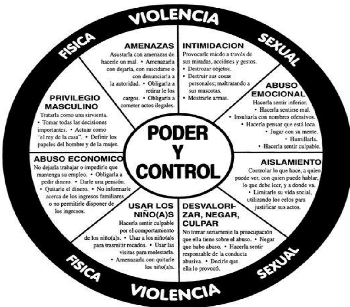
Figura n°1. Rueda de Poder y Control. Fuente: Domestic Abuse Intervention Programs.

Desde esta visión, SERNAM incluye además en su tipificación de abusos intrafamiliares clasificaciones más generales y reconocidas en donde se incluye la violencia física y la violencia psicológica, así como también la violencia sexual y la violencia económica (SERNAM, 2015).