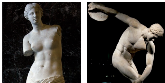
Fig. 1. A. Venus de Milo de Alexandros de Antioquía, esculpida entre el 130 y 100 AC. B. El Discóbolo, por Mirón de Eléuteras, 450 AC. En ambas figuras se representa una forma atlética, un cuerpo magro y de musculatura definida.

El objetivo del presente estudio es describir las variaciones en el número de metámeros del músculo recto del abdomen en la población chilena mediante el análisis de tomografías computarizadas de abdomen y pelvis, así como determinar si existe algún patrón que guíe al cirujano en la marcación quirúrgica.