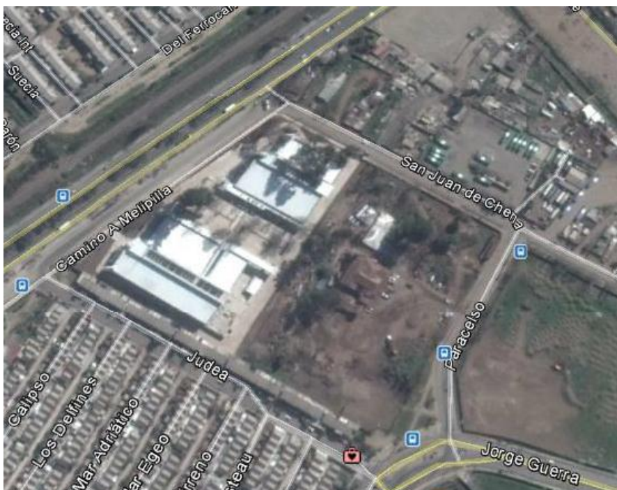
La Casona Valdés, año 2017 luego de la intervención de Grupo Villa.