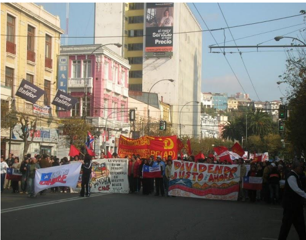
Vecinos y vecinas de la Villa San Juan, junto a otros dirigentes de ANDHA Chile, en marcha 21 de Mayo 2008, Valparaíso.