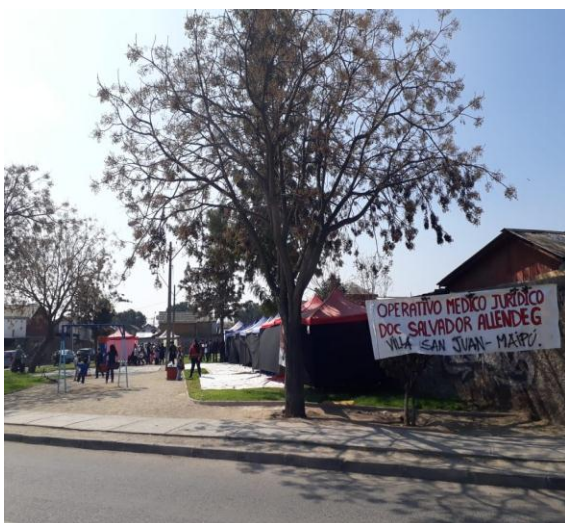
10° Operativo Medico realizado en la Villa San Juan. Intersección de calles Abisinia/Líbano. 1 de septiembre de 2018.

Como se ha mencionado, la lucha de Justicia y Esperanza, es una lucha por la vida digna en todos sus niveles, se han revisado dos experiencias. En primera instancia , se revisó la lucha concreta por la vivienda de los deudores habitacionales, la cual se configura como la primera experiencia organizativa de Justicia y Esperanza. En segundo lugar , la