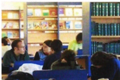
La U. de Chile cuenta con 49 bibliotecas, las cuales contienen un total de 2.796.499 volúmenes impresos.

El "Integrador de Bases de Datos Especializadas" constituye la nueva herramienta que permite a investigadores, académicos y estudiantes la consulta simultánea a más de 35 bases de datos, a través de una sola interfaz. Este servicio facilita el acceso a prestigiosas publicaciones de todas las áreas de la universidad.