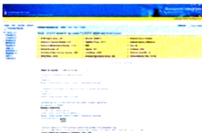
El sistema de "Búsqueda Integrada" apuesta a la flexibilidad del método de consulta y su rapidez en la búsqueda.

Con la activa participación de las bibliotecas de la Universidad de Chile, el SISIB espera optimizar el proceso de adquisición de recursos de información a través de iniciativas consorciadas con otras universidades; fortalecer el acceso a las publicaciones electrónicas; abordar integralmente la conservación del patrimonio bibliográfico y la producción intelectual de la universidad; y complementar el proceso de aprendizaje de los alumnos, fortaleciendo sus competencias en la búsqueda, selección, organización y uso de la información, de manera de incorporarlos más activamente en el nuevo modelo de adquisición y generación de conocimientos.