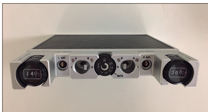
Figura 2. Emisor de radiofrecuencia.