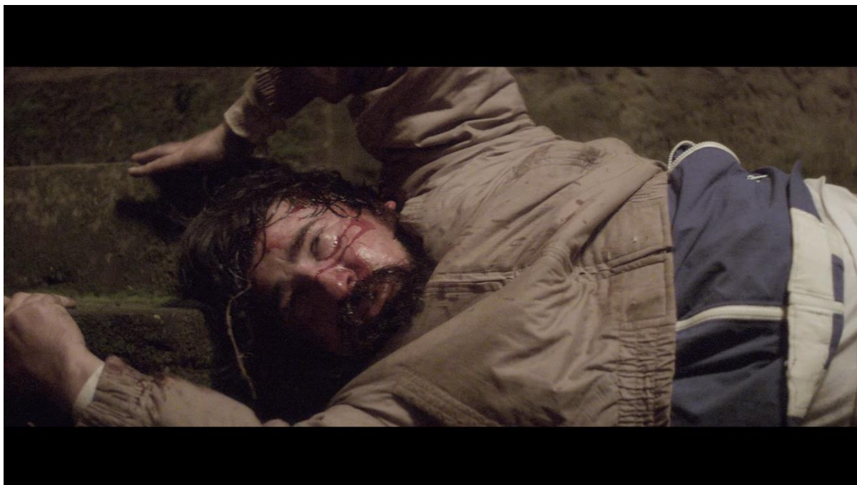
Fotograma 7 “El Club”