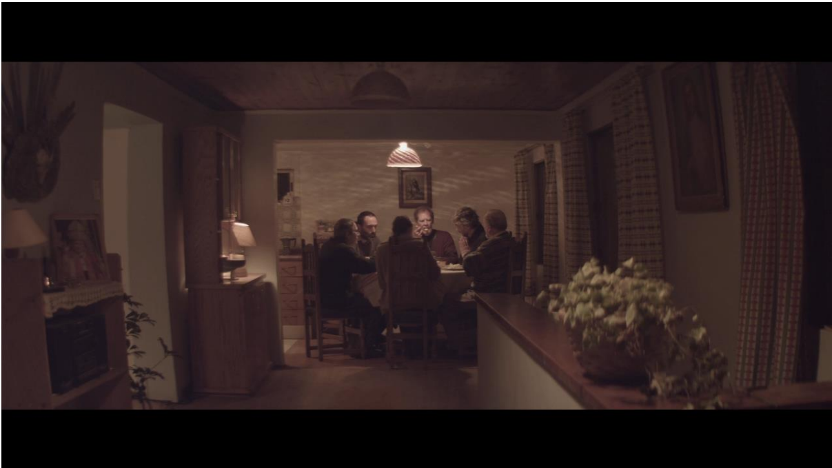
Fotograma 6 “El Club”