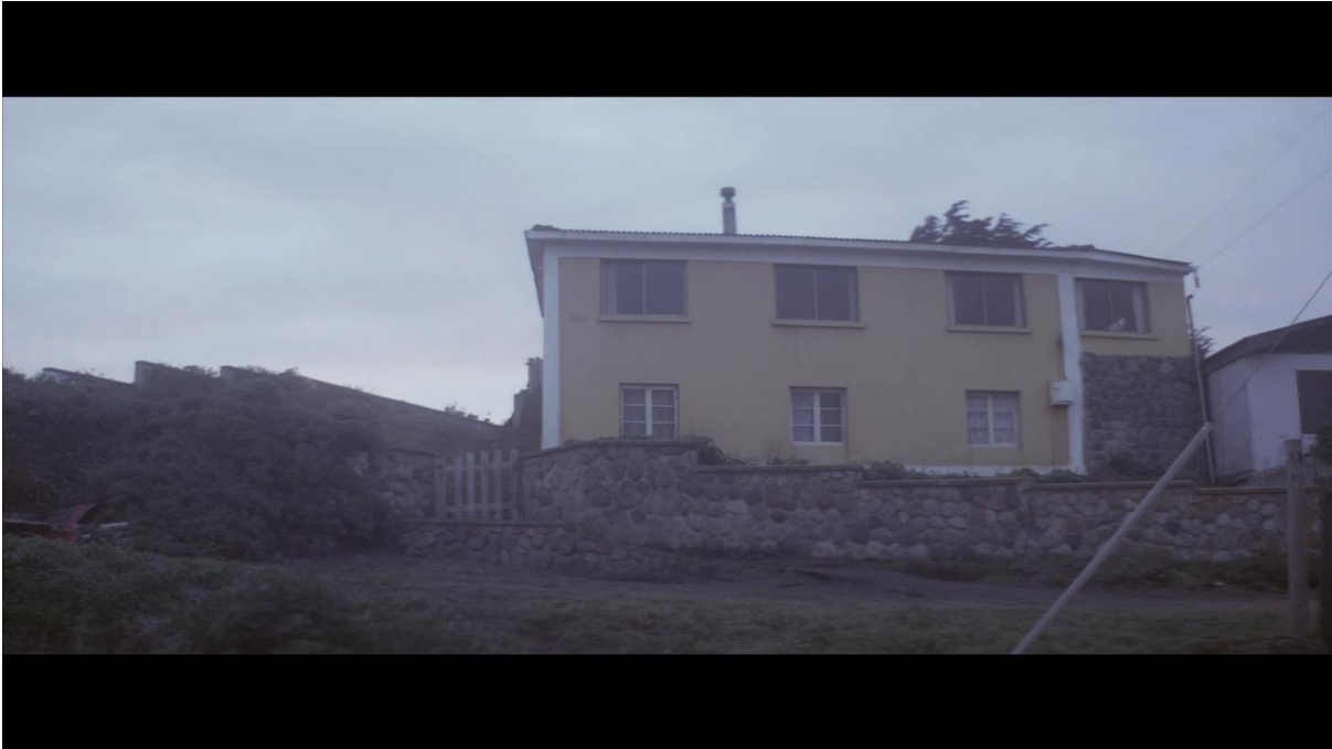
Fotograma 5 “El Club”