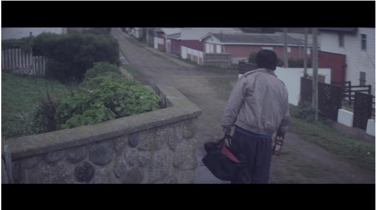
Imagen 3. Fotograma “El Club”.