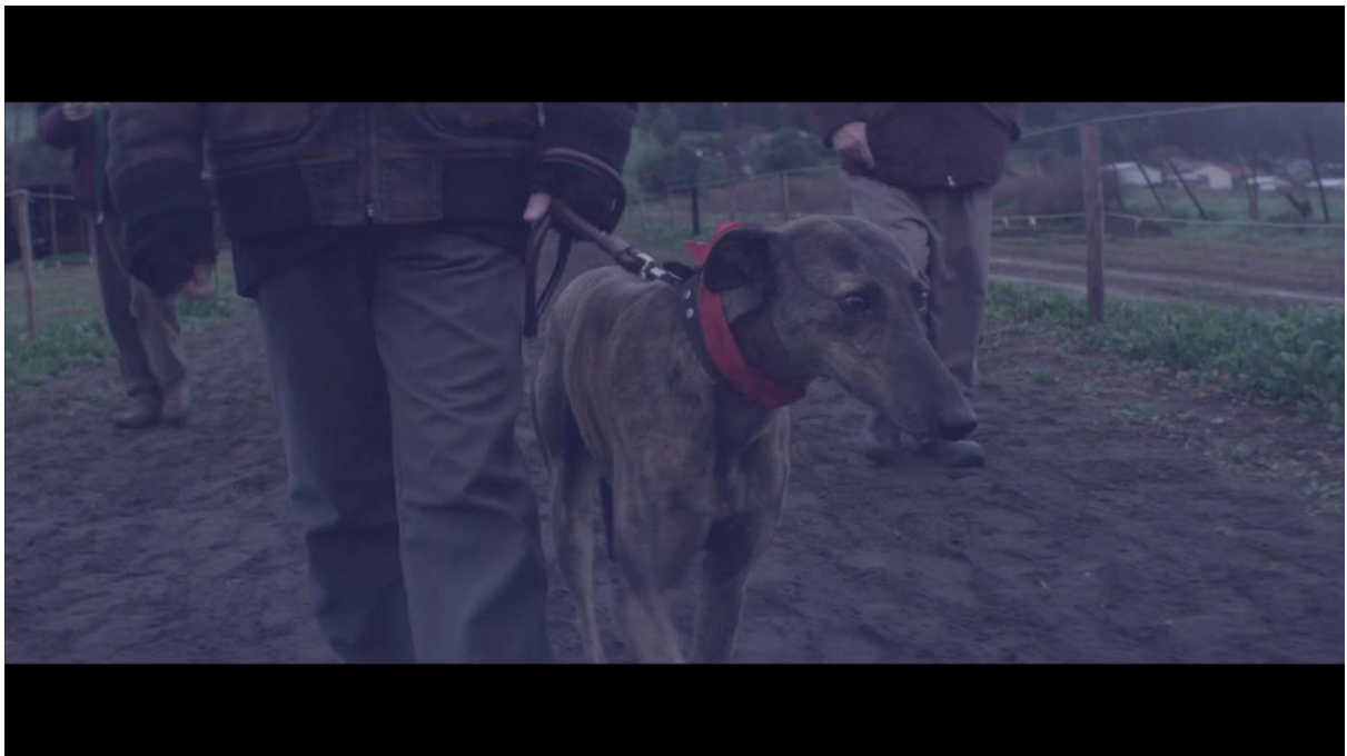
Imagen 4. Fotograma “El Club”.