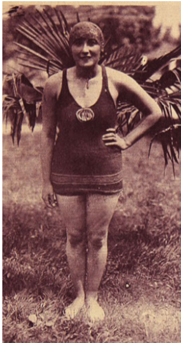
Fotografía N.º 2: Posando una joven nadadora chilena. “El primer día de los nadadores”, Los Sports , Santiago, 2 de diciembre de 1927, pp. 3.