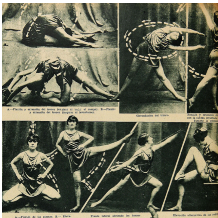
Fotografía N.º 10: Entrega de una rutina de ejercicios especiales para las mujeres, recomendados a realizarlos por las mañanas o antes de comer. Se deben ejecutar entre 10 a 20 veces con soltura. “Señoras”, Los Sports , Santiago, 17 de junio de 1927, p. 16.