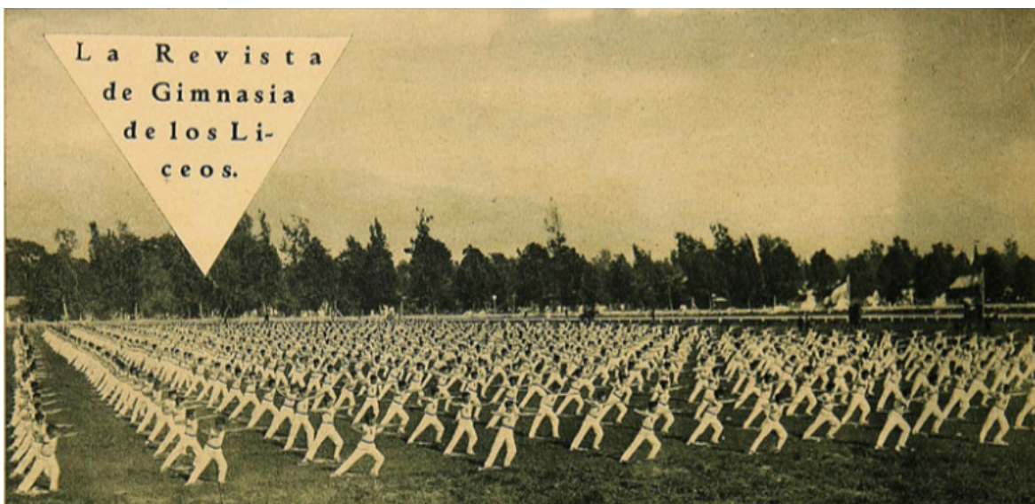
Fotografía N.º 8. Revista de gimnasia que reunió tres mil estudiantes de Establecimientos de Educación Secundaria realizada en el Club Hípico. “La revista de gimnasia de los liceos”, Los Sports , Santiago, 21 de noviembre de 1930, pp. 2.