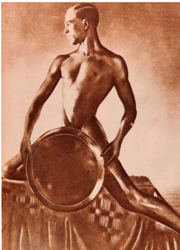
Fotografía N.º 11. “El Gladiador”, Los Sports , Santiago, 23 de agosto de 1929, p. 40.