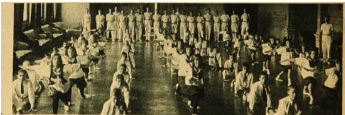
Fotografía N.º 6: Presentación de un grupo de alumnos. “Revista de gimnasia del Colegio y Club Gimnástico alemán de Valparaíso”, Los Sports , Santiago, 29 de junio de 1923, pp. 16.