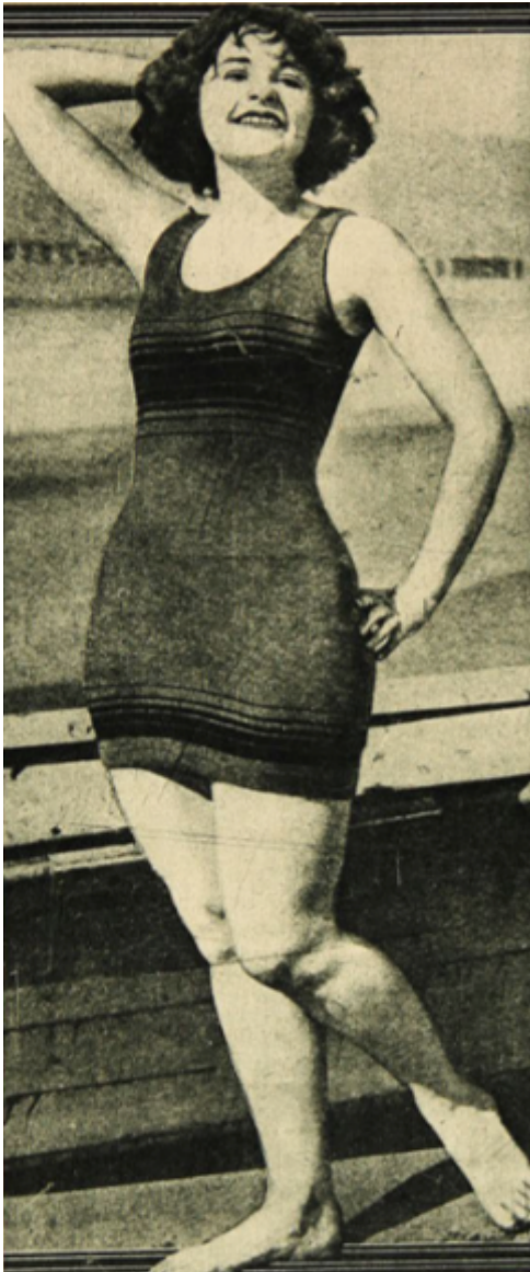
Fotografía N.º 1: Posando una nadadora americana. “La mujer chilena debe cultivar los deportes”, Los Sports , Santiago, 7 de septiembre de 1923, pp. 5.