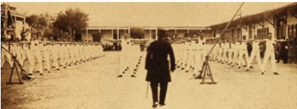
Fotografía N.º 5: Presentación de ejercicios realizados por un grupo de suboficiales. “Una revista de gimnasia en la Escuela de Suboficiales”, Los Sports , Santiago, 27 de abril de 1923, p. 5.