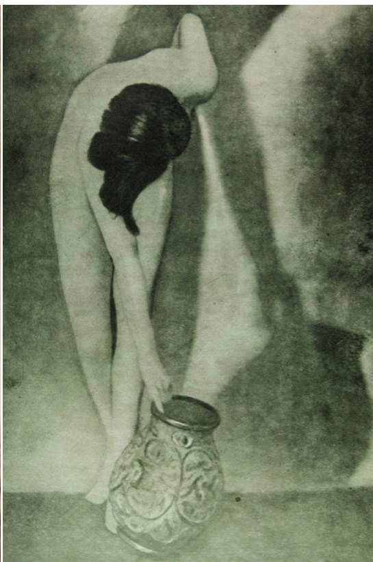
Fotografía N.º 12. “Fotografía artística obtenida mediante la práctica de la cultura física”, Los Sports , Santiago, 17 de enero de 1930, p. 40.