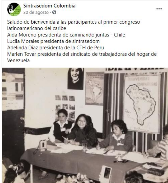
Sintrasedom Colombia. Publicación en Blog Personal de Facebook. Disponible en https://www.facebook.com/SNTDC/posts/120534966436148 . [Consultado en 15/12/2020].