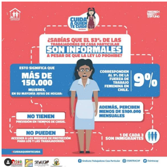
Infografía de SINTRACAP. Campaña Cuida a quien te cuida. Chile. (2020). Disponible en https://www.instagram.com/p/CC84YIgpPHM/ . [Consultado en 03/09/2020].