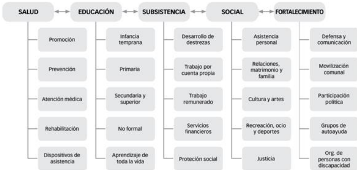
Figura A1. Matriz de la Rehabilitación Basada en la Comunidad, señala los cinco componentes de la estrategia y los elementos que se desprenden de cada uno (OMS, 2012a).