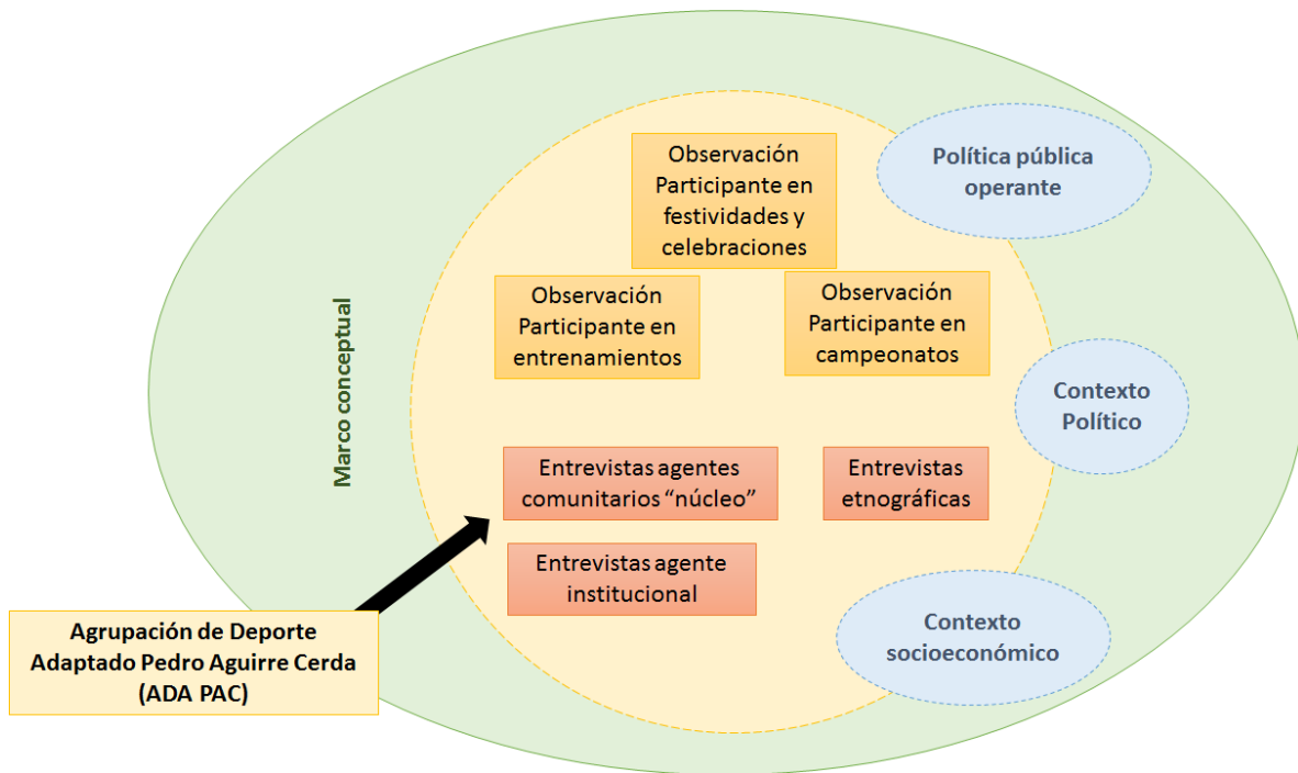
Figura 3. Esquema estudio de caso ADA PAC.

Específicamente, las prácticas de vinculación en este colectivo estarían dadas por la interpretación subjetiva de las realidades comunes que comparten, tanto por parte de los actores sociales como por la investigadora en el proceso, influidas además por las estrategias metodológicas que empleadas en el campo que finalizan en la co-construcción del objeto (caso) de estudio (Barriga y Henríquez, 2003).