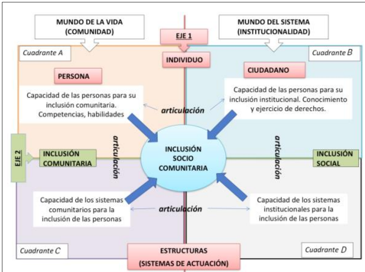
Figura 1. Modelo de Inclusión Socio Comunitaria (MISC).

En este modelo la persona es concebida en su ontológica dimensión comunitaria. La inclusión comunitaria, es la participación de las personas en los sistemas de actuación del mundo de la vida; en comunidades de compenetración personal (familias, redes familiares, redes focales, redes primarias, redes operantes, grupos primarios). Mientras que la inclusión social está referida al mundo institucional, al mundo del sistema, es la conexión operativa de las personas con la oferta institucional existente (Martínez, 2018b). Los programas locales de enfoque comunitario, como la RBC o la misma EDLI, que buscan la inclusión social de las personas con discapacidad, pueden ser analizados bajo este modelo, pues en sus objetivos buscan mejorar las capacidades inclusivas de las personas y de los sistemas de actuación, respondiendo también al modelo social de la discapacidad, discutido anteriormente. Y de acuerdo con sus propias definiciones, parece ser que el plano comunitario se invisibiliza como lugar de inclusión, ya que únicamente