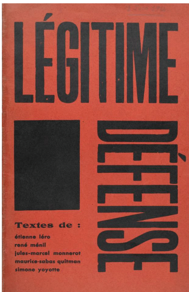
Imagen 5: Légitime Défense.

Un caso más radical en ese sentido es la apuesta vanguardista de Légitime Défense expresada en su composición ortogonal, y una composición tipográfica montada a colores planos de negro sobre rojo, que recoge los planteamientos de la nueva tipografía y de la Bauhaus (Bascuñán), y guarda una afinidad con los planteamientos del arte geométrico y constructivo (ver imagen 5).