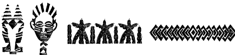
Imagen 4: Detalles de diseño La Revue du Monde Noire , archivo personal.

Ahora, más allá de sus orientaciones ideológicas, ¿cuál fue el horizonte transculturador de este impreso? ¿Cómo vehiculiza esos propósitos? En términos de su materialidad, La Femme dans la Cité no fue una revista de vanguardia al modo de La Revue du Monde Noir u otros impresos parisinos del primer cosmopolitismo negro. La Revue du Monde Noir presentaba una apuesta sumamente moderna –a la usanza de ciertas derivas cubistas y art déco – para responder a sus propias necesidades: todos sus artículos diagramados a dos columnas para resaltar el diálogo bilingüe, las ilustraciones figurativas de su interior expresan una abstracción de las formas y los detalles geométricos de impresión referían a símbolos comunes de un imaginario afrodescendiente (ver imagen 4).