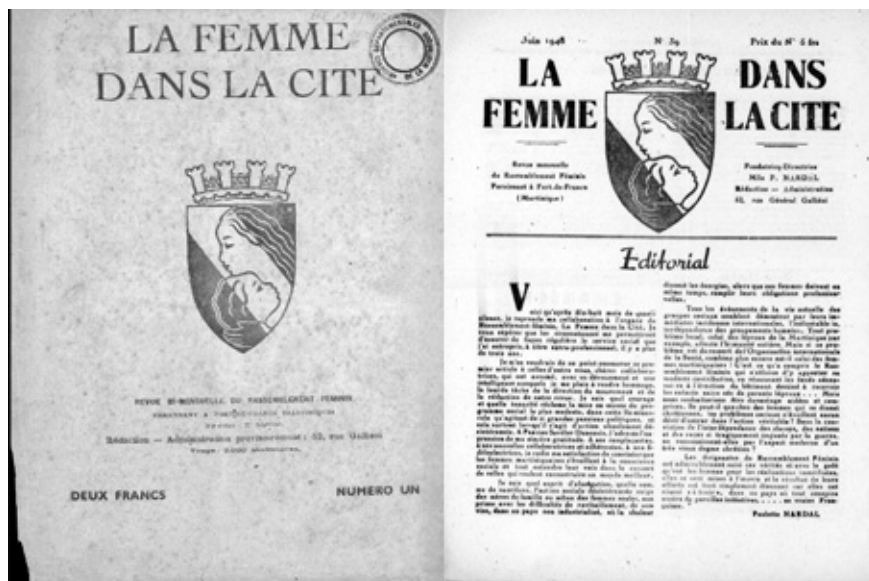
Imagen 1: La Femme dans la Cité , 1945, Archivo digital Biblioteca Nacional de Francia.