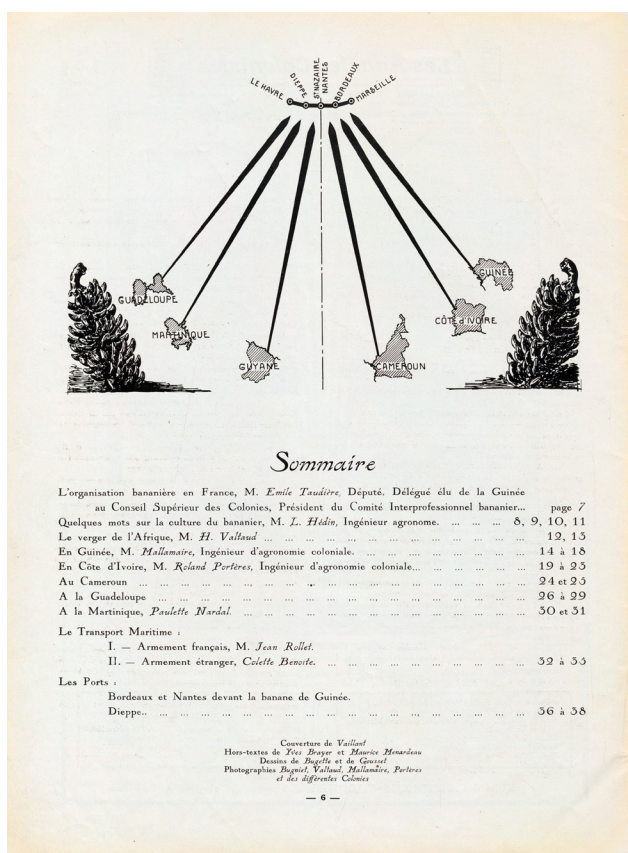
Imagen 2: Les Annales Coloniales , 1935, archivo digital Biblioteca Nacional de Francia.

colaboración como periodista y editora en publicaciones del Ministerio de las Colonias en paralelo a su colaboración en La Dépêche Africaine , Le Cri des Nègres , Le Soir y su codirección de La Revue du Monde Noire , así lo demuestran. Por ejemplo, en sus artículos en Les Annales Coloniales (ver imagen 2) describe diferentes aspectos costumbristas de las Antillas, torciendo el imperativo del exotismo con descripciones enfocadas a resaltar la complejidad y riqueza cultural de sus sociedades.