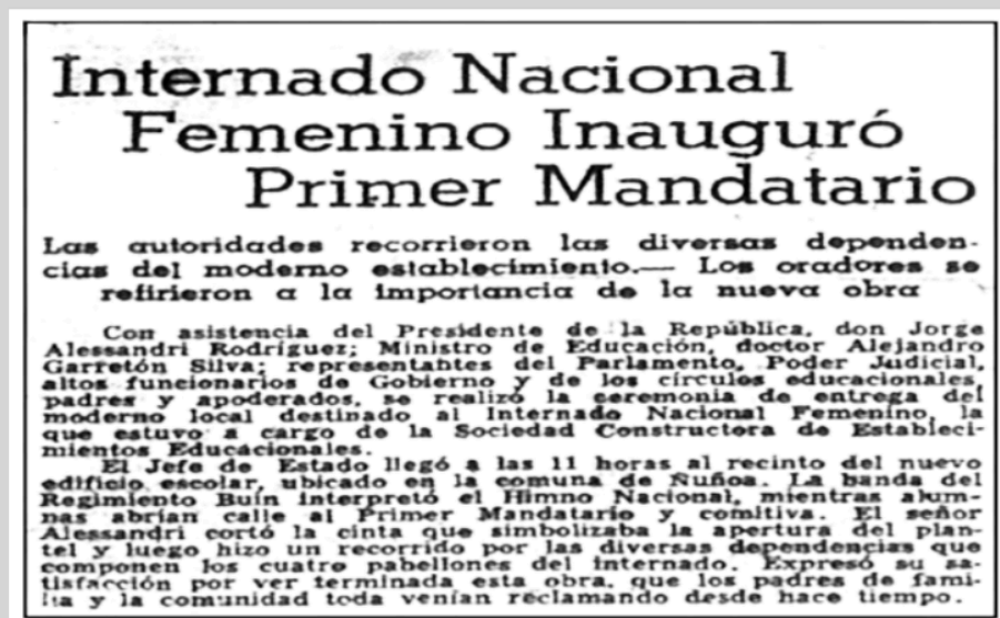
Figura 1: Fragmento El Mercurio, 13 de agosto de 1964, p. 1 y 20.