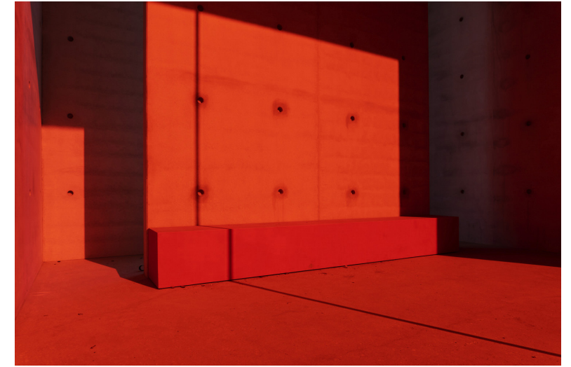
figura 3 Alfredo Jaar, Padiglione Rosso, 2022, cortesía ArtLine Milano, foto Alberto Fanelli

Milán es una de esas ciudades que ha impulsado grandes proyectos urbanos para atraer inversores, apoyándose en mega eventos internacionales, como fue la Expo Milán 2015. También ha recurrido a la creación de imágenes icónicas para iniciar estos procesos de regeneración urbana. Es así como nos encontramos sin sorpresa con la mezcla de arquitectos famosos y edificios emblemáticos, sin mucha contemplación con las comunidades vecinas ni con aspectos identitarios de la cultura arquitectónica local. Los nuevos actores son promotores internacionales, proveedores de servicios financieros, arquitectos de moda y empresas privadas. El resultado es la homogeneización de estos nuevos paisajes, que