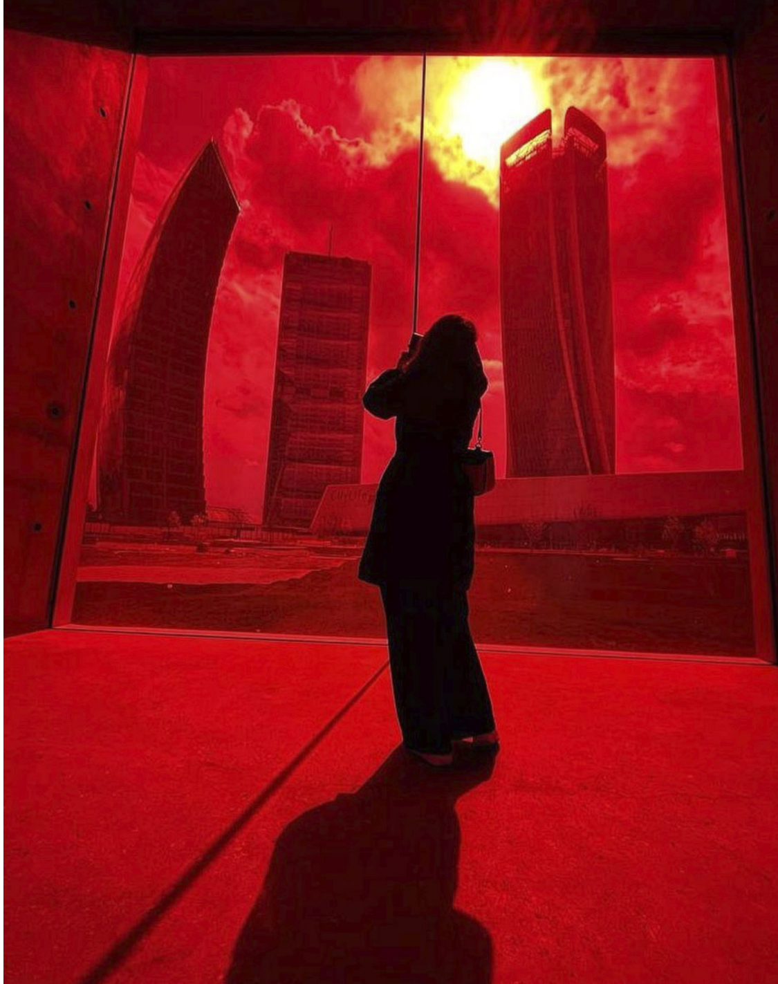
figura 4 Alfredo Jaar, Padiglione Rosso, 2022, cortesía ArtLine Milano, foto Alberto Fanelli (pags 190-192)