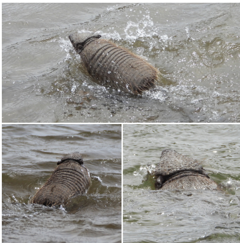
Fig. 1. Secuencia de nado de Chaetophractus villosus en estero Blanco Chico, Balmaceda, región de Aysén.

por lo que pueden observarse dos o tres huellas de uñas centrales (Fig. 2b), siendo la marca de la uña del dedo medio, la más evidente (grande y profunda). Para las mediciones, se utilizó pie de metro, con precisión de 0,1 mm. Las dimensiones de la mano (considerando solo las huellas de las uñas, sin los cojinetes plantares) son de 1,0 cm de largo y 2,3 cm de ancho. En las extremidades posteriores (con cinco dedos), también los extremos están reducidos, por lo que se ven tres a cuatro uñas, con las dos centrales más juntas entre sí (situadas a la misma altura). La uña del dedo exterior se ubica levemente más atrás, y la uña del dedo interior es más pequeña y está ubicada aún más atrás (Fig. 2c). El largo de la pata (solo uñas) es de 2,4 cm y su ancho es de 2,6 cm. La distancia entre las huellas de manos y patas (largo del patrón) es de 25 cm. Antes de percatarse de nuestra presencia, el ejemplar defecó en el sustrato. La feca era de color negro brillante, de 2,4 cm de ancho máximo y 6 cm de largo, de textura irregular (formada por lóbulos), con un borde convexo y el otro extremo aguzado (Fig. 3a).