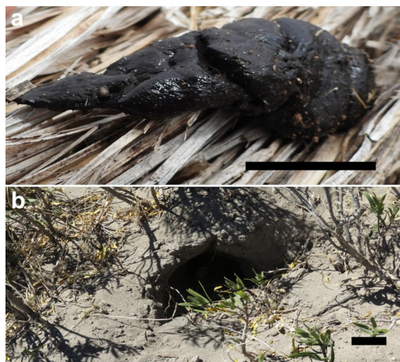
Fig. 3. (a) Feca; (b) madriguera de Chaetophractus villosus (Barras=2 cm).

más grandes, no semicirculares y generalmente con fecas redondas en la entrada (Muñoz-Pedrerros, 2008). Otro mamífero presente en el área y que construye madrigueras es el tuco tuco de Coyhaique ( Ctenomys coyhaiquensis ), roedor fosorial, de pequeño tamaño, cuyas madrigueras son generalmente circulares (como las de todos los Ctenomys ), y de un tamaño significativamente