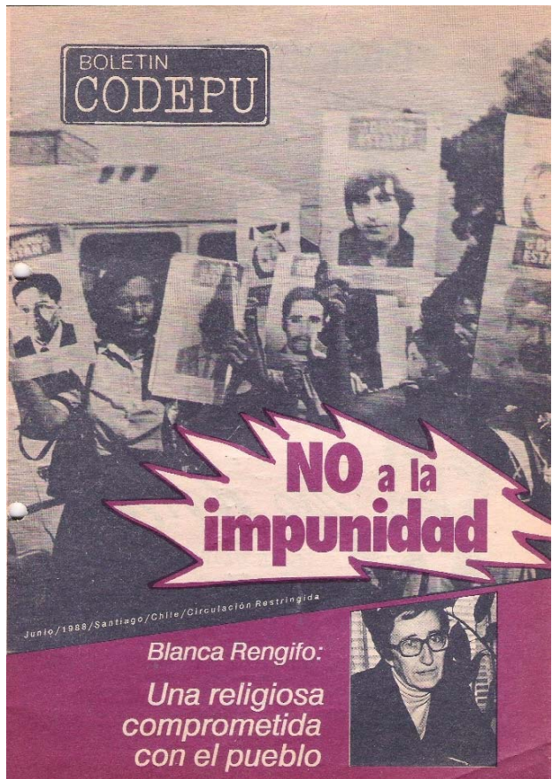
Boletín CODEPU, junio de 1988.