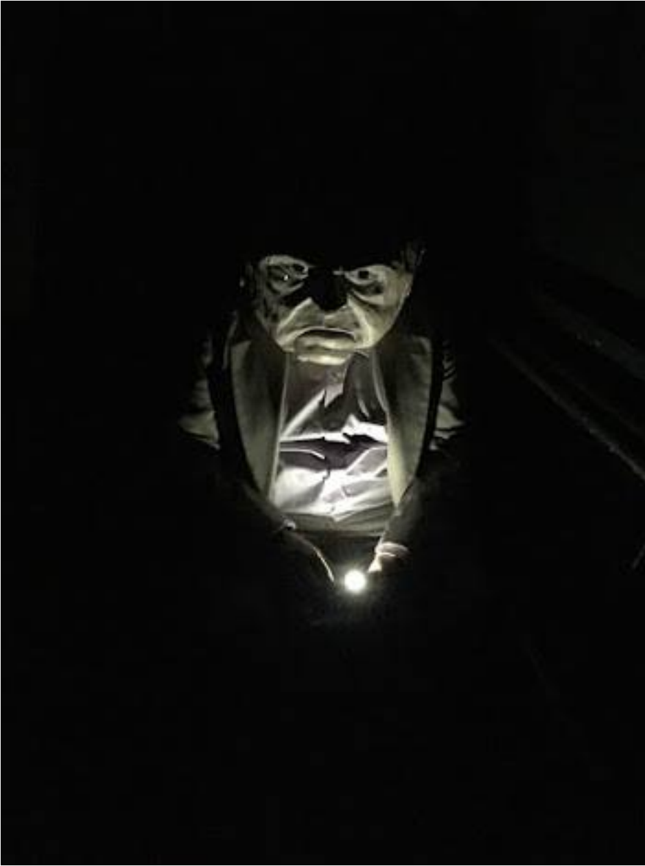
Imagen 3: Figura de Don Francisco