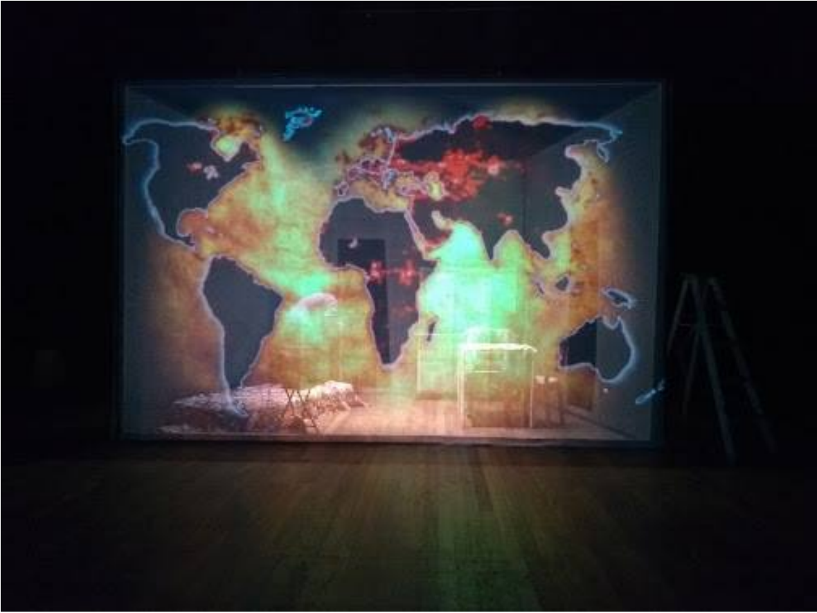
Imagen 5 : Proyección mapping.