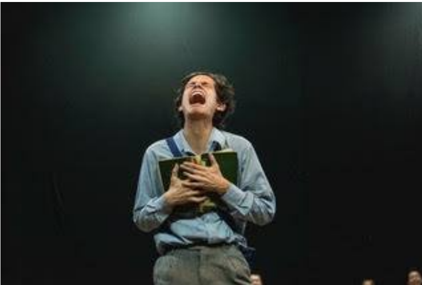
Imagen 2: El niño, actor principal.