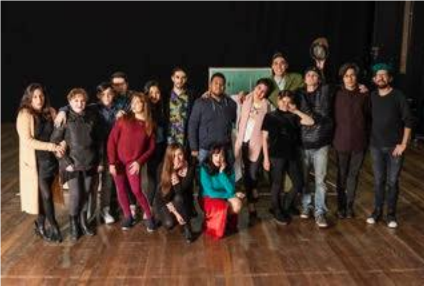
Imagen 8: Equipo completo de trabajo-