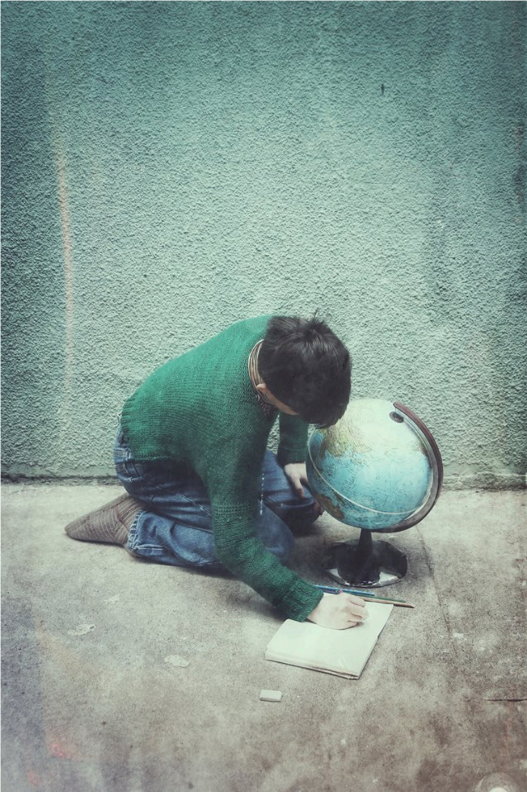
Imagen 6: Fotografía de afiche