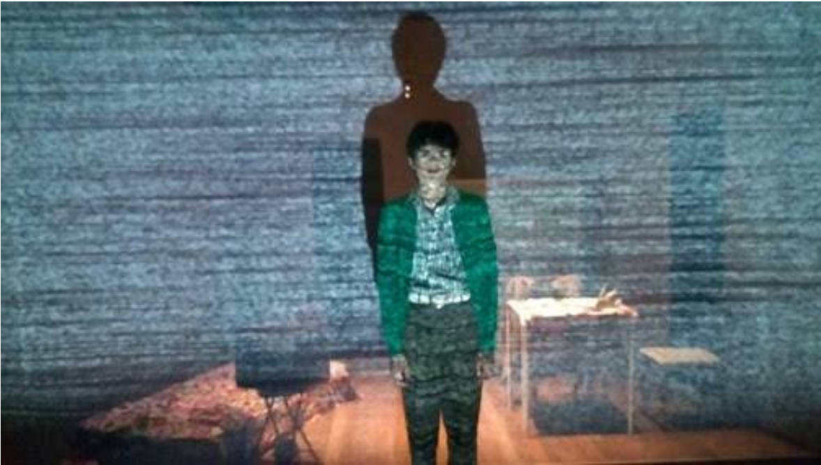
Imagen 1: La madre, rompiendo la cuarta pared