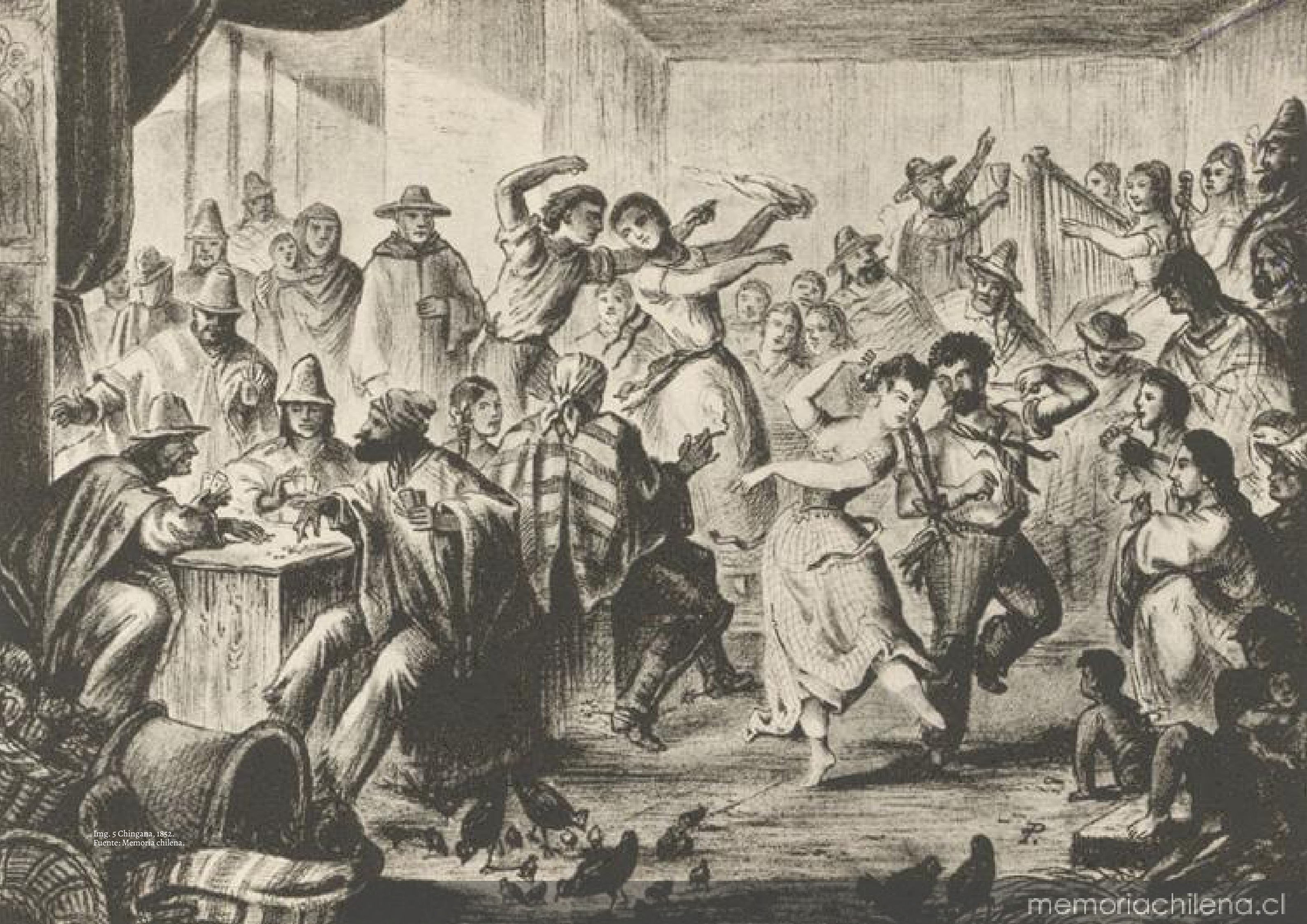
Img. 5 Chingana, 1852.