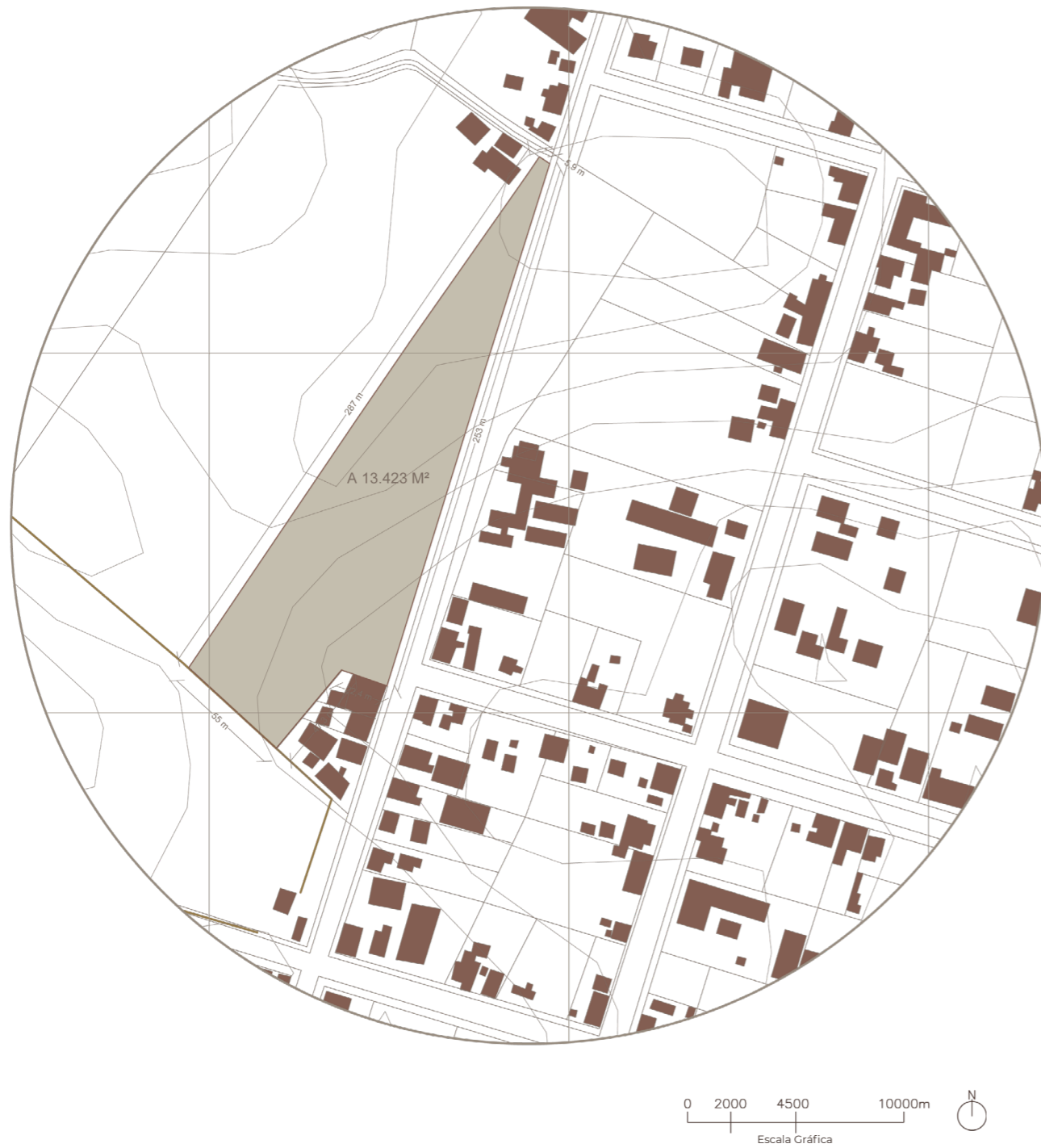
Fig. 5 Plano Emplazamiento.