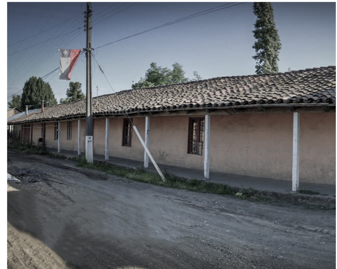
Img. 8 Casa de infancia de Víctor Jara, Posada Quiriquina.