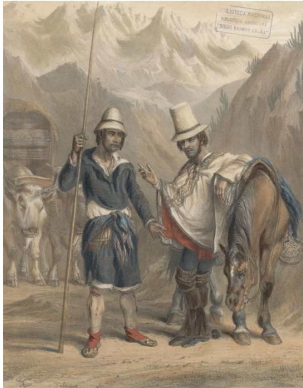
Img. 4 Carretero y capataz, 1854.

obras y trabajos son destacados, dado que crearon un repertorio de “recopilaciones y composiciones que, en conjunto, dan muestra de la diversidad de las expresiones musicales de Chile” (Contreras Román, 2016, pág. 199). Además, lograron “convencer a los cultores de la importancia de su trabajo, el interés por ‘devolver la cultura al pueblo’ y la pasión entregada en su labor” (Donoso Fritz, 2006, pág. 164)