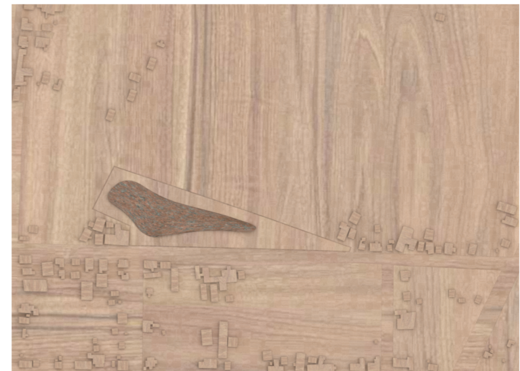
Fig. 8 Vista en planta de Maqueta de Partido General. Fuente: Elaboración propia.