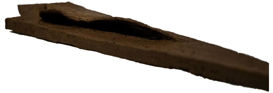
Fig. 11 Vista desde la zona urbana, maqueta de greda.