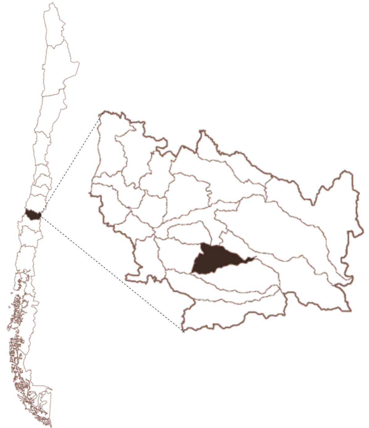
Fig. 1 Mapa de Chile y Ñuble.

Tonada campesina interpretada y recopilada por Víctor Jara en El Carmen, Región de Ñuble, 1960.