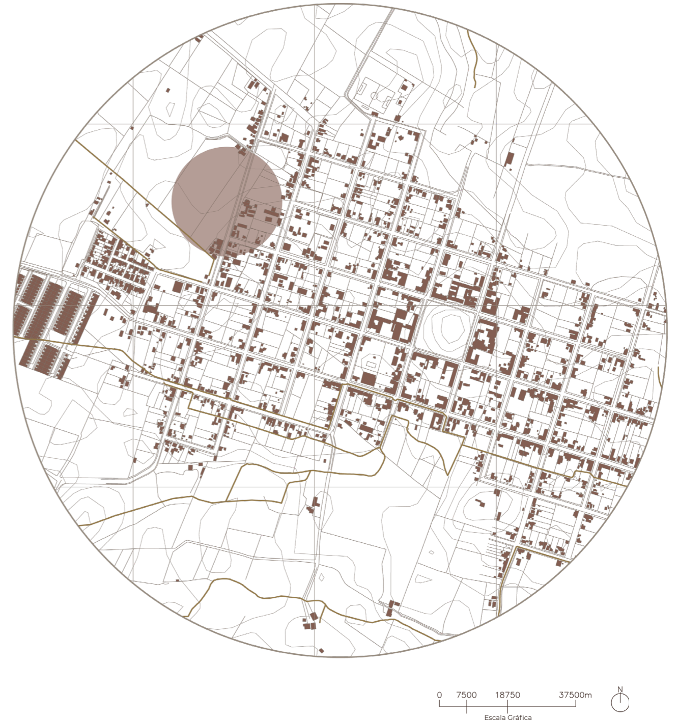
Fig. 4 Plano Ubicación.

Este predio de dominio fiscal, desde el punto de vista normativo se encuentra dentro de la "Zona de Crecimiento Urbano" según el Plan Regulador Comunal vigente.