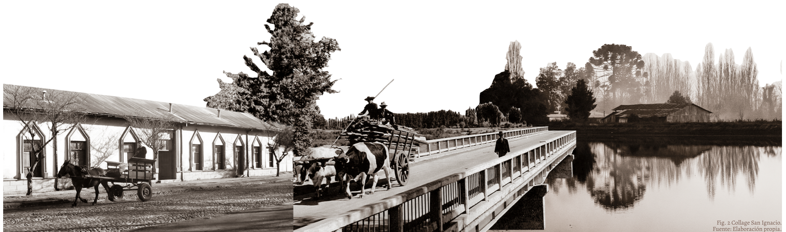
Fig. 2 Collage San Ignacio.

Todas estas características generan un ambiente propicio para el desarrollo de la agricultura, que hasta la actualidad es la principal actividad económica de la comuna, la cual enfoca sus cultivos en el trigo, avena y en frutas. (Municipalidad de San Ignacio, 2014).