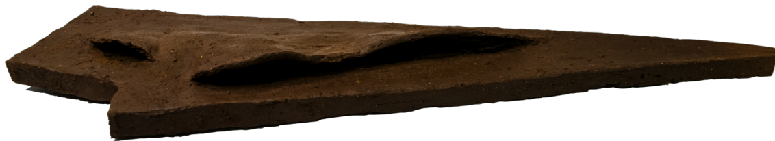
Fig. 10 Partido general, maqueta de greda.