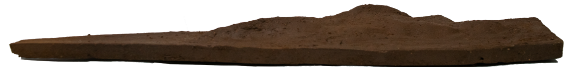
Fig. 12 Vista desde la zona rural, maqueta de greda.