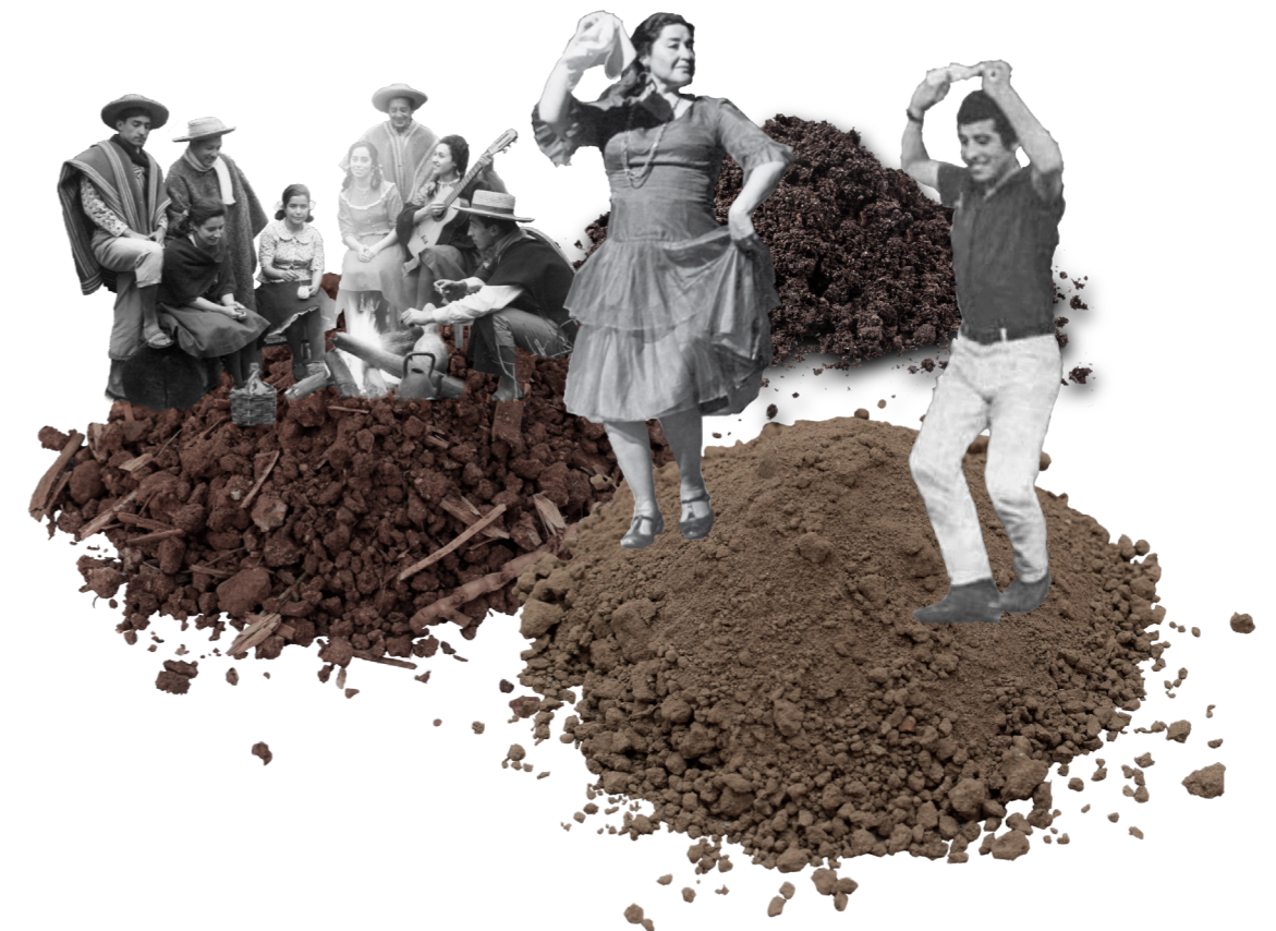
Fig. 3 Atmósfera proyecto.