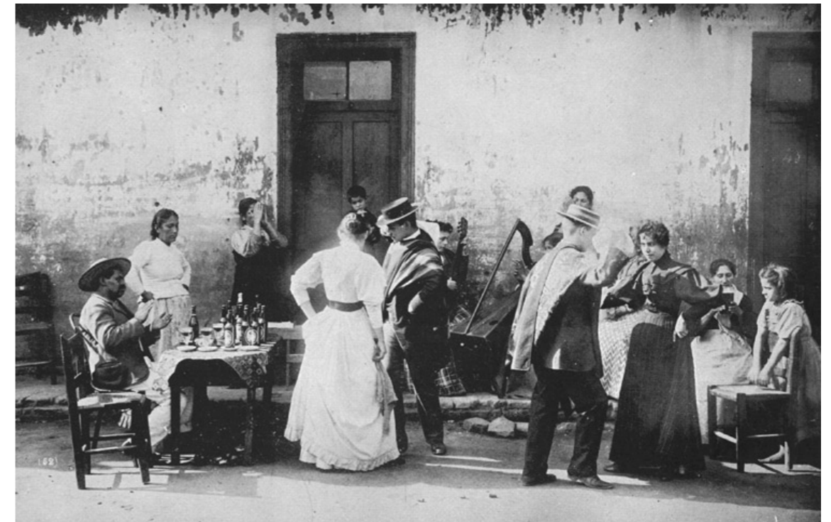
Img. 3 Pie de Cueca, 1900.

En la actualidad es termino ha ido quedando rezagado por la academia, sin embargo, una de las disciplinas que más se ha encargado de estudiar y desarrollar el concepto ha sido la antropología. La cual reconoce que siempre los pueblos se han expresado y singularizado por sus formas de actuar, de bailar, divertirse, etc. Por lo que, el folclore es parte de los elementos que singulariza a una comunidad y que se va heredando. En consecuencia, está cargado de una fuerte identidad local, que hace sentir a las