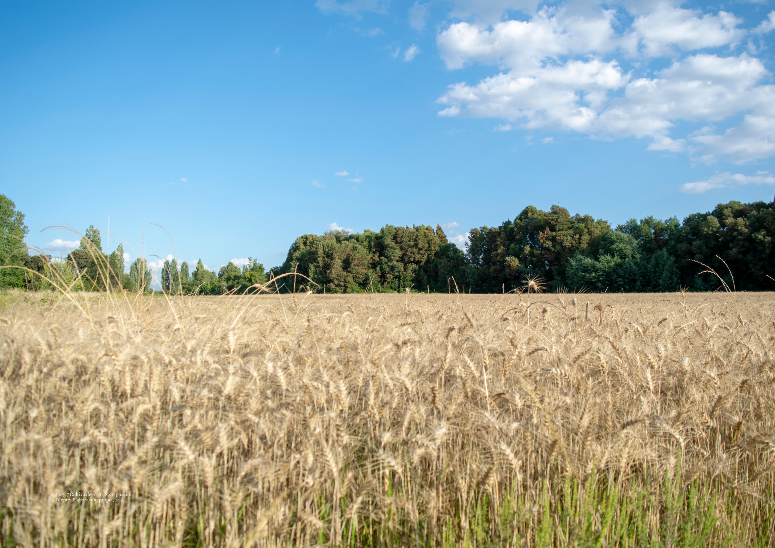
Img. 7 Cultivo de trigo, San Ignacio.