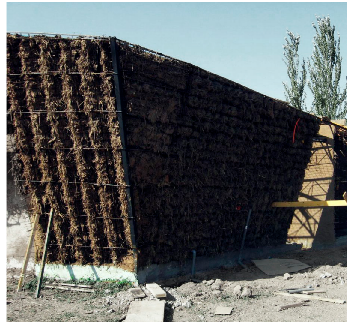
Img. 10 Vivienda de Terra-Panel.

“Un material no es interesante por lo que es en si, sino por lo que puede aportar a la sociedad“ John Turner 1927.