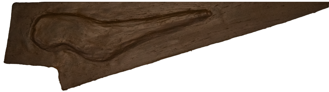
Fig. 9 Inserción en el terreno, maqueta de greda.