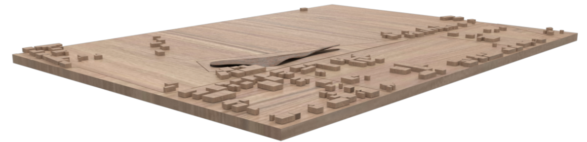
Fig. 7 Maqueta de Partido General

Para consolidar estos lineamientos la cubierta adopta la forma de la topografía del territorio , generando que desde el lado urbano se observe como un edificio oculto y del lado rural como un elemento del paisaje natural.