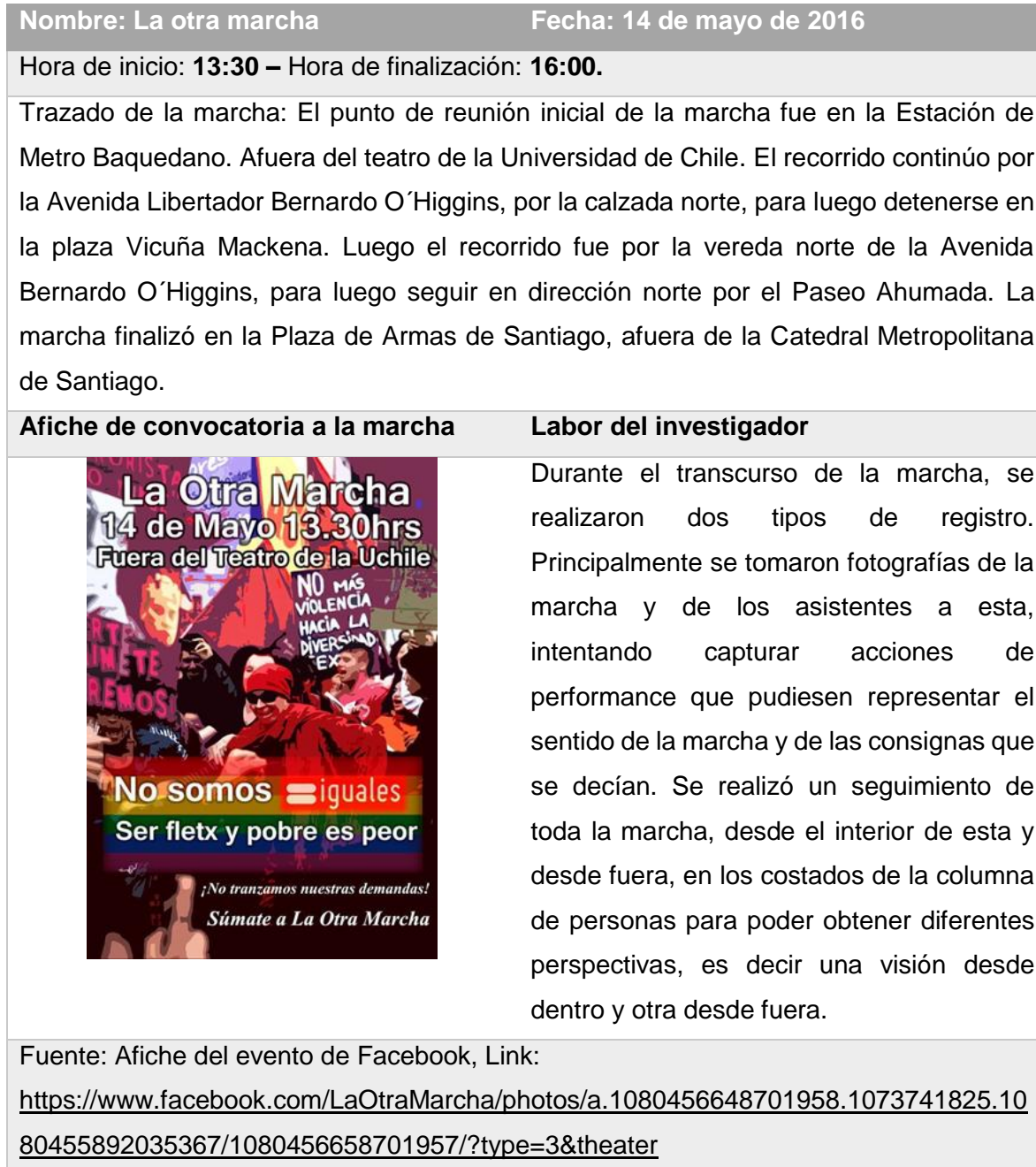
Tabla 2. La otra Marcha