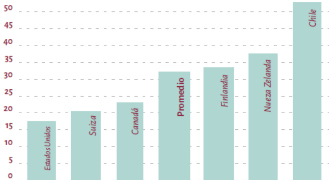
Figura 3. Recaudación por IVA vía impuestos

Nota: Tomado de Revolución democrática 2020