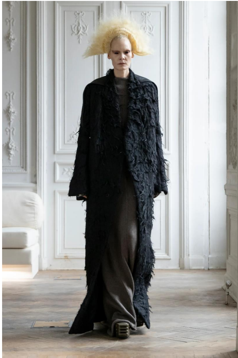
Nota 3. Rick Owens - Otoño Invierno 2024-2025 - París. [Fotografía]. Recuperado el 3 de diciembre de 2024, de www.expofashionmagazine.com . https://www.expofashionmagazine.com/es/n-28838/rick-owens-otono-invierno-20242025-paris