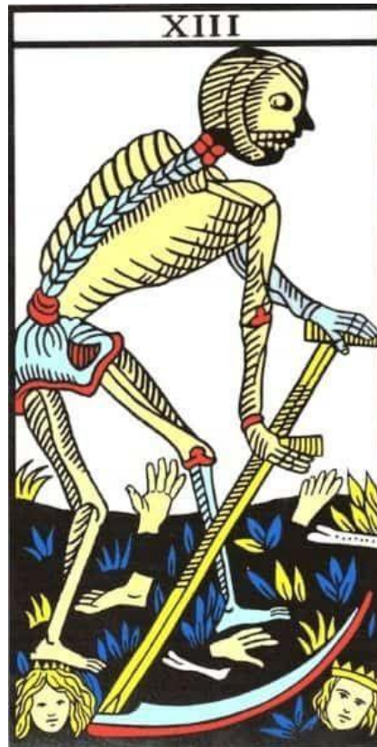
Imagen 1: La Muerte (Tarot de Marsella)

muerte opera como un proceso de renacimiento, donde cada individuo enfrenta el desmembramiento de su antigua identidad. Este desmembramiento resulta esencial para dejar atrás ideas, costumbres y formas de ser que ya no son útiles, permitiendo así un renacer hacia una nueva identidad (Nichols, 2012).