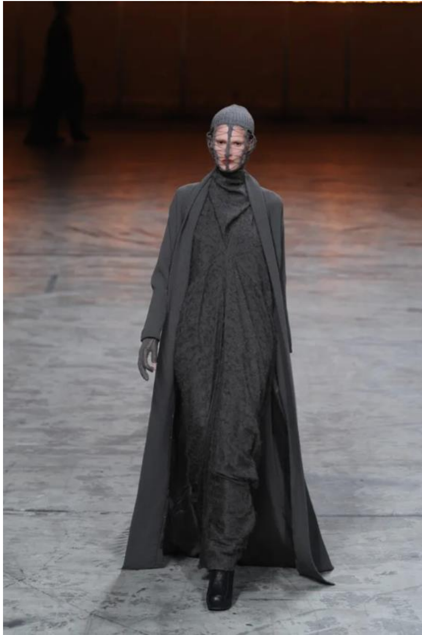
Nota 4. Rick Owens, otoño/invierno 2012. (s/f.). [Fotografía]. Recuperado el 3 de diciembre de 2024, de https://assets.vogue.com/photos/55c650e708298d8be218176e/master/w_1920,c_limit/00010fullscreen.jpg