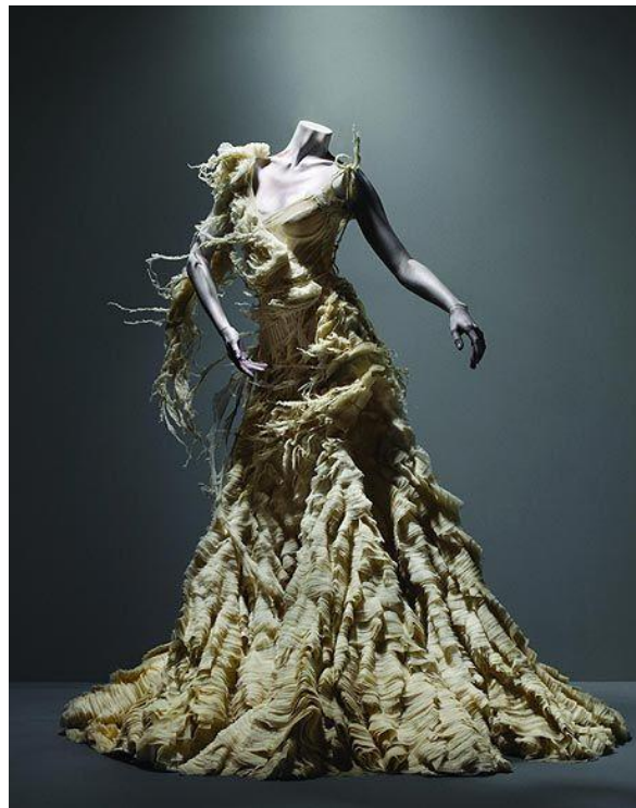
Imagen 6: Highland Rape, otoño/invierno 1995. McQueen.