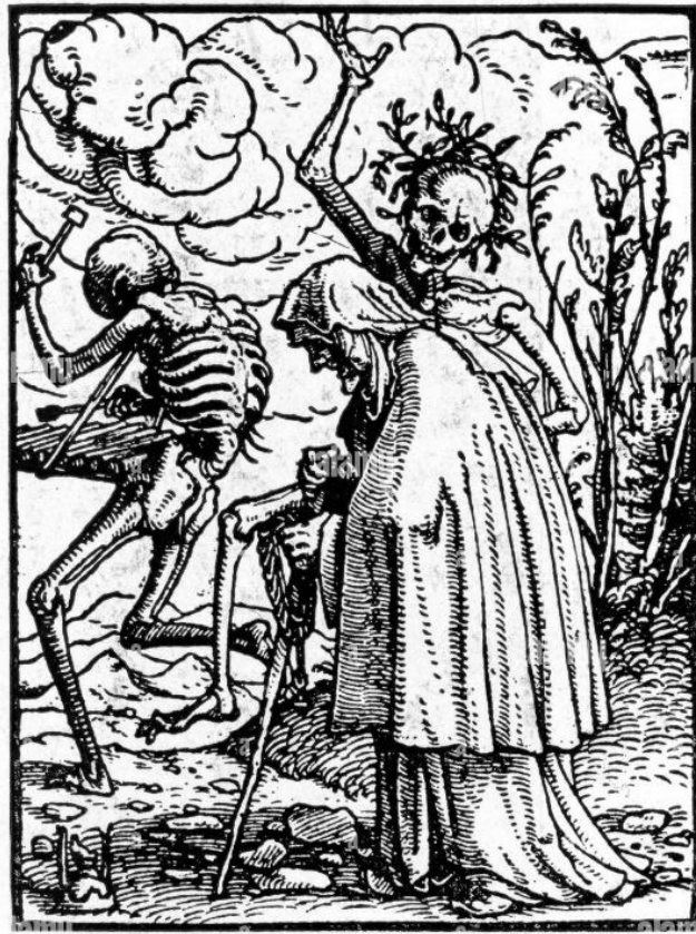
Imagen 2: Xilografía de la danza de la muerte de Hans Holbein titulada "Anciana" (1525).

Estas danzas a menudo incorporan elementos que refuerzan la idea de la vanidad y la efimeridad de la vida, representando a la muerte bailando con los vivos, lo que simboliza que todos, sin excepción, inevitablemente compartirán el mismo destino. En los países católicos, este tipo de representaciones es común; la alegoría de la muerte suele mostrarla como una figura activa que interactúa con los vivos, recordándoles su propia mortalidad. En las denominadas figuras yacentes, esta personificación de la muerte se manifiesta al interactuar con el cuerpo de los difuntos, a menudo en sepulcros.