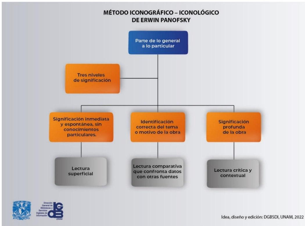
Imagen 13: Método Iconográfico – Iconológico de Erwin Panofsky y su aplicación a la lectura de imágenes.

elementos a través de un análisis simbólico y cultural; y el nivel iconológico, que busca comprender el significado profundo de las representaciones dentro de su contexto histórico, social y cultural. Este enfoque iconológico es útil para estudiar cómo los elementos visuales en la moda, específicamente aquellos relacionados con la muerte, están impregnados de significados y simbolismos que varían según la época y la cultura. Además, el análisis de la moda desde esta perspectiva permite desentrañar las connotaciones culturales y emocionales que emergen de estas representaciones visuales, revelando cómo la moda se convierte en un vehículo para transmitir y reinterpretar conceptos como la mortalidad y la trascendencia.