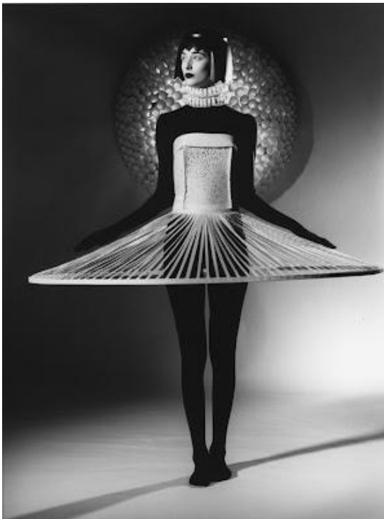
Imagen 11: A Costura do Invisível , 2004. Nakao.

Entre sus trabajos más icónicos destaca A Costura do Invisível (2004), un desfile donde presentó prendas de papel cortado a mano que fueron destruidas simbólicamente al final, cuestionando la efimeridad de la moda y su vínculo con el tiempo y la memoria. Este acto consolidó a Nakao como un creador que redefine las normas del diseño, abordando también temas como la sostenibilidad y el valor intangible del arte.