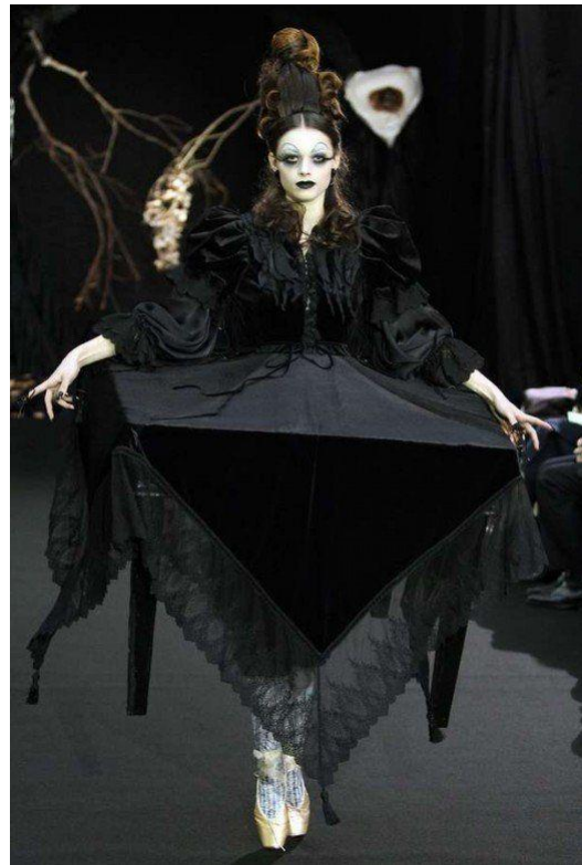
Imagen 10: Otoño/invierno 2012, Funakoshi.