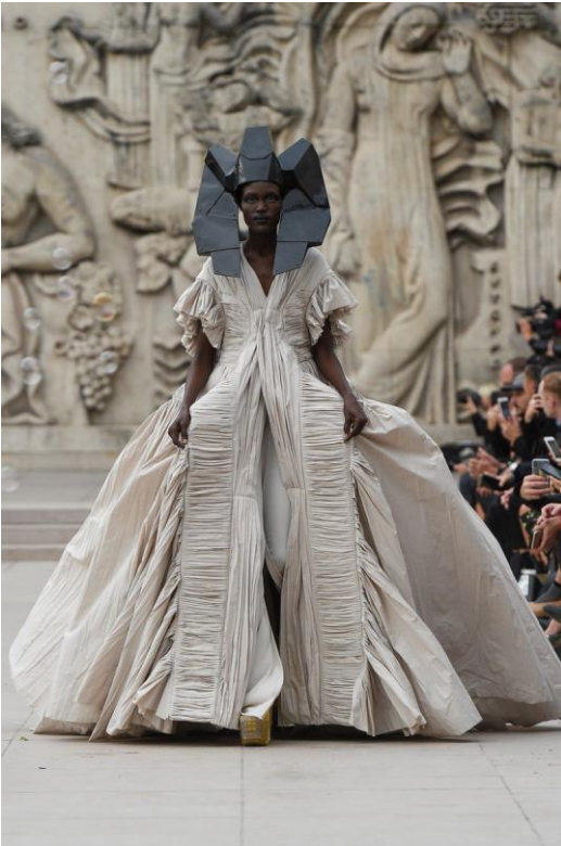
Imagen 7: Primavera 2020, Owens.

Rick Owens (1962) es un diseñador estadounidense conocido por su enfoque vanguardista y minimalista en la moda, que combina elementos de brutalismo, distopía y subversión estética. Nacido en Porterville, California, Owens comenzó su carrera en Los Ángeles antes de trasladar su marca homónima a París, donde consolidó su reputación internacional. Su estilo, a menudo descrito como "gótico glamoroso" o "grunge de lujo", se caracteriza por siluetas arquitectónicas, paletas