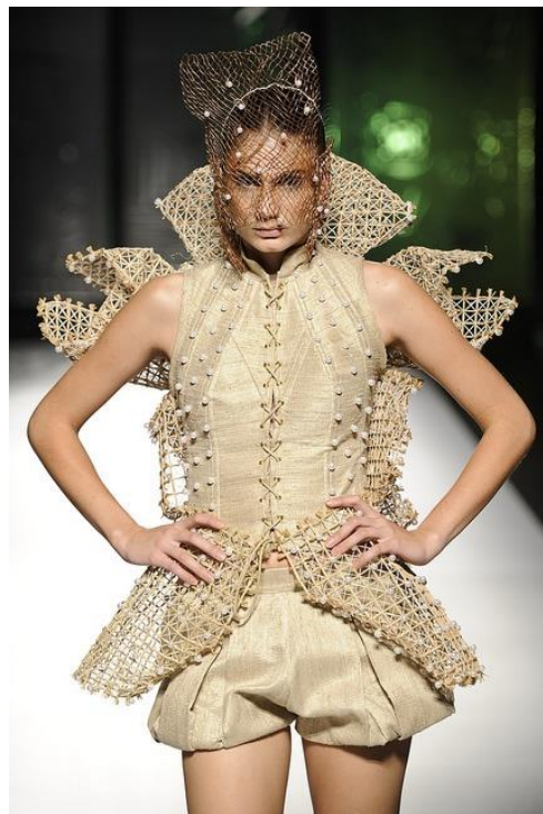
Imagen 12: Verano 2013. Nakao.