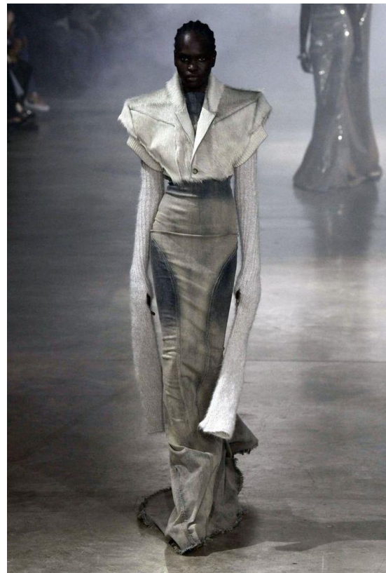
Imagen 8: Otoño/invierno 2022, Owens.

Owens no solo desafía las convenciones de la moda con sus diseños, sino que también utiliza sus colecciones como un medio para explorar temas como la mortalidad, la espiritualidad y la relación entre el cuerpo y la arquitectura. Sus desfiles, que a menudo incluyen presentaciones performativas y ambientes cargados de simbolismo, lo han posicionado como una figura central en la moda contemporánea, influyendo en el diseño, el arte y la cultura global.