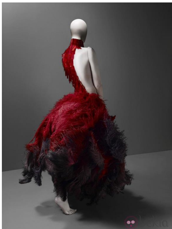
Imagen 5: Voss, primavera/verano 2001. McQueen.

Su obra no solo desafiaba los límites estéticos de la moda, sino que también abordaba temas filosóficos y sociales, estableciéndose como una figura clave en el diálogo entre moda, arte y cultura.