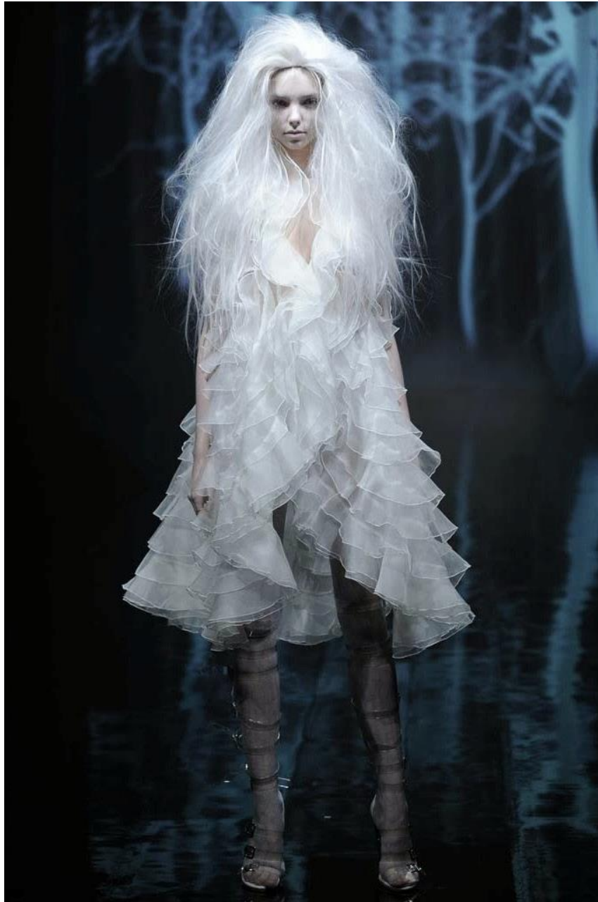
Nota 6. Alice Auaa primavera/verano2014. (s/f). [Fotografía]. Recuperado el 3 de diciembre de 2024, de https://cl.pinterest.com/pin/485333297316124686/