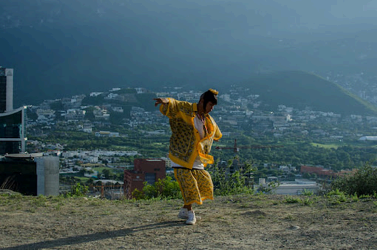
Ya no estoy aquí (2019)

Por otro lado, Siete años en Mayo (2019) y la serie Adictos al Claxon (2013), contienen elementos que nos llaman la atención en lo visual, lo sonoro, y a nivel de ejecución. En Siete años en Mayo (2019), nos llama la atención cómo se desarrolla el testimonio, el cual deriva en un fuera de campo que imaginamos. El protagonista está frente a una fogata y nos cuenta una historia de abuso policial que vivió en carne propia, haciéndole cambiar su vida por completo. Este se convierte en un relato tan potente que nos ayuda a crear varios escenarios dentro de nuestra cabeza y vivir una variedad de emociones y sensaciones a pesar de la aparente “simplicidad” visual. Es este “formato” de testimonio el que nos llama la atención para ocupar, el protagonista sentado diciendo directamente a cámara sus vivencias.