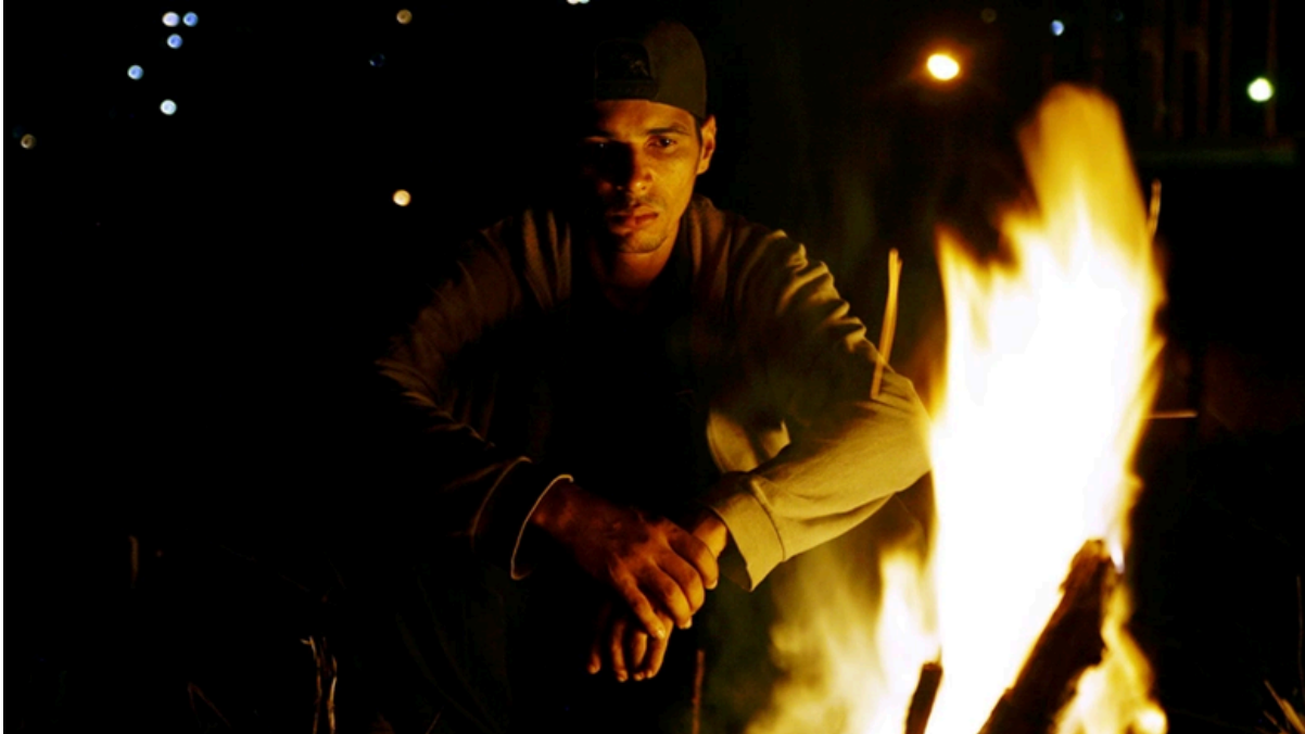
Siete años en mayo (2019)

En el caso de Adictos al Claxon (2019), es una serie desarrollada por CNTV que busca dar voz a los taxistas de diversas ciudades de Latinoamérica, contando sus experiencias y sus pensamientos de la contingencia de la época en la que fueron grabados los episodios. Al desarrollarse una buena parte de cada capítulo dentro de un taxi, se nos aporta una perspectiva de la ciudad diferente y una visualidad y sonoridad única, asociada a estos medios de transporte.