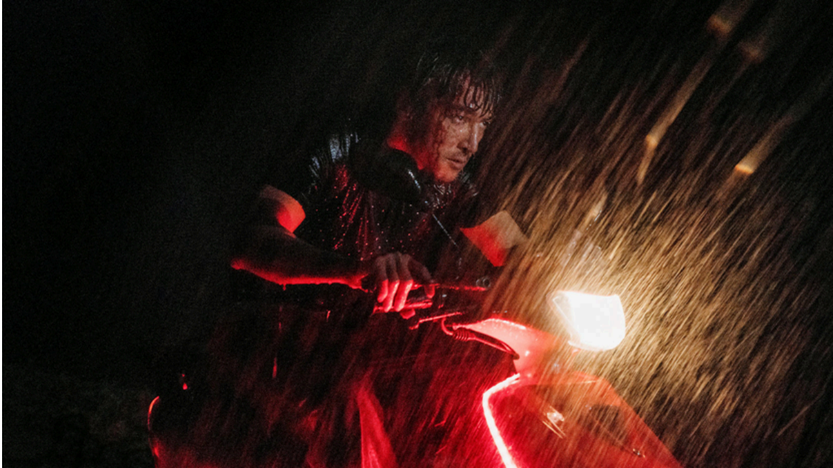
The wild goose lake (2019)