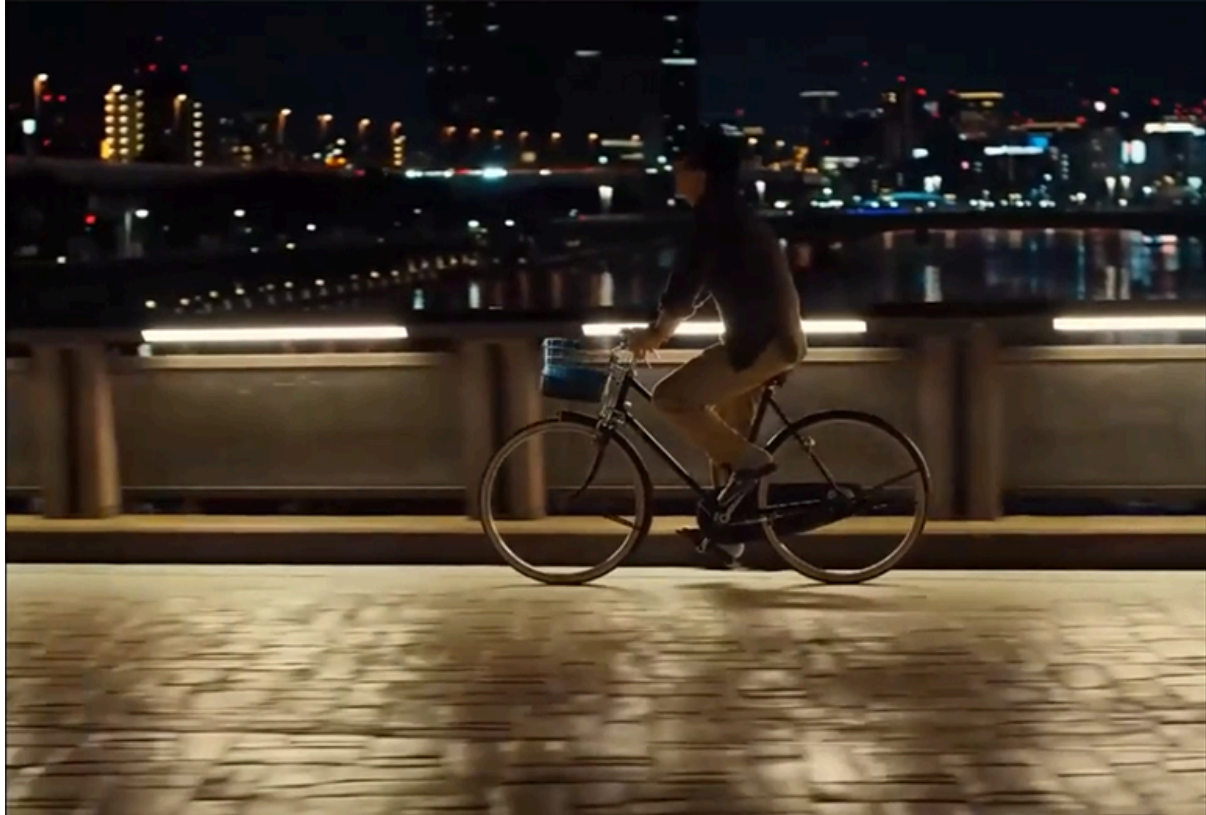
Perfect Days (2023)