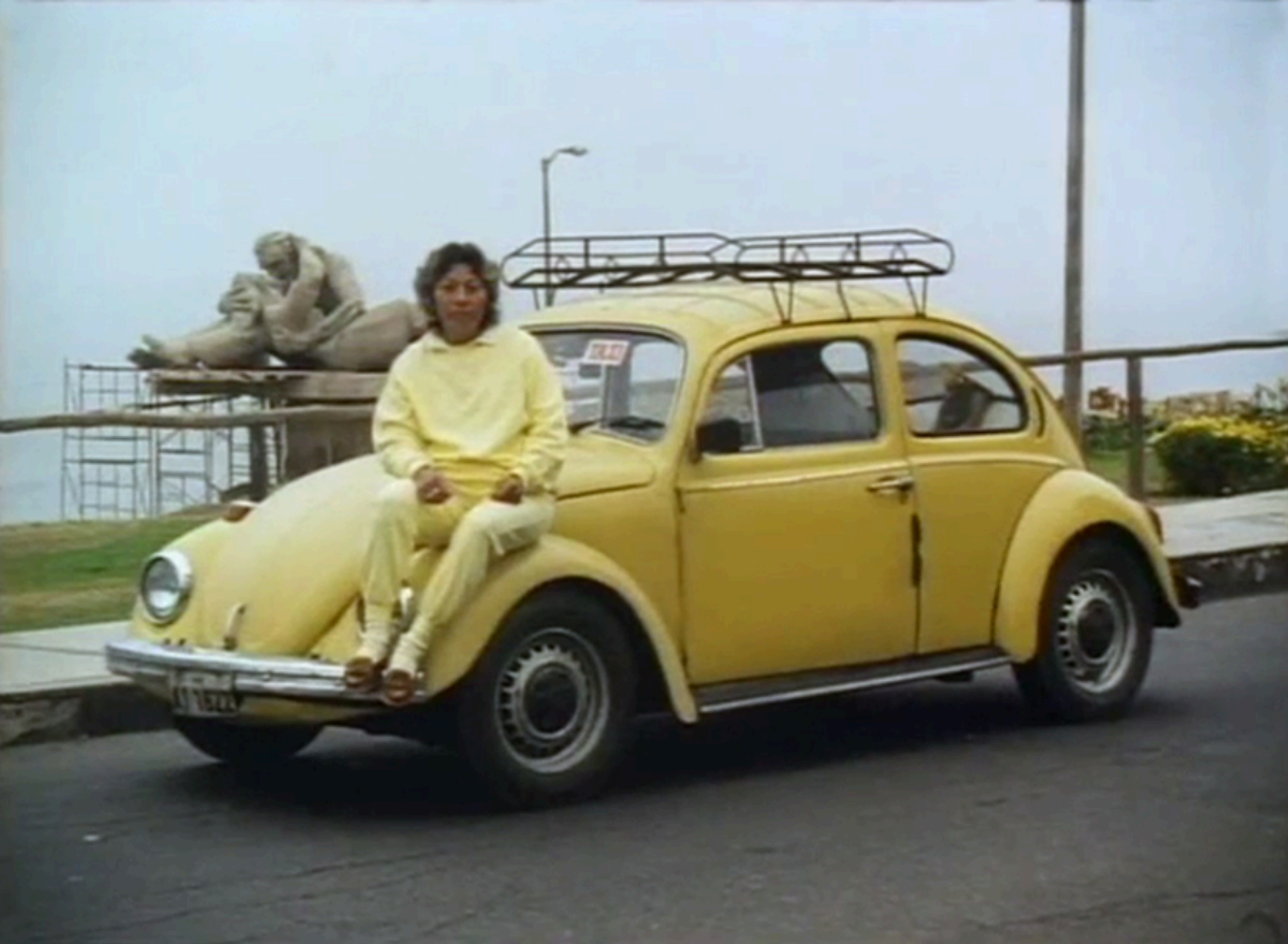
Metal y Melancolía (1993)

Por otro lado, tomamos de referencia al cine asiático porque éste es un cine que se ha encargado de filmar a sus personajes en vehículos, muchas veces en motocicletas, muchas veces de noche. Por esto, estas referencias nos sirven desde un lado visual y sonoro, específicamente para grabar personas recorriendo las metrópolis en moto y/o bicicletas.