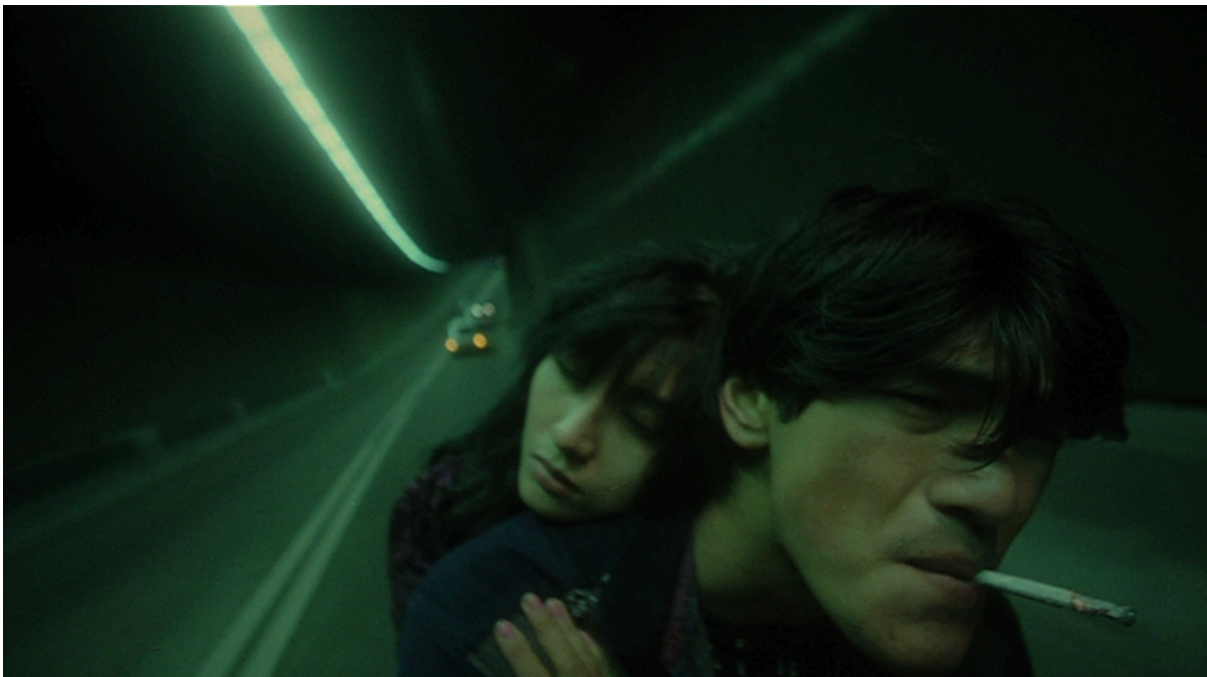
Fallen Angels (1995)