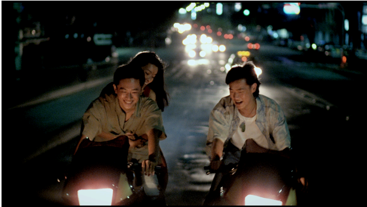
Rebels of the Neon God (1992)

personajes, sobre todo cuando recorran las calles de Santiago de Chile. Por último, encontramos a Perfect Days (2023) la cual contiene varias escenas de su protagonista andando en bicicleta, referencia que nos sirve para indagar en cómo retratar a este vehículo.