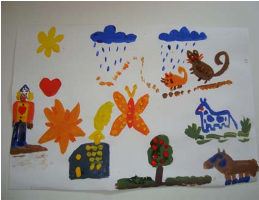
1ª sesión. “El dolor de J”

Al terminar la paciente dice que cree que el Arte Terapia le va a servir para botar sus emociones lo cual se observa claramente en el transcurso de esta primera sesión, tanto en la gráfica, donde el payaso llora y finalmente llueve, como en ella misma que se describe como llorona, al no poder contener las lágrimas.