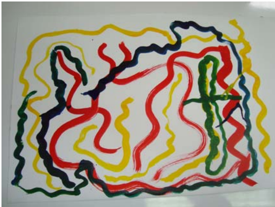
5ª sesión: “El amor a Jesús”