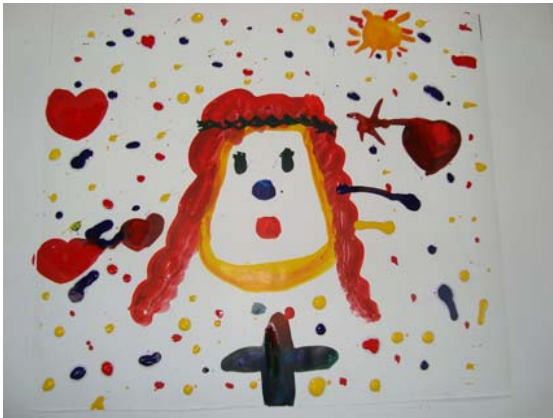
5ª sesión: “Timbres de corazón y estrellas”