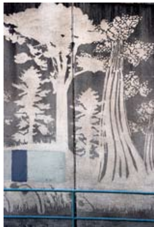
GREEN WORKS. (Internet)

Durante las últimas décadas algunas marcas corporativas (“night clubs”, grupos de música, sitios web, productos, etc.) han realizado campañas promocionales utilizando el lenguaje y técnicas del graffiti, contratado a artistas callejeros para realizarlas.