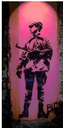
BLEK LE RAT.

A mediados del siglo XX la racionalidad comienza a ser cuestionada. Una sociedad libre e igualitaria no es más que un sueño utópico en las sociedades que siguen el modelo de desarrollo económico liberalista.