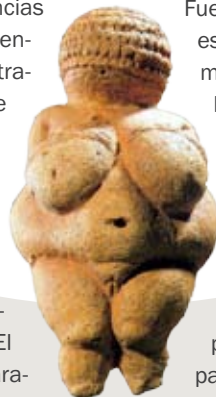
VENUS DE WILLENDORF.

Esta no fue una sociedad “matriarcal” donde la mujer estaba sobre el hombre, como podríamos definir a una sociedad opuesta a la patriarcal, sino que fue una sociedad igualitaria y solidaria, y la fuente de donde emanaba la vida humana, animal y vegetal era la Gran Madre. El culto a la Diosa lo reconocemos clara-