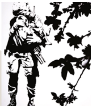
BLEK LE RAT. (internet).

Durante la Segunda Guerra Mundial el fascismo italiano usó el estencil, o plantillas, para pintar propaganda política en los muros de las ciudades, pero a finales de los '60 y durante los '70 vascos y mexicanos son quienes vuelven a utilizar el estencil en el espacio urbano, pero ahora con una resignificación política. También en el París del '68 hay una enorme respuesta callejera de arte de protesta, que decae y