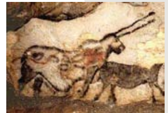
CUEVA DE LASCAUX, FRANCIA.

mente hasta Creta, civilización que cayó hace tan solo 3200 años. Este culto vivió a través de los milenios hasta nuestros días como ISIS, NUT, MAAT, ISHTAR, INANA, ASTARTE, LILITH, KORÉ, HERA, CERES, SIBELES, SHEKHINA, VIRGEN MARIA y PACHA MAMA entre tantas otras.