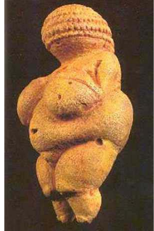
Venus de Willendorf

Las deidades femeninas cruzan toda la historia de la humanidad, con diversidad de roles y atributos. Prueba de esto son los hallazgos arqueológicos de figuras femeninas y embarazadas encontrados como por ejemplo las estatuillas de la Venus de Willendorf, de Laussel, de Grimaldi, etc. Símbolos prehistóricos de fertilidad e inmortalidad.