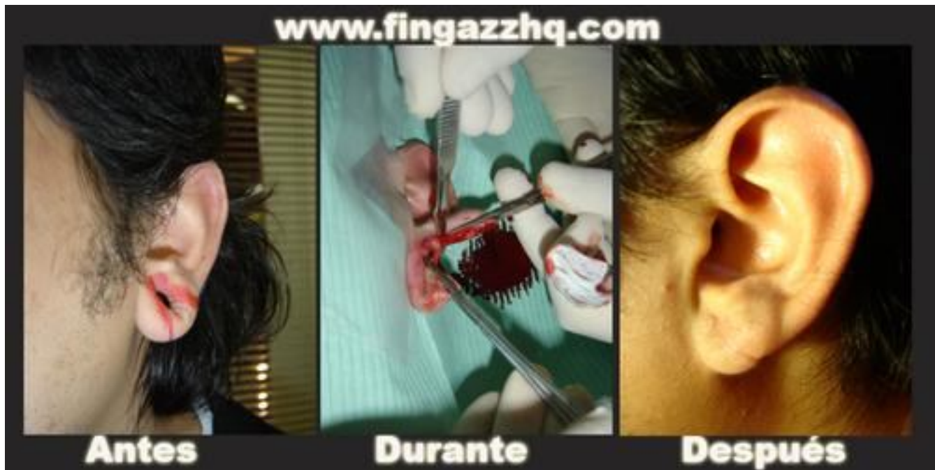
7. Caso de reconstrucción de lóbulo