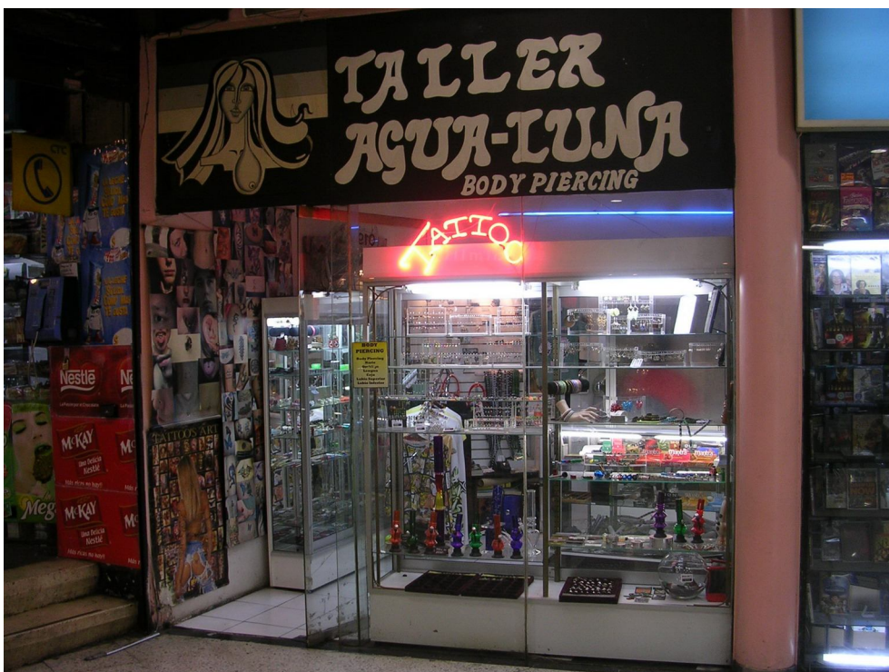
12. Local "Agua-Luna"