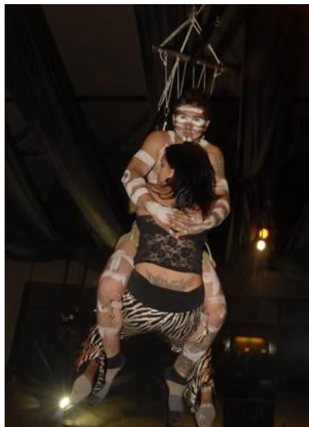
7. Segunda suspensión