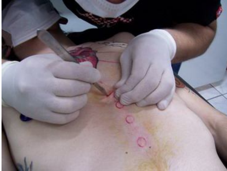
4. Realización de una abertura para realizar el implante