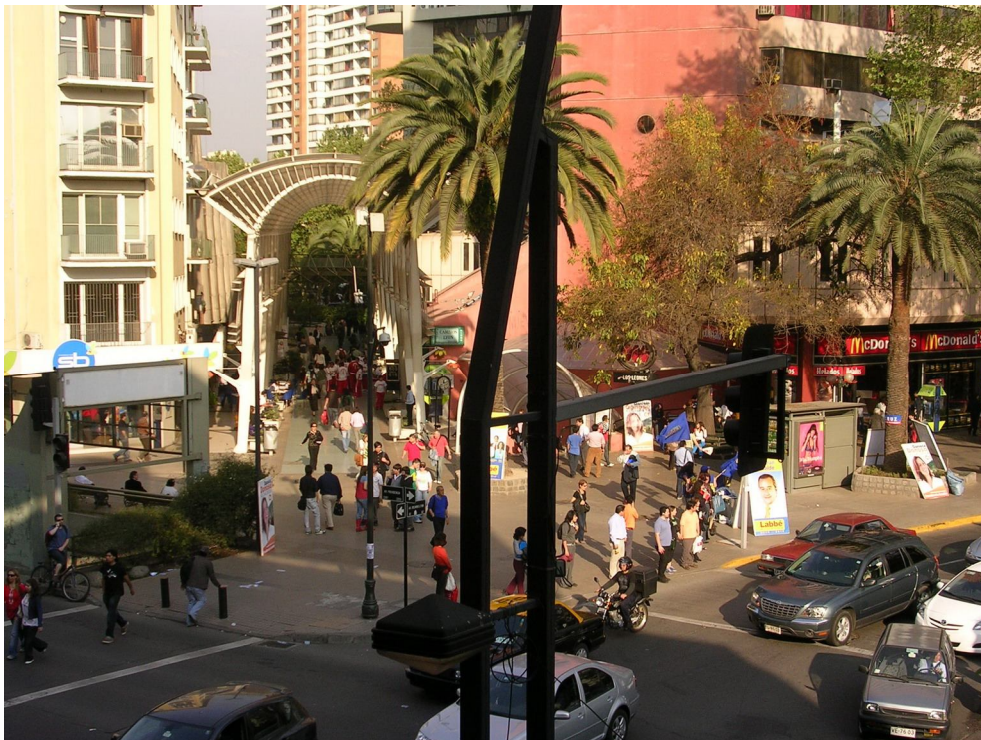
2. Paseo peatonal Las Palmas visto desde el Portal Lyon