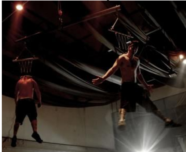
2. Primera suspensión