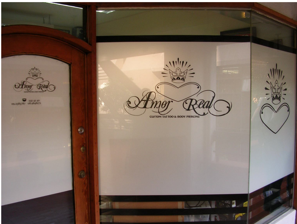
6. Local "Amor Real"