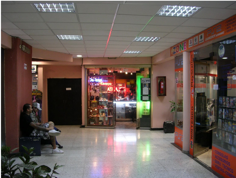
11. Local "In-nova"