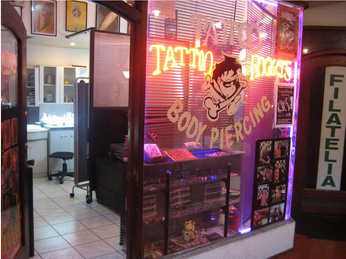
7. Local “Tattoo Rockers”