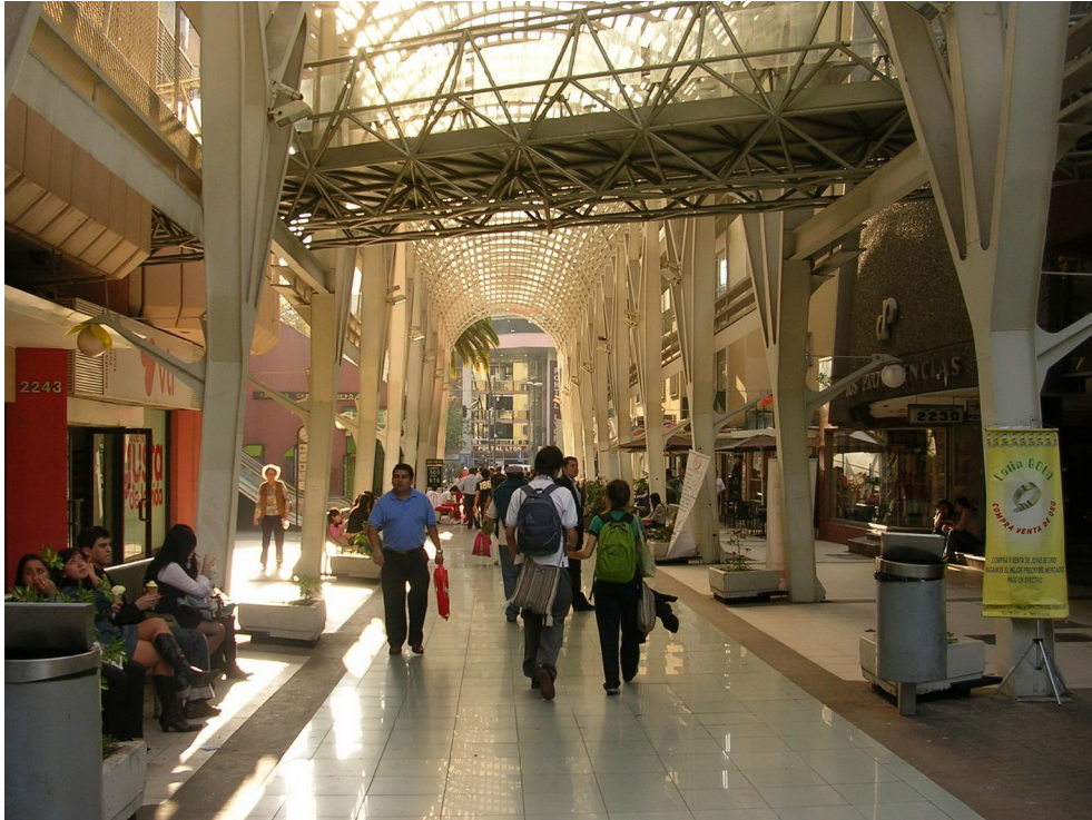
1. Paseo peatonal Las Palmas