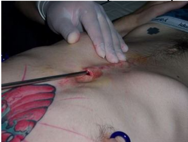
5. Colocación de los implantes