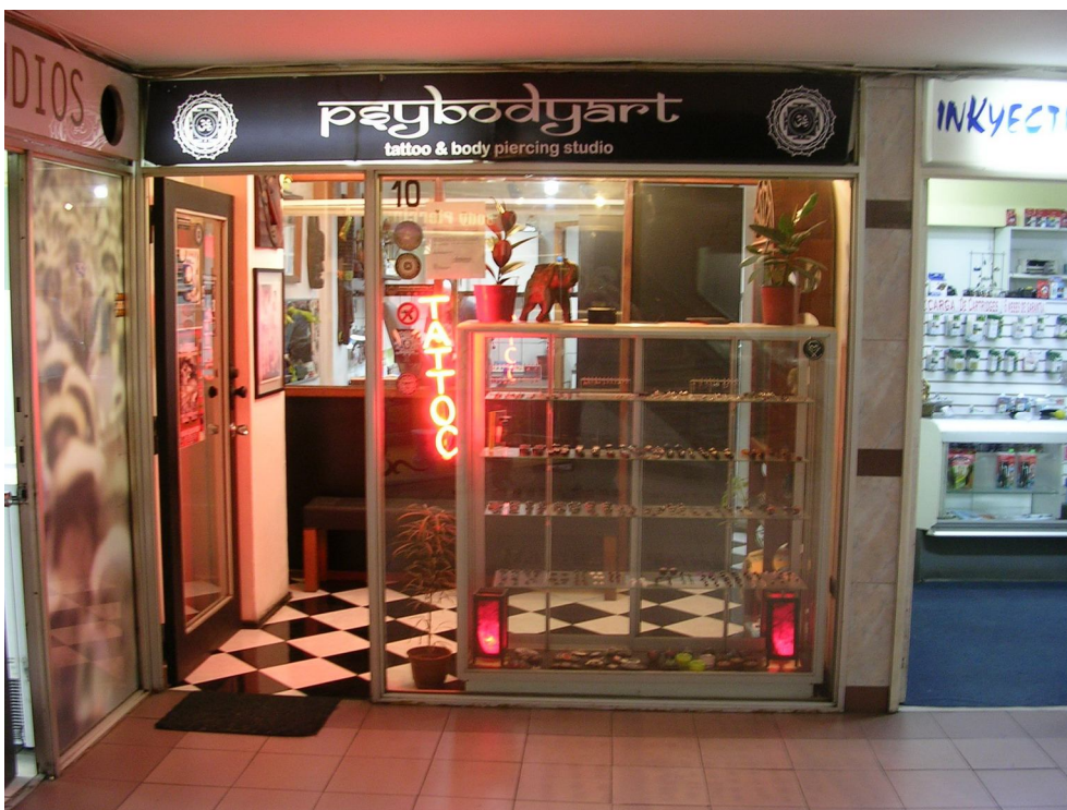
10. Local "Psybodyart"