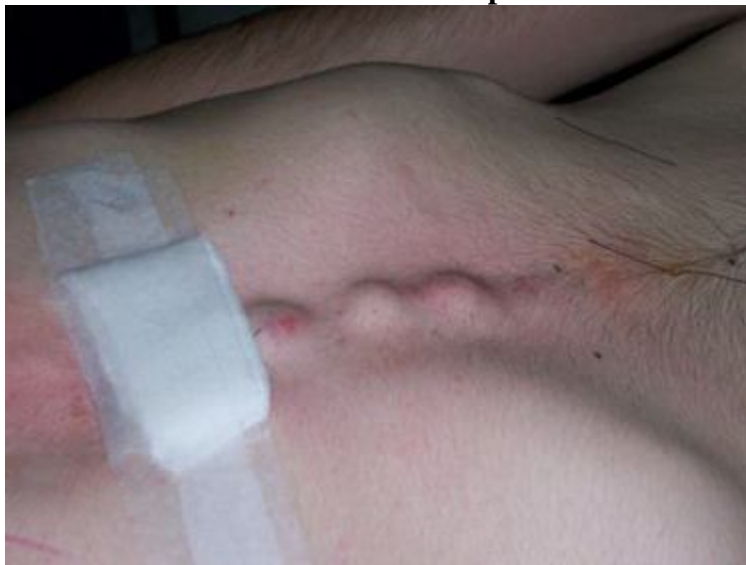
6. Implantes puestos