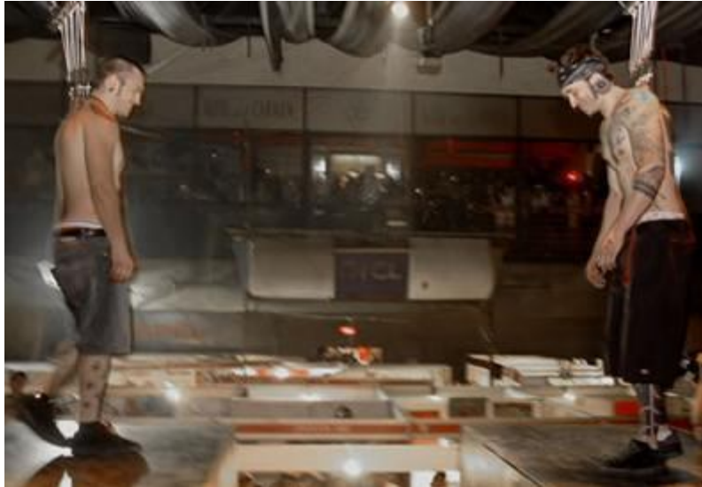
1. Primera suspensión