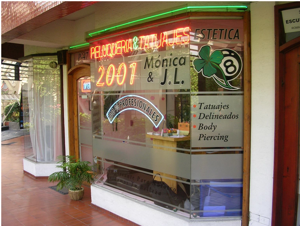
5. Local "2001"