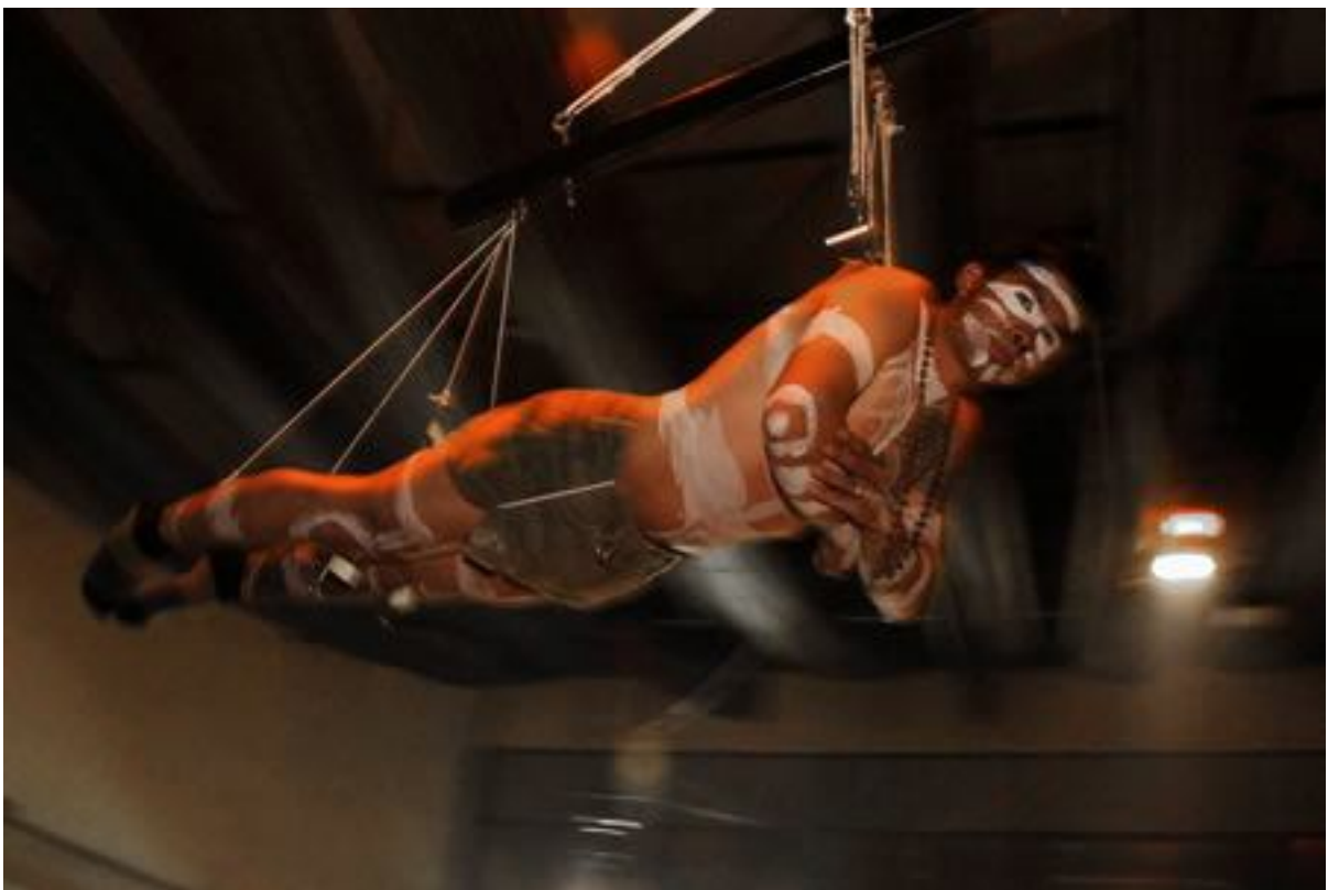
5. Segunda suspensión