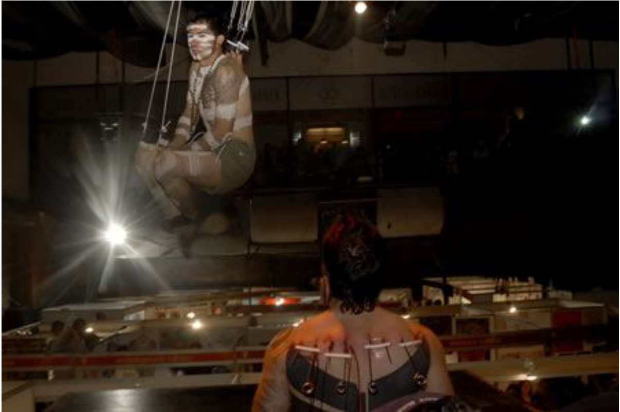
6. Segunda suspensión