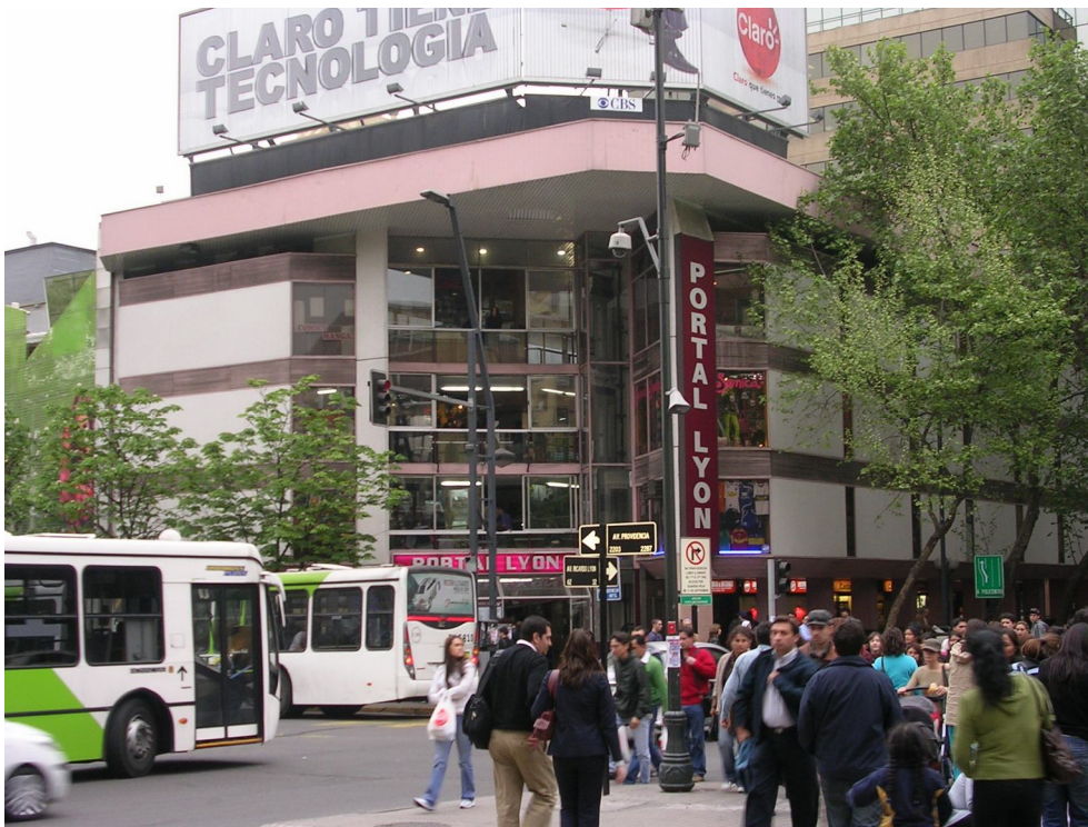
9. Portal Lyon