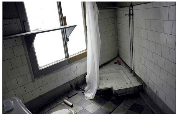
Fotografía 6 Baño