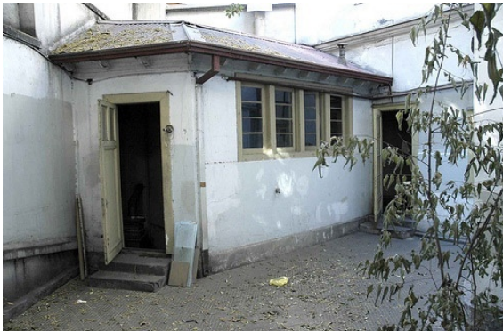
Fotografía 3 Caldera y cocina, desde el patio interior