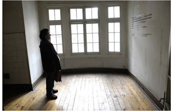
Fotografía 8 Pieza de enfermos y heridos