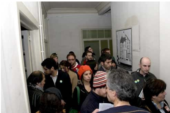
Fotografía 9 Pasillo segundo piso