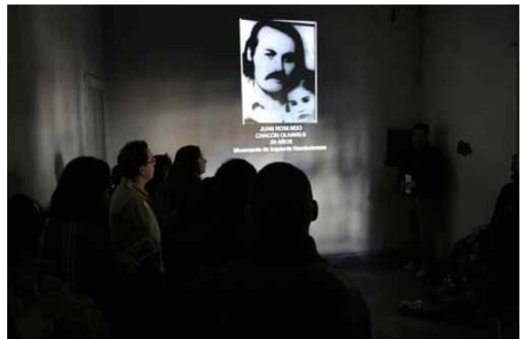
Fotografía 10 Presentación desaparecidos de Londres 38