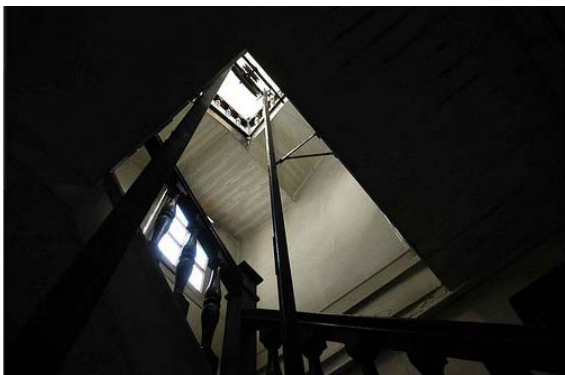
Fotografía 5 Escalera "de caracol"