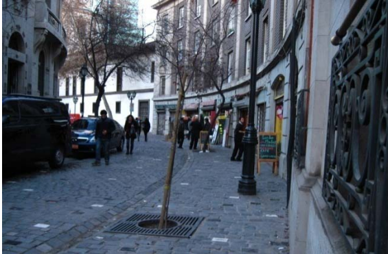
Fotografía 1 Calle Londres