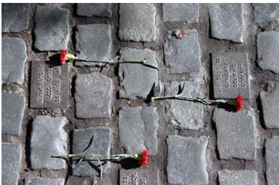
Fotografía 11 Placas del memorial de calle Londres