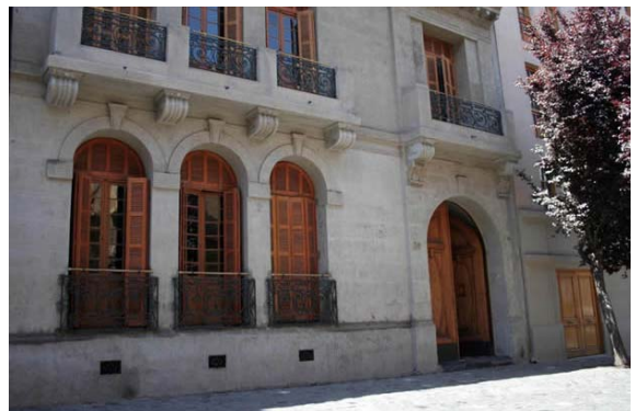
Fotografía 12 Fachada actual de Londres 38