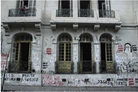
Fotografía 7 Fachada antigua de Londres 38