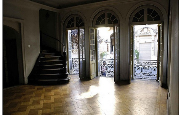
Fotografía 2 Salón del primer piso