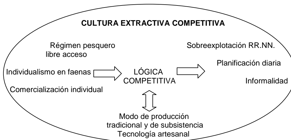
Esquema relaciones causales, cultura extractiva competitiva, elaboración propia (2007)

A continuación se presenta un esquema de relaciones causales, con las principales características de una cultura extractiva competitiva del sector pesquero artesanal, y posteriormente se desarrolla la descripción y análisis de cada uno de los temas categorizados.