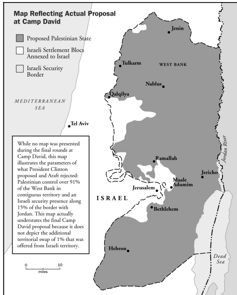
Mapa 2. Mapa Reflejando la Propuesta de Camp David

territorio en la Ribera Occidental y habían establecido un sinnúmero de puestos de control los cuales limitaban su libre tránsito.