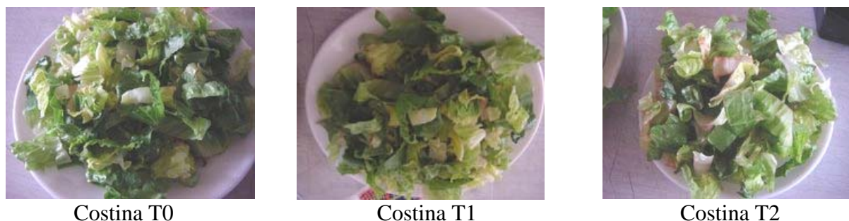
Figura 7. Lechuga tipo Costina después de 7 días de almacenaje.

En la lechuga tipo Milanesa a los 7 días sólo se pudo evaluar los tratamientos Milanesa T0 y Milanesa T2, el tratamiento Milanesa T1 por motivos de seguridad no se evaluó, debido a la alta contaminación presentada en el análisis microbiológico realizado antes de la evaluación (Cuadro 22). En este caso la apariencia resultó ser “Menos que regular” para ambos tratamientos y el pardeamiento “Levemente alto”; la aceptabilidad fue “Indiferente” para ambos tratamientos y sólo presentó diferencias significativas el parámetro de sabor que obtuvo un valor equivalente a “Levemente alto” para Milanesa T0 y “Levemente bajo” para Milanesa T2 (Figura 8)