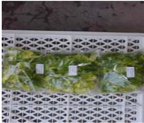
Cos T0 Cos T1 Cos T2 Figura 2. Costina T0, T1 y T2 a los 7 días de almacenamiento.

Aceptabilidad: Los tratamientos Costina T0 y Costina T1 fueron aceptados por el panel de evaluadores, mientras que Costina T2 fue “Indiferente” para el panel. Aunque no hubo diferencias significativas, el tratamiento Costina T0 tuvo la mejor evaluación, también fue el que tuvo mejor apariencia, turgencia, textura y un menor pardeamiento.