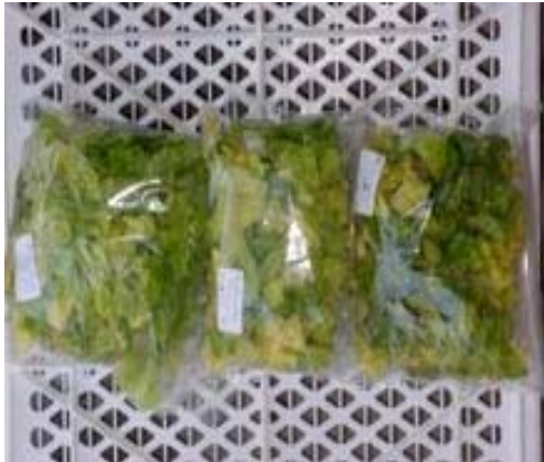
Mil T0 Mil T1 Mil T2

la textura “Más que regular”, con una “Muy baja” acidez y un sabor “Normal”, fue aceptada por el panel de evaluadores (Figura 3).