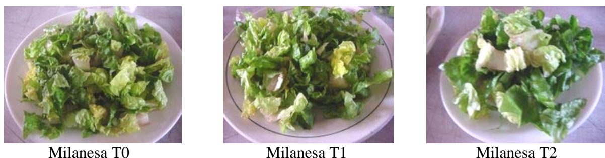
Figura 8. Lechuga tipo Milanesa después de 7 días de almacenaje.

En la lechuga tipo Milanesa a los 7 días sólo se pudo evaluar los tratamientos Milanesa T0 y Milanesa T2, el tratamiento Milanesa T1 por motivos de seguridad no se evaluó, debido a la alta contaminación presentada en el análisis microbiológico realizado antes de la evaluación (Cuadro 22). En este caso la apariencia resultó ser “Menos que regular” para ambos tratamientos y el pardeamiento “Levemente alto”; la aceptabilidad fue “Indiferente” para ambos tratamientos y sólo presentó diferencias significativas el parámetro de sabor que obtuvo un valor equivalente a “Levemente alto” para Milanesa T0 y “Levemente bajo” para Milanesa T2 (Figura 8)