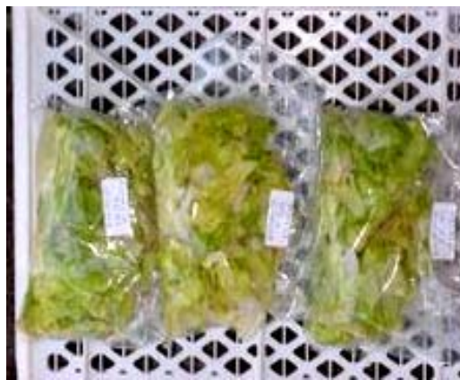
Esc T0 Esc T1 Esc T2

En el caso de Española, visualmente, Española T0 se presentó menos oxidada que Española T1 y Española T2, no se presentaron diferencias apreciables entre estas dos últimas, ambas oxidadas (Figura 5).