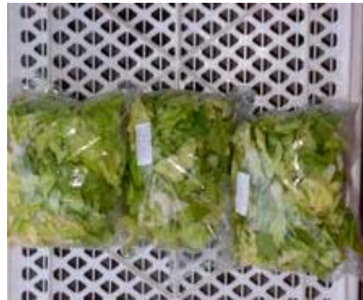
Esp T0 Esp T1 Esp T2