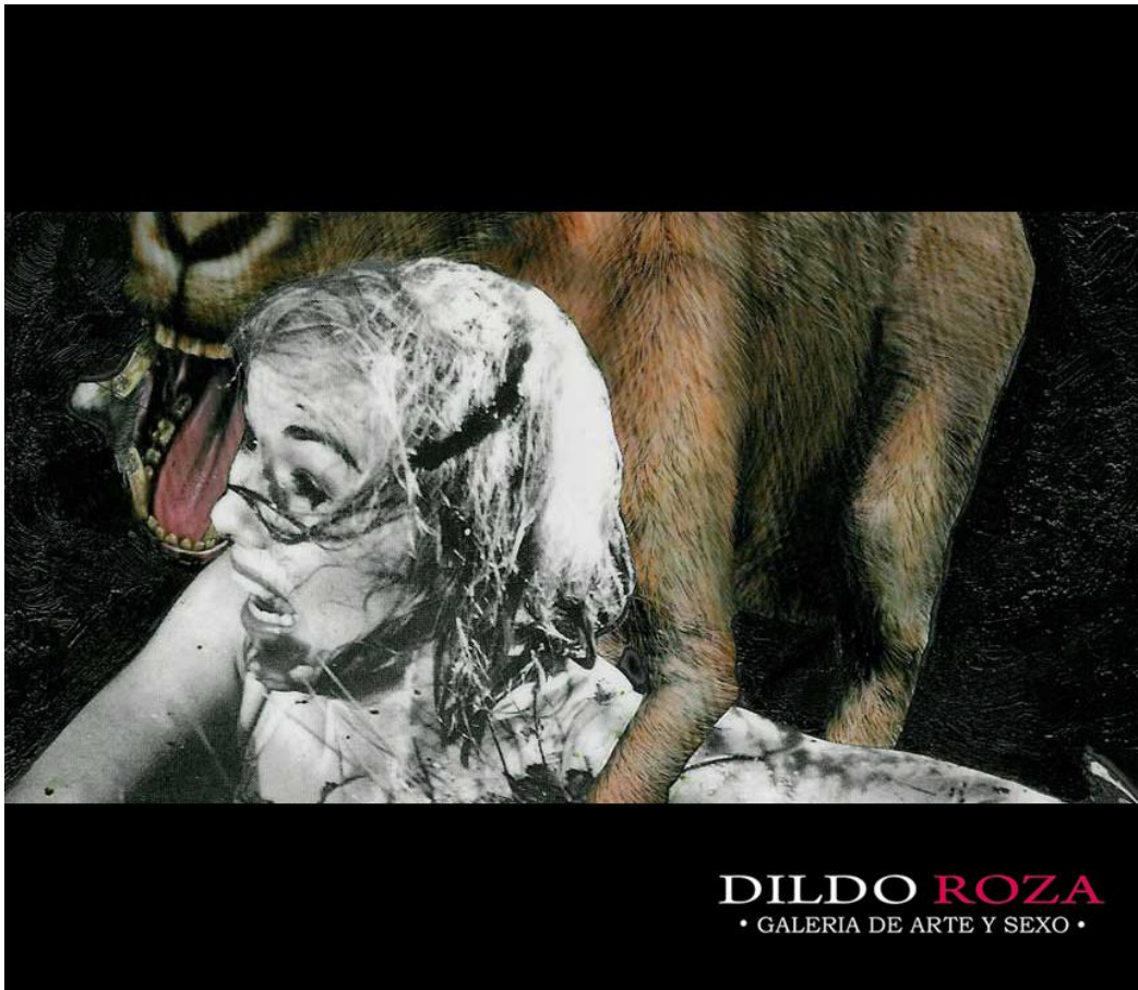
Titulo: Abyecta Autor: Eli Neira (Expositora - Dildo Roza)