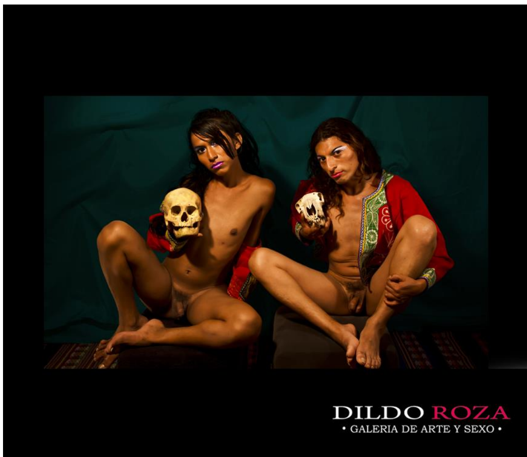
Título: Erótica Mitológica Autor: Pablo Maire (Expositor - Dildo Roza)

Los herederos de Lacan saldaron sus deudas con el fisco francés donando el cuadro al Estado y en 1995 este fue expuesto en las salas del Museo de Orsay. La vulva sudorosa, la vagina expuesta inicia una segunda vida pública, entrando por decreto estatal en escena como una obra más de las obras del pintor, como una de las postales mejor compradas por los turistas. Ciento treinta años después el así llamado Origen del mundo perdía su carácter inicial y su goce se tornó público, museístico, a despecho de los velos y los cerrojos que lo habían cubierto. Si en un principio se requería de la parsimonia ritual para apreciar la obra, hoy podría enmarcarse una reproducción para colgarla en la pared del comedor, y mientras se come pan con palta a la hora de once, lanzar algún comentario acerca de las pinceladas de Courbet con la despreocupación de quien habla del clima. La vagina, por cierto, sigue ahí; lo que ha cambiado es la mirada.