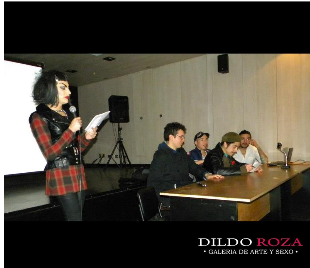
DILDO ROZA EN SALA ADOLFO COUVE UNIVERSIDAD DE CHILE