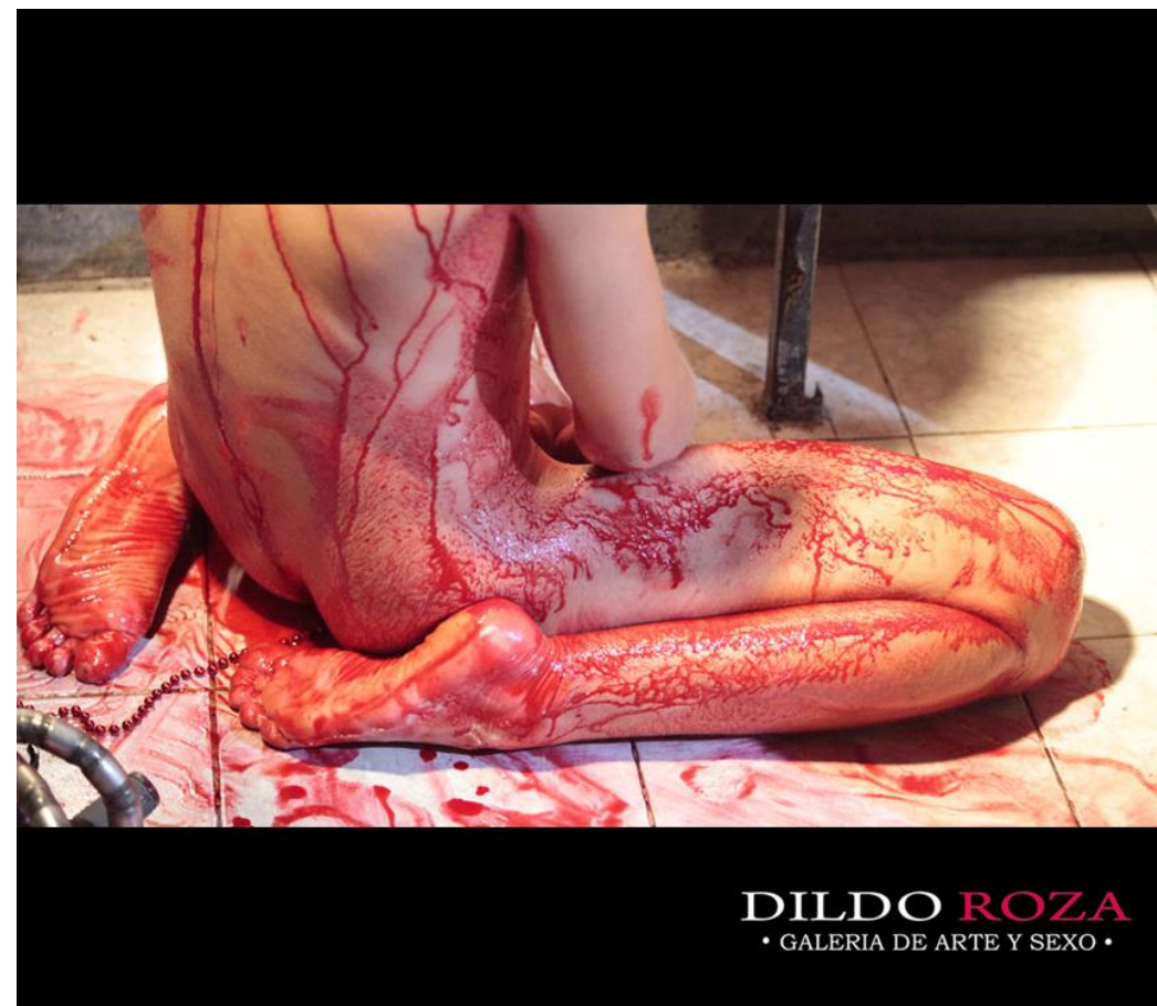
MASTURBACION ACTO DE CULPA Performance de Gustavo Solar