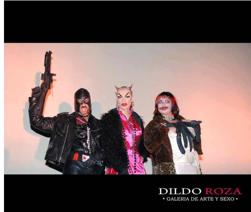
1º FESTIVAL DE VIDEO ARTE PORNO los Artistas: Hija de Perra, Irina la Loca y Feli Pink