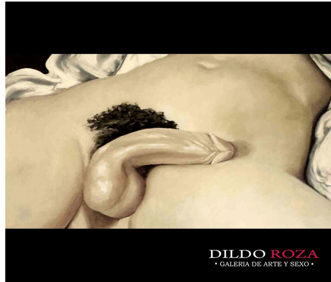
Título: Fin del Mundo Autor: Rodrigo Troncoso (Director de Arte - Dildo Roza)