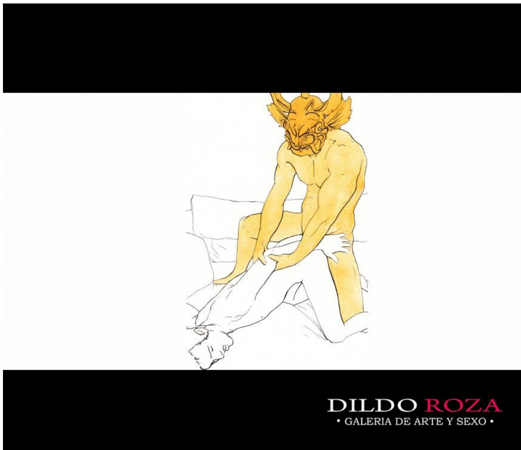
Título: Acuarela y Pornografía Autor: Jorge González Araya (Ilustrador - Dildo Roza)