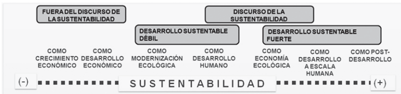
Figura 2: clasificación del concepto de desarrollo en función de la noción de sustentabilidad

A continuación, se presenta un esquema que sintetiza la tipología del par desarrollo/sustentabilidad (Figura 2).