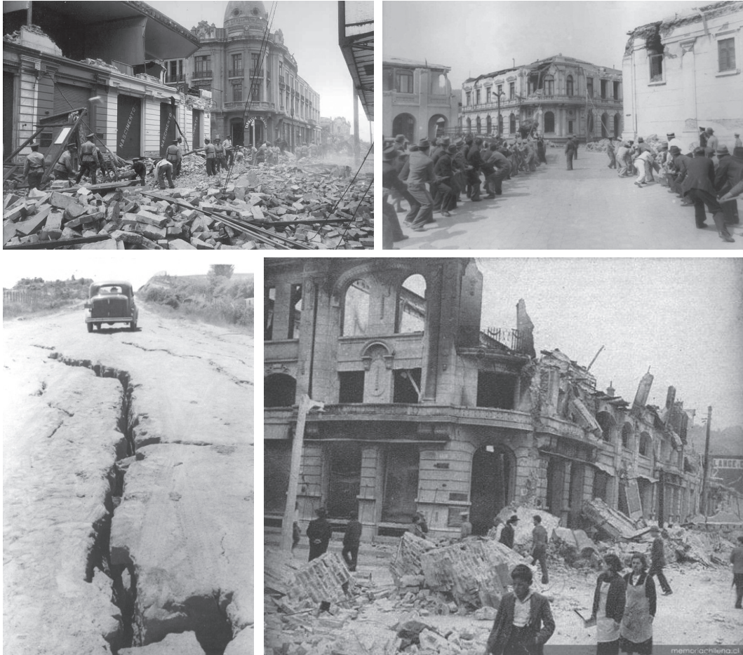
Figura N° 3 Imágenes posteriores al terremoto de 1939 en Concepción. Edificios y caminos afectados en el centro de la ciudad y alrededores