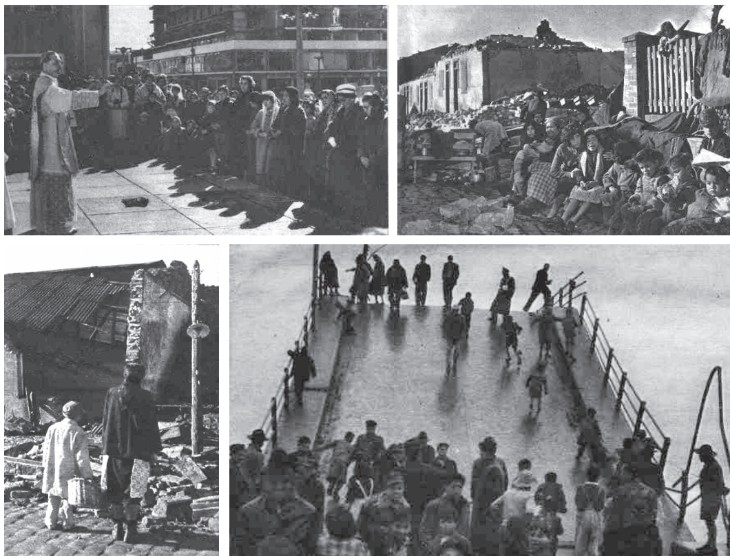
Figura N° 4 Imágenes posteriores al terremoto de 1960 en Concepción. Edificios dañados, misa a cielo abierto y puente sobre el río Biobío destruido