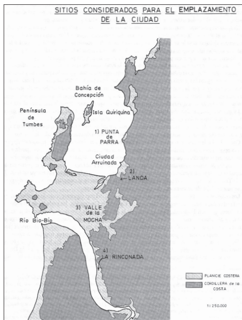
Figura N° 1 Sitios considerados para el traslado de Concepción.