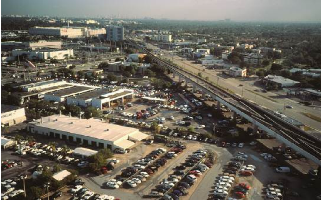
Figura 02 Expansión horizontal y dependencia del automóvil en el contexto norteamericano. Miami, Estados Unidos. 1998.