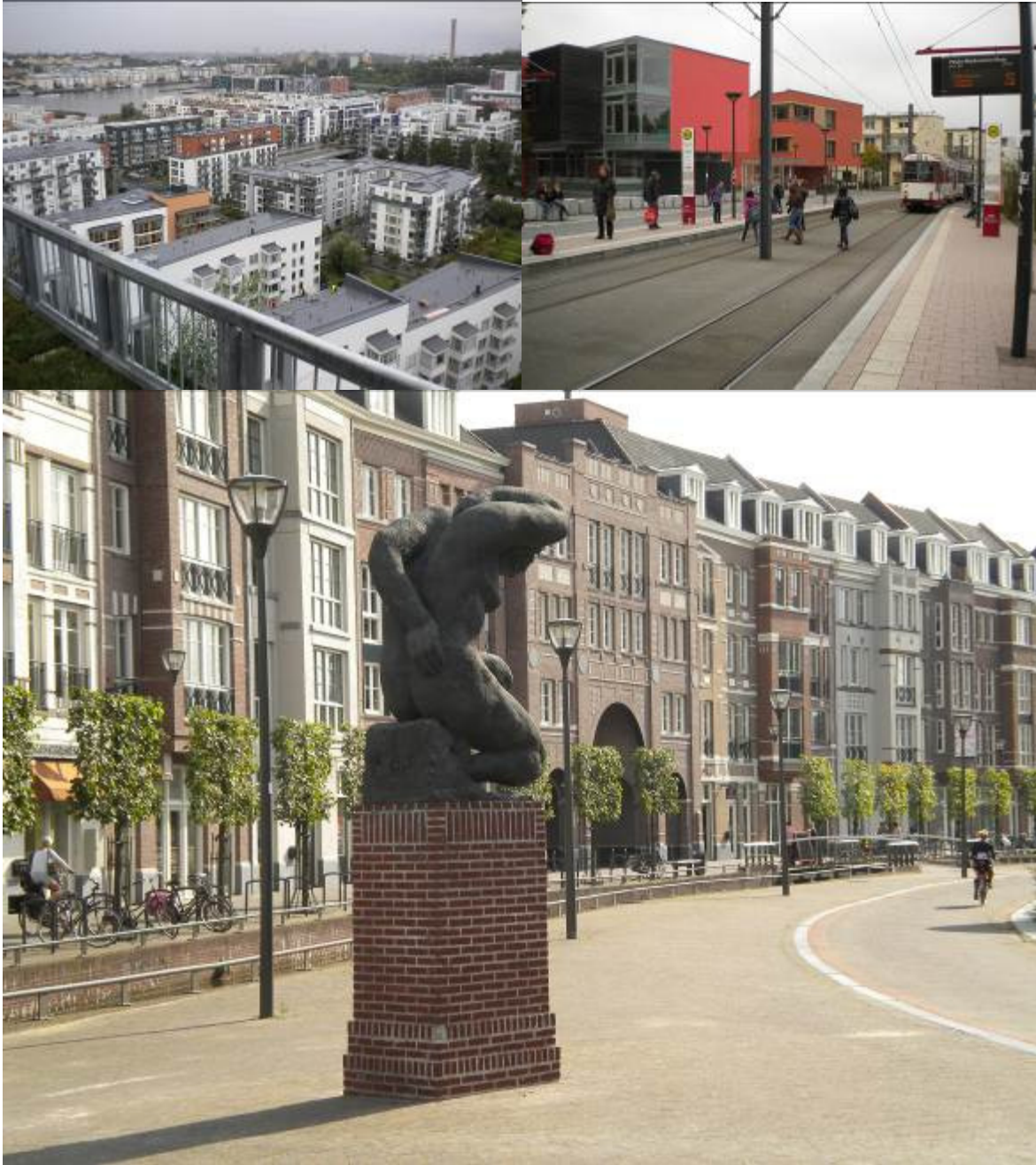
Figura 04 Symbiocity Hammarby Sjöstad en Estocolmo, Suecia. 2010.