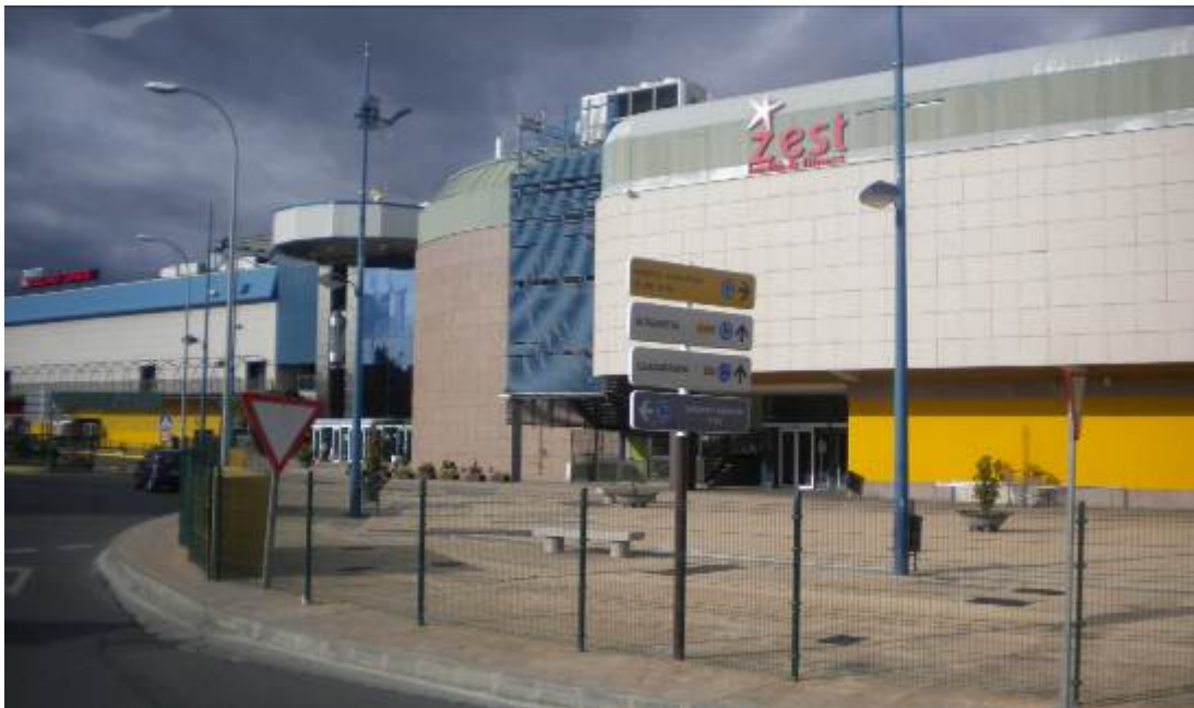
Figura 03 Transferencias del modelo norteamericano al contexto europeo. Nuevos artefactos urbanos en los territorios suburbanos de Madrid, España. 2010.