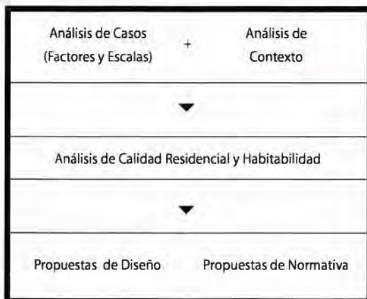
Cuadro 6. Síntesis Metodológica

comparación con las normas, estándares o criterios existentes (cuando no existieran tales normas en Chile, se tomarían ejemplos internacionales). Del análisis de contexto, se obtendrán las propuestas en cuanto a sus posibilidades y ubicación. Ambos análisis son esenciales en el análisis de calidad residencial y habitabilidad del actual proceso habitacional chileno. Estos resultados serán utilizados para realizar propuestas de diseño a nivel de manuales, normativas en áreas concretas de la norma chilena incluyendo especificaciones técnicas, licitaciones, normas, estándares, decretos y ordenanzas de construcción.