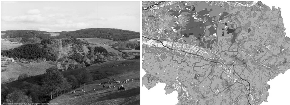
Figura 2: Matriz de paisaje rural, compuesta por diversos parches (áreas de prados destinadas a pastoreo, masas de bosques destinadas a producción maderera, áreas de flora nativa) conectados por corredores (cuencas, microcuencas y caminos)

Bajo esta perspectiva ecológica, el paisaje constituye un modo de organización de la superficie terrestre. Cada porción de la superficie guarda la historia del flujo de energía solar que recibió y que es el causante de los procesos geomorfológicos y de la distribución de la flora y fauna en ese espacio a lo largo del tiempo. Estas formas características de una determinada área se denominan patrones . A su vez, el patrón no es homogéneo, sino que está conformado por parches de usos diferentes (geoformas, tipologías vegetales, usos de suelo, etc.), conectados entre sí por corredores (áreas que interrelacionan a los parches). Todos estos elementos, es decir, parches, corredores y patrones, componen la matriz de paisaje , que es el modo de organización particular de una porción de la superficie terrestre (Di Pace et al, 2004). El término paisaje es usado muchas veces en lugar de la expresión configuración territorial , aquel conjunto de elementos tanto naturales y artificiales que le son característicos a una determinada área. En rigor, según Santos (2000), la palabra paisaje se refiere a la porción de la configuración territorial que es posible abarcar con los dispositivos perceptivos, entre ellos la visión. Así, cuando se habla de paisaje se hace también mención al territorio, desde la mirada que lo contiene, juntando objetos pasados y presentes en una construcción temporalmente transversal, como “ presente de los objetos de todas las épocas ” (Santos, 2000).