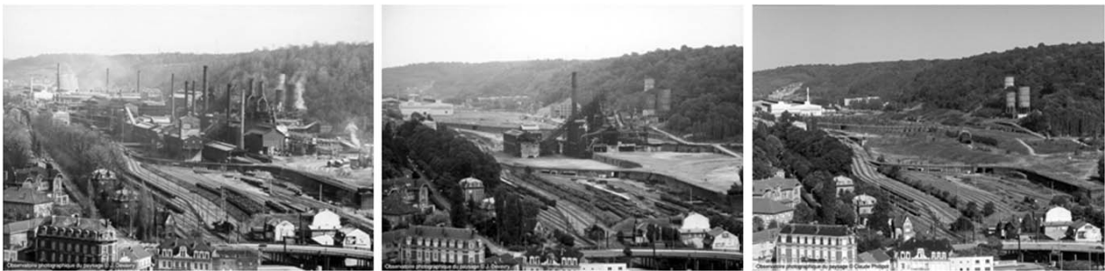
Figura 4: Recuperación, ordenamiento y puesta en valor del territorio (antiguas zonas industriales).

Como señala Ábalos (2005), repensar el espacio urbano y el territorio desde el paisaje permitirá individualizar estrategias, lugares y programas para equilibrar los déficit medioambientales de la ciudad y su oferta de ocio y productividad, mejorando la calidad de vida y la sustentabilidad de la ciudad en el marco de la economía global, desde el contexto local. Ello demanda el desarrollo de análisis e intervenciones ligados a una concepción productiva de los recursos naturales desde la experimentación de metodologías en las que confluyan los aspectos económicos, arquitectónicos, urbanísticos, ecológicos y sociales, para generar nuevas visiones y concepciones de ciudad: “para construir, en suma, una mirada actualizada sobre el medio urbano, de la cual podrán obtenerse resultados beneficiosos en la medida en que podamos aunar sinérgicamente las cuestiones tipológico-constructivas y las paisajísticas” . (Abalos, 2005: 54)