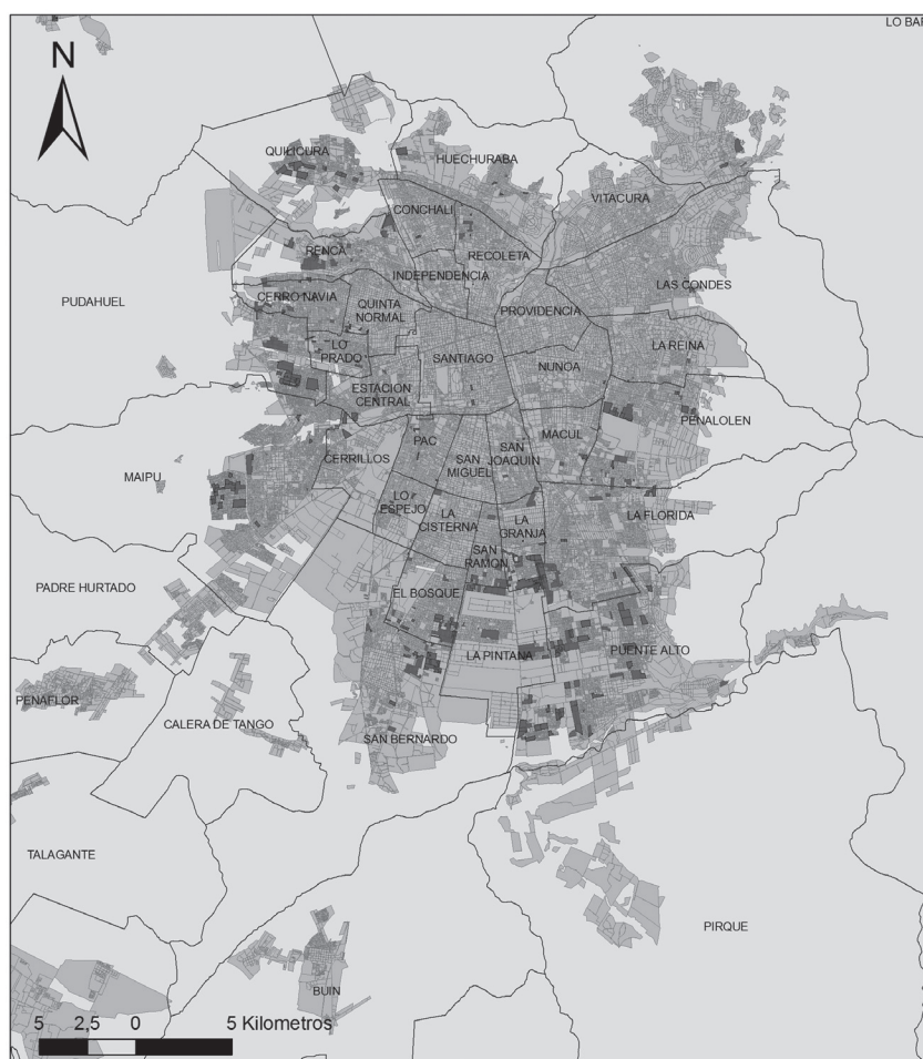
Figura N° 3 Localización de conjuntos de vivienda social en Santiago de Chile. Período 1980-2010 (en negro los conjuntos de viviendas sociales)

Fuente: Elaboración propia a partir de antecedentes del Ministerio de Vivienda y Urbanismo, Chile.