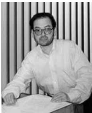
CORTÉS, RENÁN (1958)

De principio a fin , dedicada a Valentina Nobizelli, consta de dos movimientos que dieron el título a la obra. El primero, rápido, se denomina ‘Principio’ y el segundo, lento, se llama ‘Fin’. El instrumental empleado en la creación es el siguiente: 3 platillos suspendidos, 2 tom toms, 4 templeblocks, castañuelas, 2 woodblocks, cencerro, caja, triángulo y 5 campanas tubulares. Estas últimas aparecen en sólo dos momentos del primer movimiento; es decir, todos los instrumentos, con excepción de las campanas, son de afinación indeterminada. Formalmente ‘Principio’ está constituido por tres partes, precisamente separadas por la aparición breve, pero determinante, de las campanas tubulares. En el segundo movimiento, ‘Fin’, son los platillos suspendidos los que juegan un papel principal en la sintaxis de su sencilla estructura, construida sobre la base de gestos instrumentales específicos y reconocibles”.