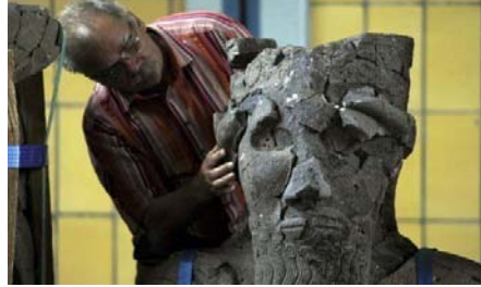
Museo del Cairo y sus daños

Han cambiado las guerras . Siglos atrás eran batallas hombre contra hombre. Luego de la revolución industrial, el traslado de hombres fue por tren y barcos, produciendo más muertes, es decir un triunfo mayor. Después ya las guerras del siglo pasado con ataques aéreos, las cuales han destruido patrimonio cultural, por ejemplo en Europa, hoy reconstruido. No obstante, no es igual ver un original que una copia por muy buena que sea. Después, en los 60, la guerra fría y hoy día guerras en las que se permite cualquier cosa. No hay ética ninguna y menos aún un real respeto frente al patrimonio cultural del país que se ataca, esto lo podemos monitorear todos los días en el Disaster Relief Task Force, Directorio al que pertenezco desde hace más de un año. Daños en Mali (Tombuctu), en Siria, el patrimonio es rehén de la guerra (Damasco donde se realiza saqueos en el Museo Nacional, daños en el muro de la fortaleza de Qalaat al Mudiq, etc...)