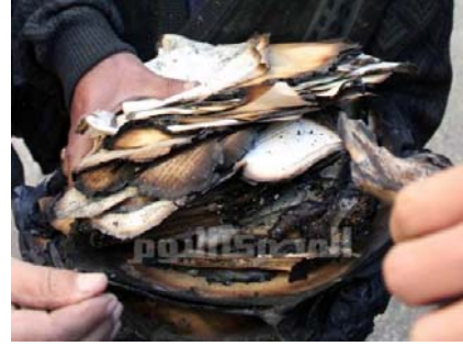
Instituto Egipcio del Cairo

Desgraciadamente, también tengo que nombrar los desastres naturales , terremotos, huracanes e inundaciones, que debido al calentamiento global de la tierra son cada vez son más intensos. La Antártica se derrite. Todo el mundo se pelea por la tierra que comienza a aparecer, ya que sueñan con petróleo y otras riquezas ocultas, pero no piensan lo que significa esto para el patrimonio animal: por ejemplo los osos polares, pingüinos, ¡ni en los 10 cm que ha aumentado el nivel del mar!