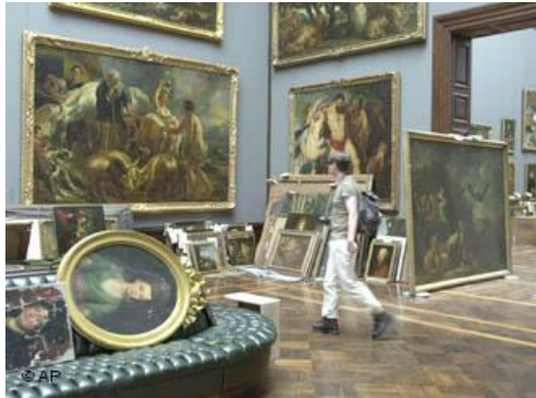
Inundaciones: Museo Dresden Alemania