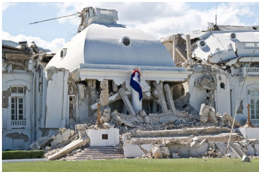
Terremotos: Haití, Casa de gobierno

Inundaciones recientes en China, India, Colombia, Pakistán, Alemania, Queensland, huracanes en USA, en el Caribe, afectando nuevamente a Haití que todavía no se había recuperado del gran terremoto que azotó al país, terremotos en Chile, Turquía, Perú, México, Japón, Italia .... Sería larguísimo nombrar a todos, son muchos los países azotados por desastres naturales. Se han realizado grandes estudios del porqué de las cosas, se realizan congresos, asambleas para lograr que los países contaminen menos...sin gran resultado ya que detrás de esto está el bienestar y la riqueza de los países cuestionados.