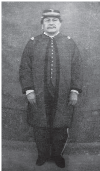
IMAGEN 1: Manuel Namuncura en Fortín Rocha 1884. (Viganti, 1963:54).

Comenzaremos con dos fotografías distantes de un poco más de cien años y que en cierta forma articulan dos vértices de una serie de escándalos que han enmarcado el problema de la enunciación o de la representación de lo mapuche tanto en Chile como en Argentina. 1