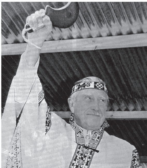
IMAGEN 2: Pinochet en Cholchol 1989 (Revista Que Pasa febrero 2005:12).

La primera fotografía fue tomada en junio de 1884 en Buenos Aires, la segunda en febrero de 1989 en la pampa Pihuichén, comuna de Cholchol. La primera retrata al famoso cacique Manuel Namuncura en la capital argentina, a donde llegaba a negociar sólo algunas semanas después de su rendición ante las autoridades del ejército argentino en Fortín Roca, ocasión en la que le fue obsequiado el uniforme de coronel con el cual lo vemos posando.