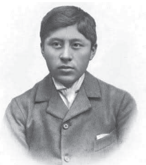
IMAGEN 5: Ceferino Namuncura en 1905 (David, 2009:145).

Inversamente, la reencarnación de Pinochet en un cacique mapuche se puede entender como la captación de la mapuchidad por parte de este discurso soberano y nacionalista (del que el pinochetismo sería una de sus formas radicales). Este doble movimiento puede resumirse de la siguiente forma: si la escena de 1989 significaría que tras Pinochet (como máxima encarnación del poder soberano) hay un lonko (es decir una autoridad mapuche), la fotografía de 2007 significaría que tras todo lonko