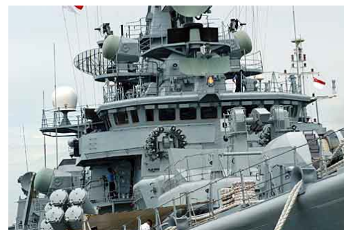
Electrónica india aplicada a la defensa