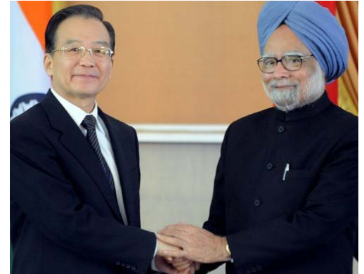
Primer Ministro de China, Wen Jiabao y Primer Ministro de India, Manmohan Singh

Antecedente importante al hacer un análisis de posibilidades de expansión asociada entre India y China, es que ya hay empresas que lo están haciendo y nada menos que en Estados Unidos. Llama la atención que sea en Norteamérica, donde justamente esas empresas han tenido más éxito con sus inversiones, aún siendo los EE.UU. quien más ha criticado la desleal competencia que hace China, o bien quien hace reparos a situaciones humanitarias o de tensiones sociales, para el caso de India. Veintidós de sesenta proyectos tecnológicos importantes comenzados en Estados Unidos en el 2010, eran de chinos en asociación con pares indios, y todos éstos ya están ahora enlistados con gran éxito en el índice NASDAQ.