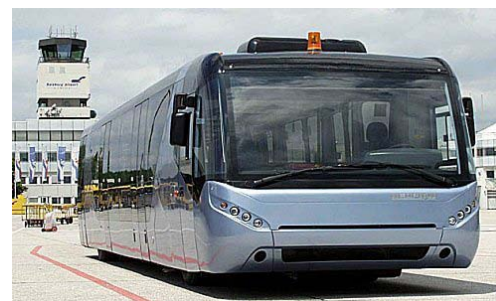
Bus eléctrico indio, que usa la más avanzada tecnología