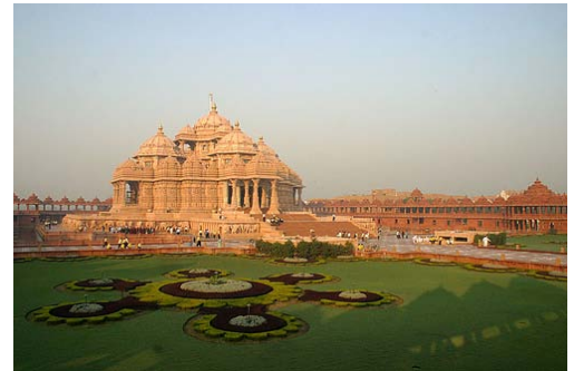
Akshardham Temple Monument to World Peace. Delhi, India

Nuestra posición en virtud al Tratado entre India y Chile nos da enorme ventaja sobre cualquier otro país de Latinoamérica 4 . Para India, Chile es un socio prestigioso y creíble. Chile posee una perspectiva económica y política muy parecida a la de India. Ambos países se han sometido a importantes reformas económicas y han reiterado su compromiso con la democracia parlamentaria.