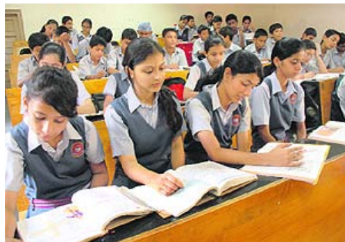
Estudiantes de 3° de Educación Media