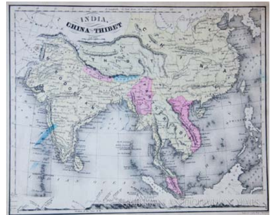
India y China comparten una larga frontera donde no han faltado los roces. Pero, eso es ahora pasado.