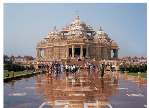
Toda vez que India ha sido fuerte e influyente, ha levantado sus templos; este es el monumental templo de Akshardham, recientemente inaugurado.