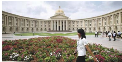
Todas las grandes empresas indias mantienen muy avanzados programas de entrenamiento permanente para sus empleados. INFOSYS, y su convenio con La Universidad de Mumbai (en la foto).

El número de hogares indios con capacidad de gasto medio (algo así como el estrato chileno C1-C2), suma cien millones de personas. Cifra enorme que es mayor que la de un país europeo grande; y es suficiente para animar a cualquier aventura de negocios. Además, no hay que hacer traducciones complicadas. Basta con etiquetas y catálogos en inglés, y listo. Por lo demás, se pueden encargar a la misma India, donde las corrigen y las hacen con el gusto de ellos.