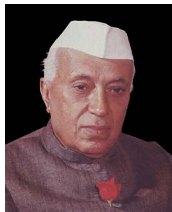
Jawaharlal Nehru: "Sueño con una India libre, fuerte, democrática, y amiga de la humanidad.."