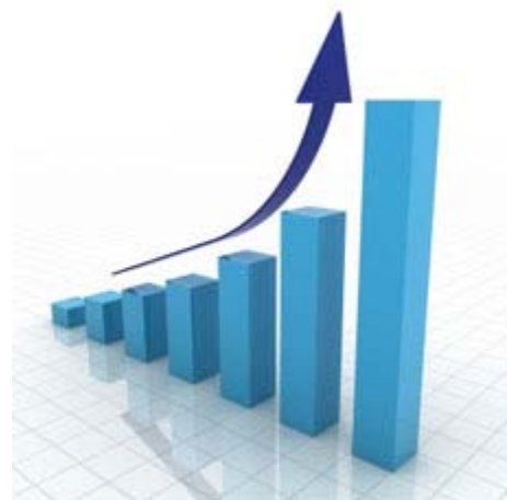
Tendencia de la industria farmacéutica india