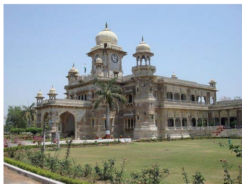
Daly College, en Indore, Madhya Pradesh