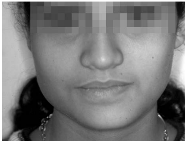
Figura 1. Aumento volumen ángulo mandibular derecho. Figure 1. Increase in the right angle region.

El diagnóstico fue de hipertrofia maseterina unilateral derecha por lo que se decide la resección del ángulo mandibular derecho por vía extraoral.