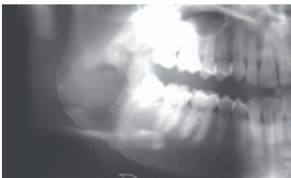
Figura 3. Ortopantomografía 6 años postcirugía.

Figure 2. Increase right mandible angle.