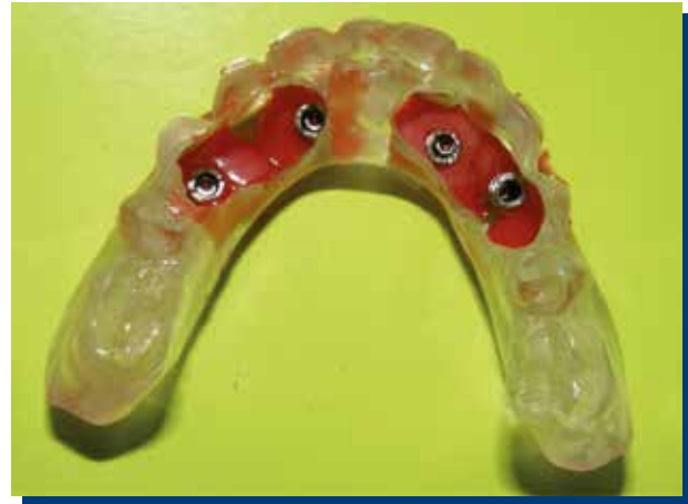
Figura 6. Cubeta multifuncional desmontada de boca ferulizada con pilares protésicos de titanio.