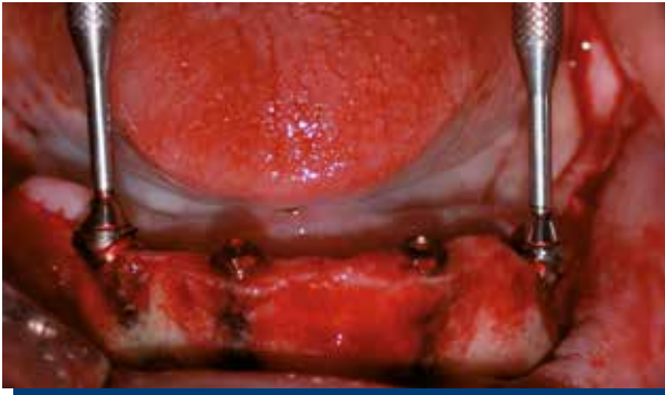
Figura 3. Implantes instalados y compensados con sus pilares angulados en 30°.