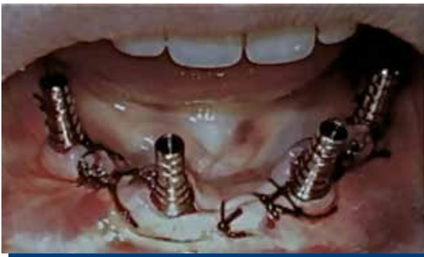
Figura 4. Pilares protésicos de titanio.