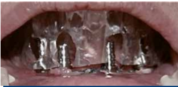
Figura 5. Pilares protésicos de titanio cortados con cubeta multifuncional ahuecada y definida sus ventanas vestibulares en posición MIC, lista para ser fijada con acrílico.