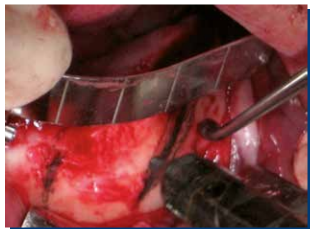
Figura 1. Definición de la trayectoria del implante inclinado apoyado por guía All on-4 (Nobel Biocare).

Terminada la cirugía en la clínica se insertan y cortan los pilares de titanio para multiunit y se perfora la cubeta multifuncional transparente para permitir su paso y asentamiento si contacto entre los pilares y ella, permitiendo así una posición de mordida en MIC, luego se perfora por vestibular a la altura de los pilares con el fin de hacer 4 ventanas que permitan su visión y fijar la cubeta multifuncional mediante acrílico de auto