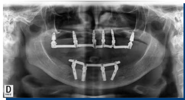
Figura 7. Radiografía panorámica de control de implantes y barra de titanio.

curado: Para finalizar se inyecta silicona en los espacios abiertos entre la mucosa y la cubeta multifuncional y se toma un registro de mordida en MIC de la estructura fijada (Figuras 4 a 6).