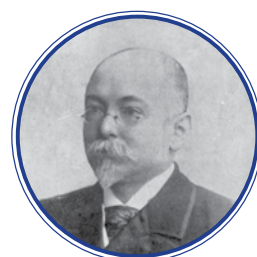
Valentín Letelier Rector 1906-1911