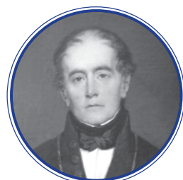
Andrés Bello Rector 1843-1865