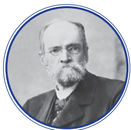
Diego Barros Arana Rector 1893-1897

f) con nueve programas nuevos de Magíster y con dos nuevos programas de Doctorado, habiéndose acreditado en el año 2007 doce programas de magíster y cuatro programas de doctorado, así como se han reacreditado cuatro programas de magíster y ocho programas de doctorado; con 32 carreras de pregrado acreditadas y 12 más en proceso de acreditación, y –considerado el postgrado en su totalidad- con 34 de sus 35 programas de doctorado acreditados y con 70 de sus 115 programas de magíster acreditados;