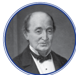
Ignacio Domeyko Rector 1867-1883