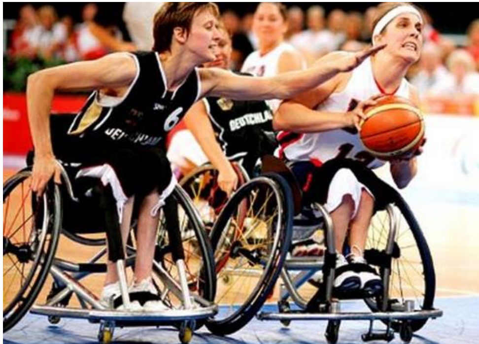
Imagen 20: El básquetbol en silla de ruedas es uno de los deportes paralímpicos más populares a nivel mundial y también más antiguos.

En el básquetbol en silla de ruedas los equipos también están formados por doce jugadores, con un máximo de cinco en pista. A cada deportista se le asigna una puntuación entre el 1.0 y el 4.5, según su habilidad funcional. Durante el juego, la suma de los puntos de los cinco jugadores en pista no puede exceder de 14.