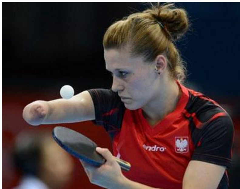
Imagen 19: La polaca Natalia Partyka, en una de sus presentaciones en los últimos Juegos Paralímpicos de Londres 2012.

1-5: Es exclusiva para los atletas en silla de ruedas y a menor número, mayor es el grado de discapacidad.