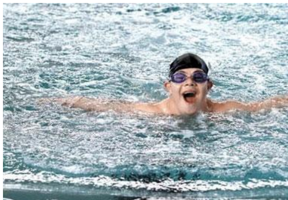
Imagen 7: Diversos estudios confirman que el deporte entrega muchos beneficios a las personas con algún tipo de discapacidad.

La internalización de normas, donde las reglas de un juego o un deporte funcionan como adquisición de un componente regulador que permite el respeto de pautas de convivencia grupal; la integración que una práctica deportiva conlleva, en cuanto a ser una oportunidad para compartir con otros -que tengan o no algún grado de discapacidad- fueron algunos de los puntos que destacó el análisis.