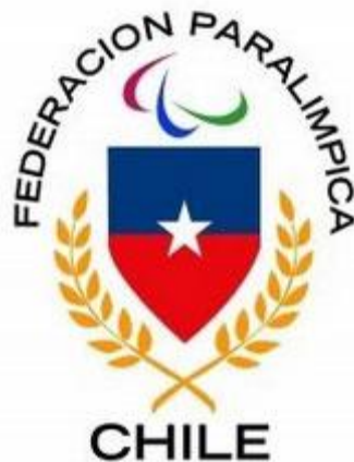
Imagen 9: Insignia de la Federación Paralímpica de Chile, el organismo que hasta 2012 estuvo a cargo de las disciplinas para atletas de alto rendimiento con algún tipo de discapacidad.