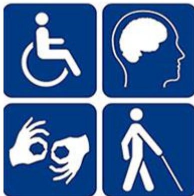
Imagen 2: Las deficiencias físicas-motoras, cerebrales y sensoriales son las que más prevalecen en la población chilena.

el 9,0% dijo tener deficiencias intelectuales, un 8,7% deficiencias auditivas y el 7,8% deficiencias psiquiátricas 14 .