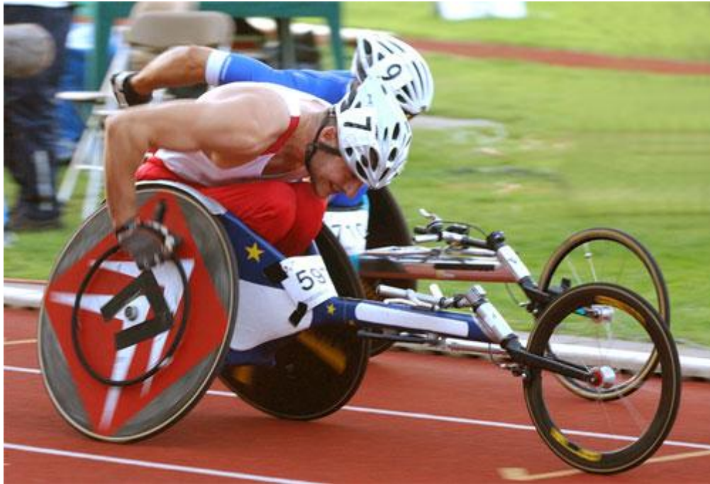
Imagen 14: Deportistas compiten en la modalidad de atletismo paralímpico.

11-13: Se refiere a las personas con discapacidad visual. Los deportistas que compiten en la clase 11 son aquellos que tienen ceguera total y deben realizar las pruebas con un guía. En tanto, a la clase 12 y 13 pertenecen los deportistas que tienen una discapacidad visual, donde la presencia de un acompañante es optativa.