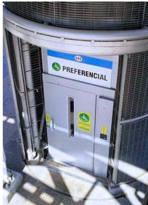
Imagen 3: Ascensor preferencial del Metro de Santiago.

Diagnóstico de Accesibilidad y de esta forma evaluar la implementación realizada y efectuar propuestas de arreglos concretos.