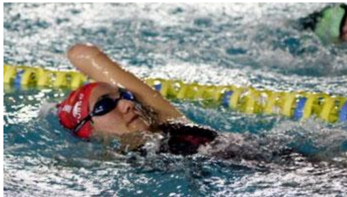
Imagen 16: Deportista paralímpica compitiendo en la especialidad de espalda.

Las personas con discapacidad física y con parálisis cerebral compiten en categorías conjuntas, mientras que los ciegos y participantes con deficiencias intelectuales tienen su categoría independiente.