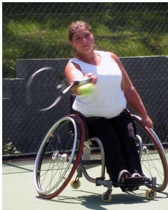
Imagen 8: María Antonieta Ortiz es una destacada tenista paralímpica, que ha representado a nuestro país en diversas competencias internacionales, entre ellas los último Juegos Paralímpicos de Londres 2012.