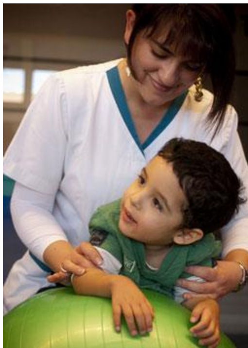
Imagen 4: Kinesióloga realizando terapia de un niño en uno de los institutos de la Fundación Teletón.

Posteriormente, a través del decreto supremo N° 59 del Ministerio de Justicia, el 22 de enero de 1986, fue aprobada la personalidad jurídica de la Fundación Teletón 24 , que desde ese momento quedó a cargo de la organización y administración de la recaudación de fondos de la Sociedad Pro Ayuda al Niño Lisiado. Así es cómo la Fundación Teletón comenzó a obtener recursos - principalmente a través del evento televisivo y de otros organizados por la entidad- para destinarlos a satisfacer las necesidades de esta causa benéfica.