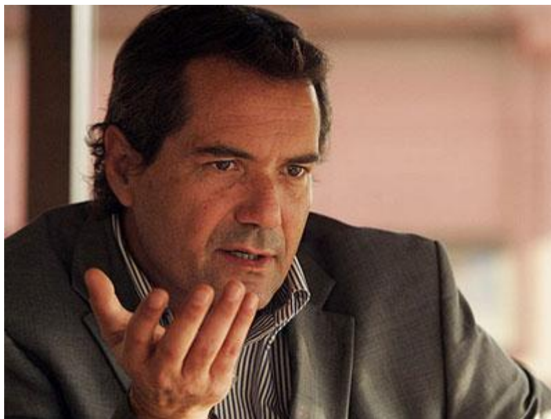
Imagen 14: Neven Ilic es la máxima autoridad del Deporte Olímpico en nuestro país.

que los deportistas chilenos se muestren en su país, pero ese es realmente el enfoque que va a tener” 148 , cuenta el presidente del Comité Olímpico de Chile.