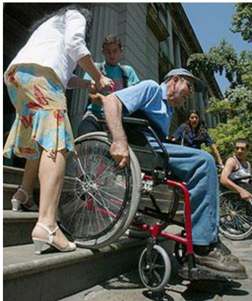
Imagen 1: Hombre en silla de ruedas recibiendo ayuda para bajar las escaleras de un edificio público en Santiago. Fuente: