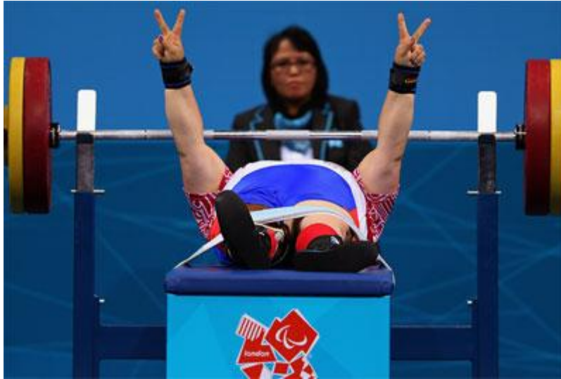
Imagen 17: El levantamiento de pesas paralímpico es exclusivo para deportistas con deficiencia física en sus extremidades inferiores y/o parálisis cerebral.