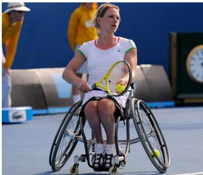
Imagen 18: La tenista paralímpica holandesa Esther Vergeer preparándose para hacer el saque desde su lugar.