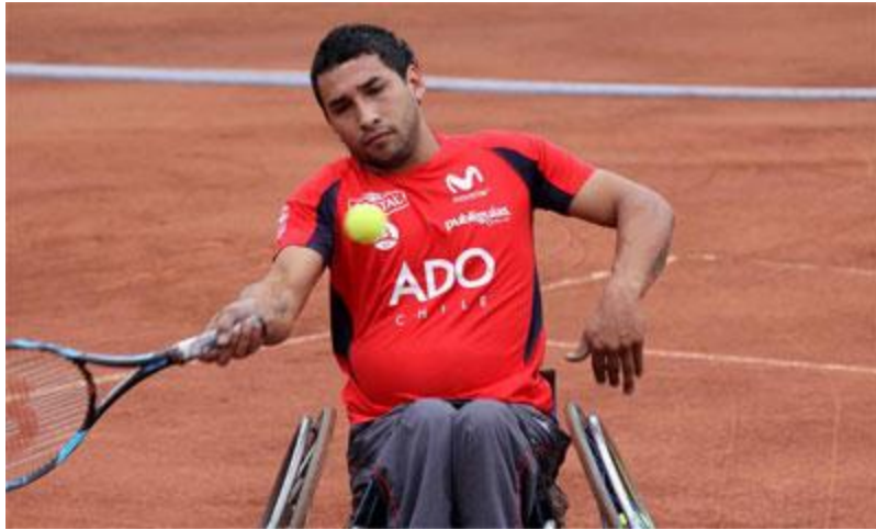
Imagen 10: Robinson Méndez es uno de los tenistas en silla de ruedas más destacados de Chile y Latinoamérica.