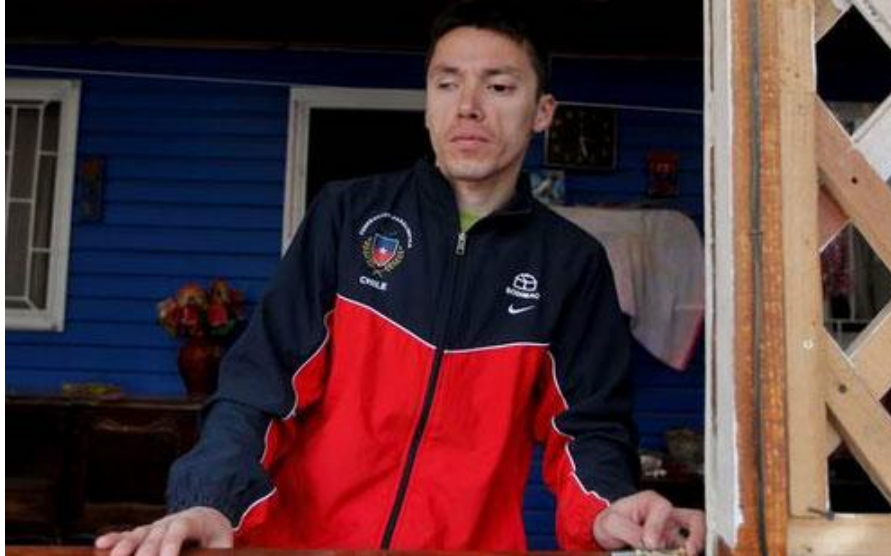
Imagen 12: Cristián Valenzuela, el atleta no vidente que ganó el oro en Londres 2012, perdió este sentido a muy temprana edad.

Poco a poco la pena lo invadió y comenzó a sentir vergüenza de ser ciego. Cristián empezó a alejarse de todo lo que lo rodeaba y abandonó el colegio, a sus amigos e incluso a “su mamita”. Su pieza era el único lugar donde se sentía a gusto y la máquina de escribir fue su compañera durante los años más difíciles que le ha tocado vivir. El pequeño de 12 años aprendió a usar la máquina de escribir y comenzó su terapia de “sanación”.