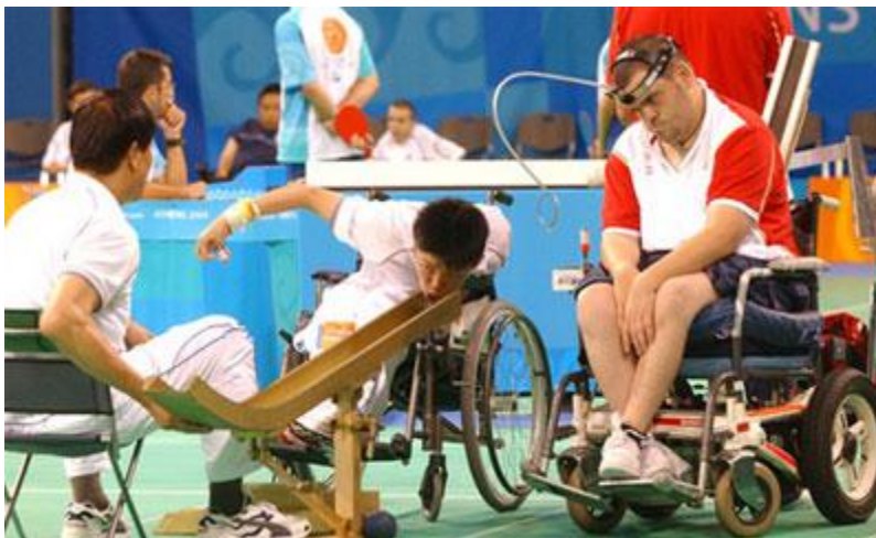
Imagen 15: El juego de las bochas es una actividad exclusivamente paralímpica.

y luego a cada deportista se le designa un color, rojo o azul, para que intente acercar sus lanzamientos a ella.