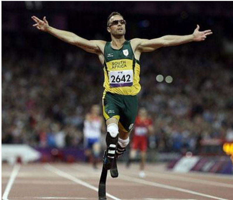
Imagen 11: El atleta paralímpico Oscar Pistorius marcó historia al participar en la versión convencional de los 400 metros los Juegos Olímpicos de Londres 2012.

Faltaba poco para concretar la mayor ilusión de este atleta y en julio de 2012, el Comité Olímpico Sudafricano dio el último paso, al anunciar que Pistorius correría los 400 metros en los Juegos Olímpicos de Londres 117 , participación que se concretó el 4 de agosto donde logró la clasificación a las semifinales de su especialidad, generando la atención de todo el mundo, ya que por primera vez un deportista con prótesis disputaba los JJOO.