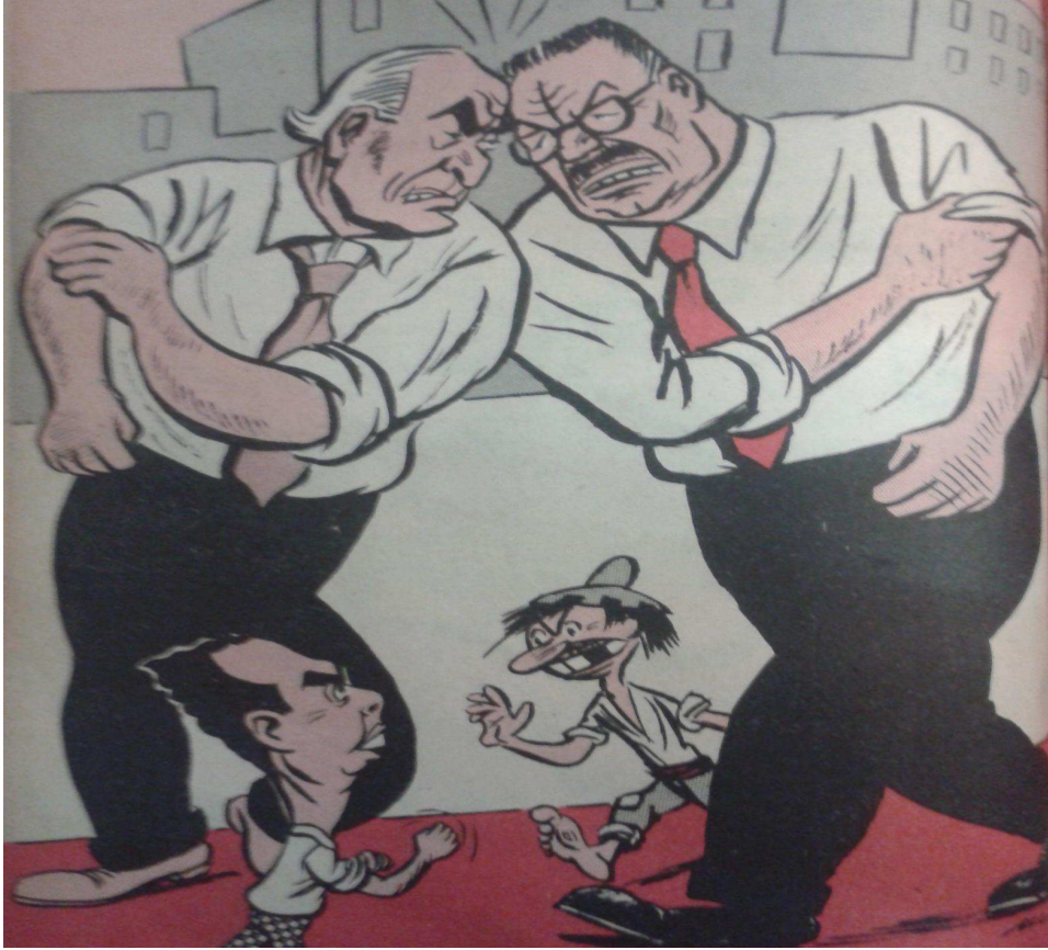
La "pelea" entre Matte e Ibáñez, los candidatos más fuerte de la elección de 1952, en la que pretende intervenir un diminuto Pedro Enrique Alfonso. (Nº 1.011, 29 de enero de 1952, pág. 20).