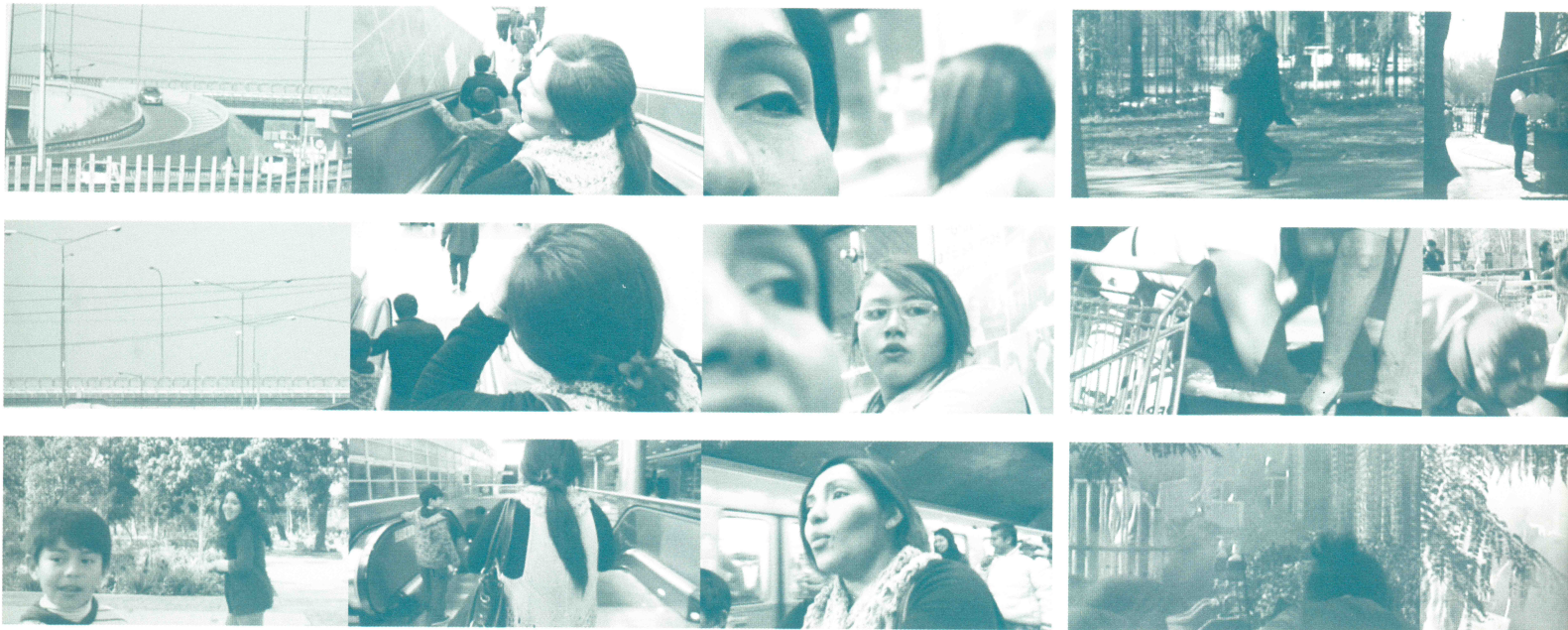
Figura 3. Conformación material del paisaje migrante contrastando los dos viajes realizados en el video. La espectadora, la productora.

para capturar el contraste entre el paisaje de la asistente a la fiesta y el paisaje de la fiesta misma (Fig. 1).