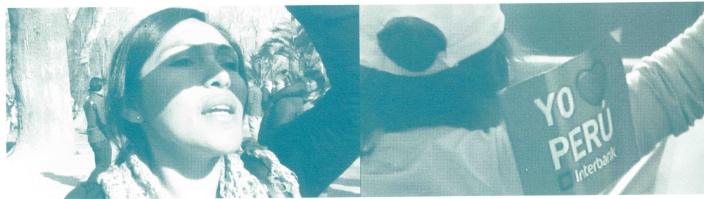
Figura 4. Economías de la nostalgia y el ensamblaje de elementos globalizantes en el paisaje migrante.