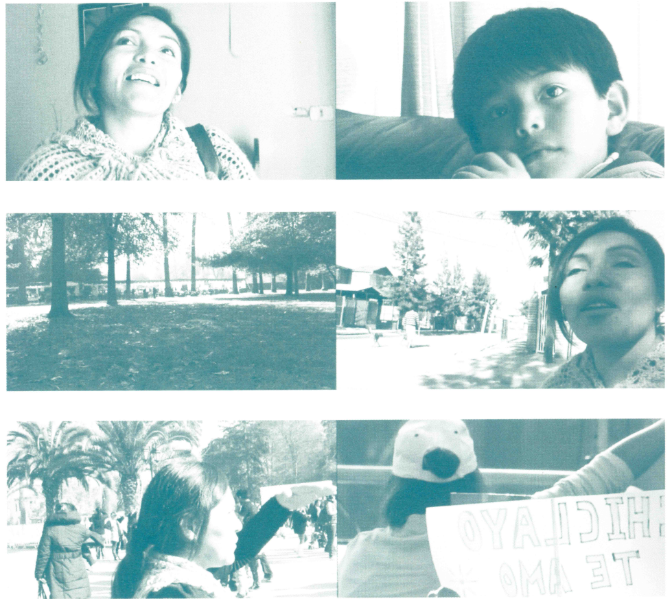
Figura 1. Montaje visual como forma de articular y confrontar imágenes de mensajes contrapuestos y la distancia que establece la protagonista respecto a la fiesta.

ciencia positivista —la apertura a interpretaciones— es una virtud en el conocimiento desde la narrativa (Czarniawska, 2004).