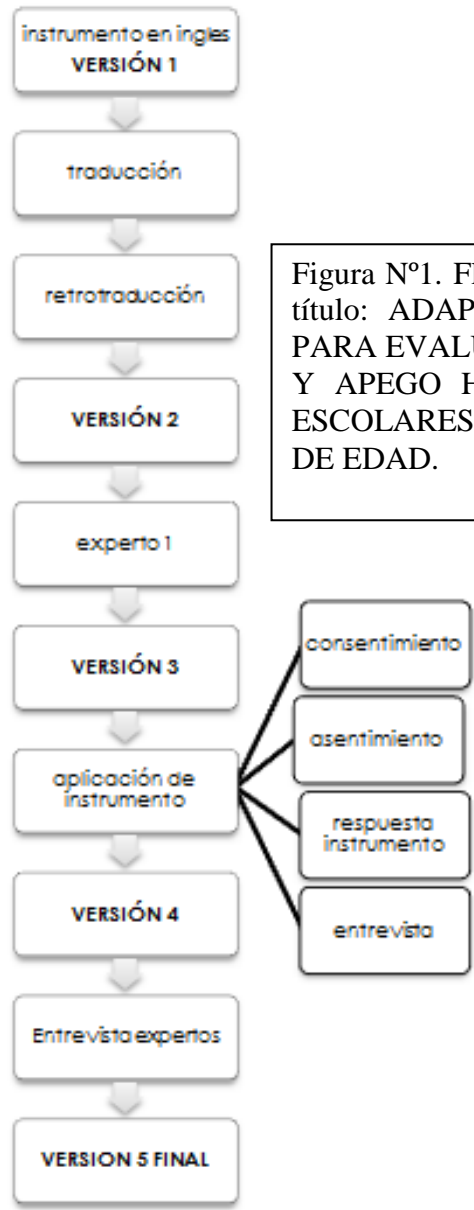
Figura N°1. Flujo del proceso de Memoria de título: ADAPTACIÓN DE UNA ESCALA PARA EVALUAR ACTITUDES, EMPATÍA Y APEGO HACIA LOS ANIMALES EN ESCOLARES CHILENOS DE 9 A 12 AÑOS DE EDAD.